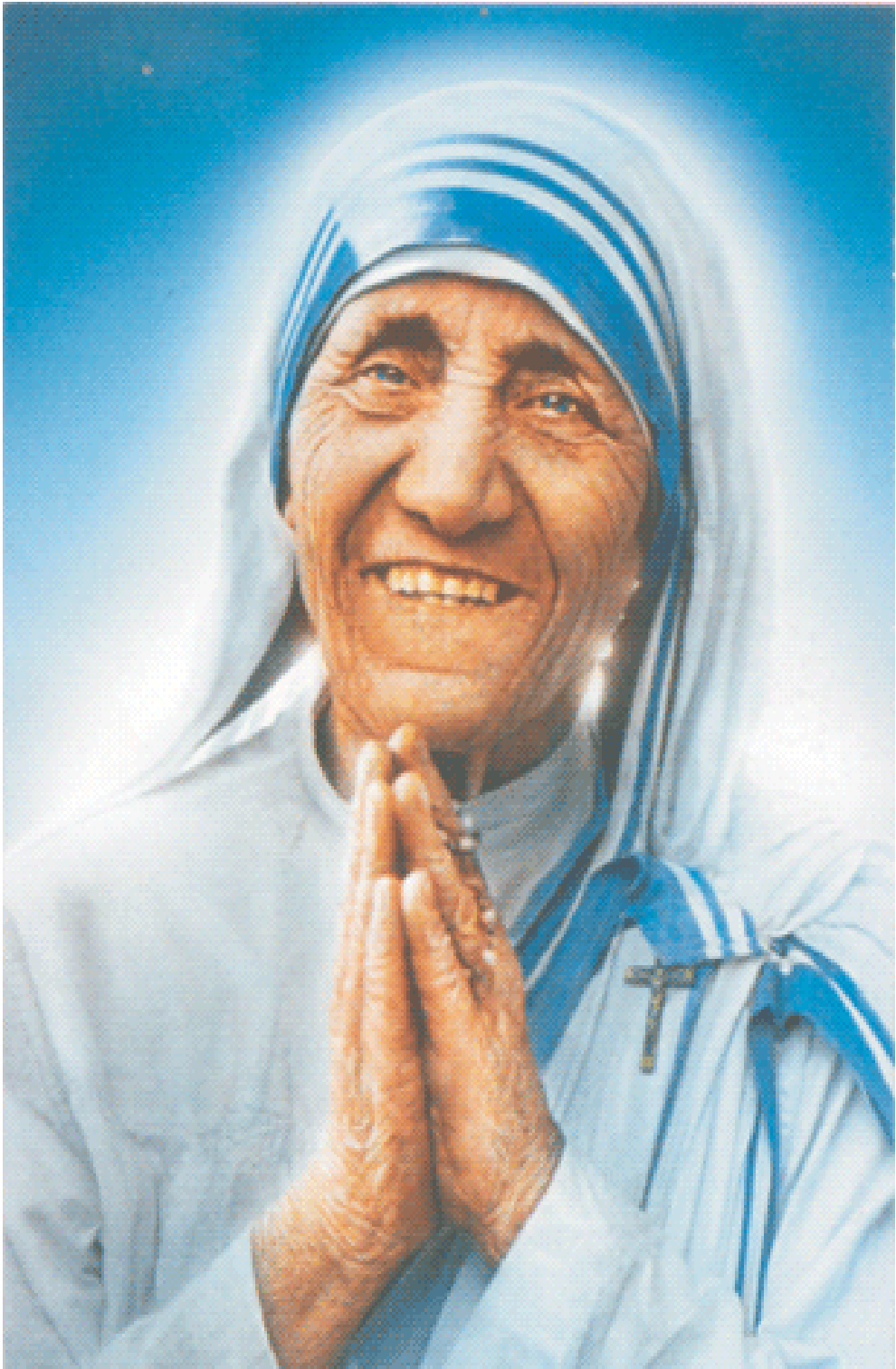
Rahibe Teresa (1910-1997)