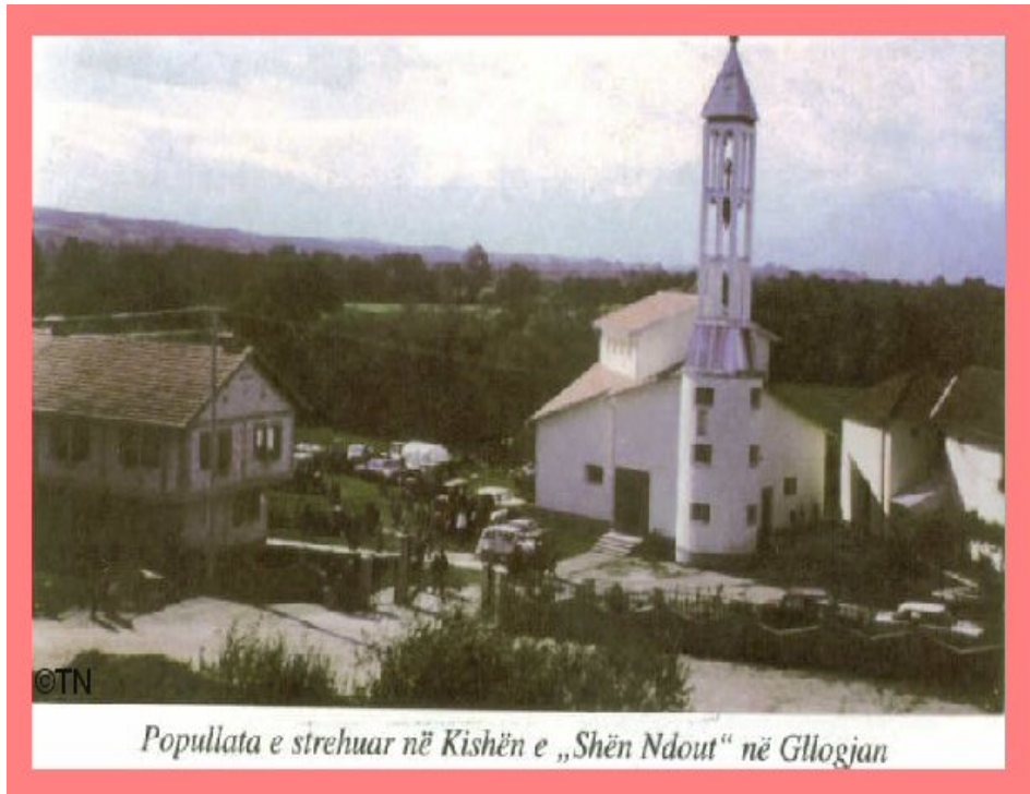
Popullata e strehuar në Kishën e „Shën Ndout“ në Glogjan