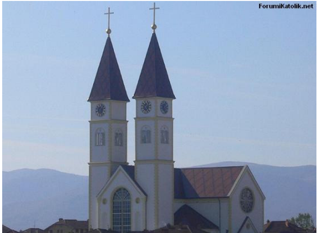
Gjakova'da "Aziz Pavlus" Kilisesi