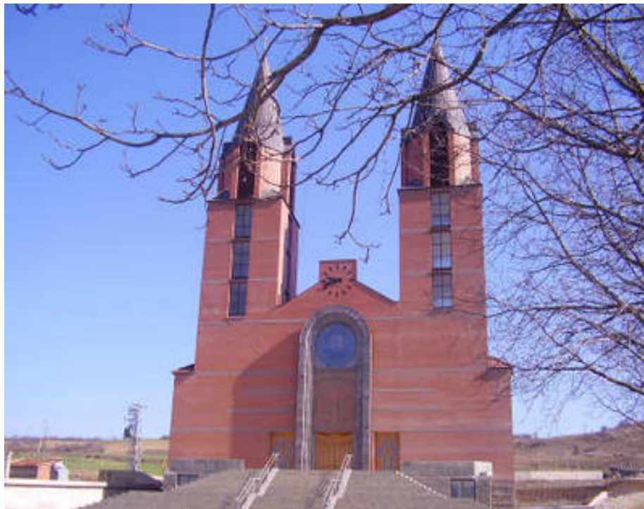
Klina'da "Zoja e Keshillit te Mire" Kilisesi