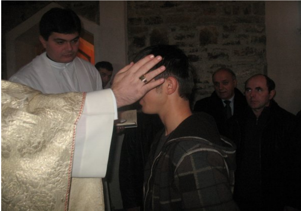
Konfirmasyon (Krezmimi) Ayininden görüntüler