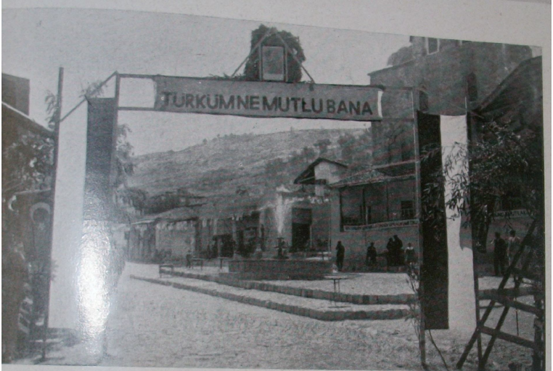
Ölmarmarada Cumhuriyet bayramında yapılan zarif taklardan biri ve yeni açılan meydan ve havuz. 29-10-1937