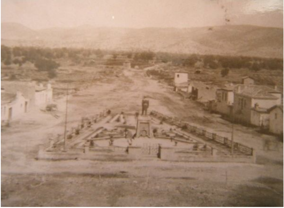
EK.10 GÖLMARMARA ATATÜRK ANITININ 1940'LI YILLARDAKİ GÖRÜNTÜSÜ