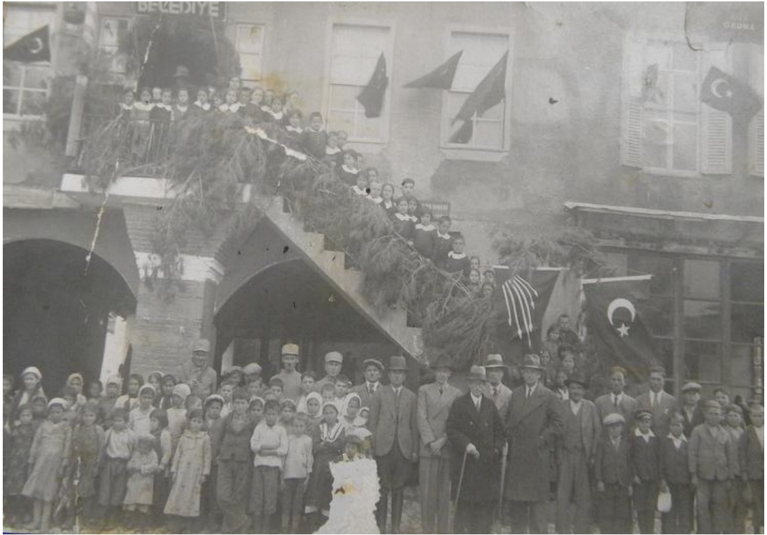
EK 13. ATATÜRK ANITI ÖNÜNE YAPILAN DÜZENLEME SEBEBİYLE TERTİPLENEN TÖREN