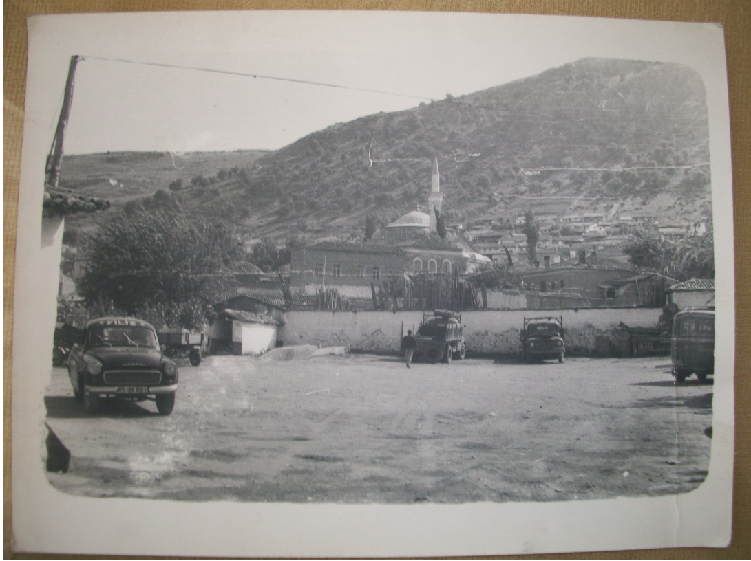
EK 8. ATATÜRK ANITI YAPILMADAN ÖNCEKİ GÖLMARMARA ARKADA MERKEZ İLKOKULU