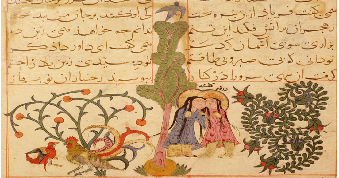
Ek 2: Varka ve Gülşah bahçe tasviri