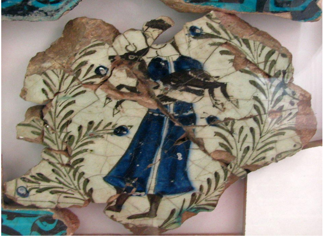
Ek-6 Konya Karatay Müzesi Kubadabad Çinilerinden