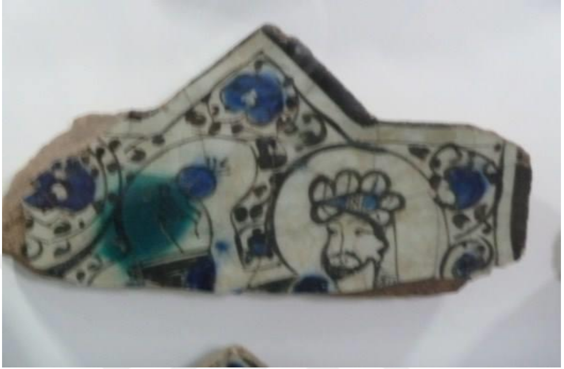
Ek-7 Kubadabad Çinilerinden, Konya Karatay Müzesi