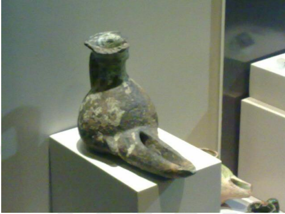
Ek-5 Kandil-Alanya Müzesi