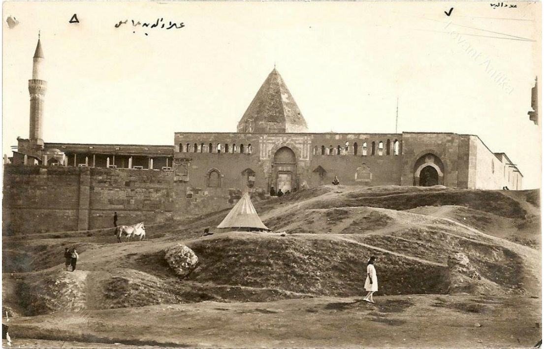
Ek-10 Konya Alaeddin Cami