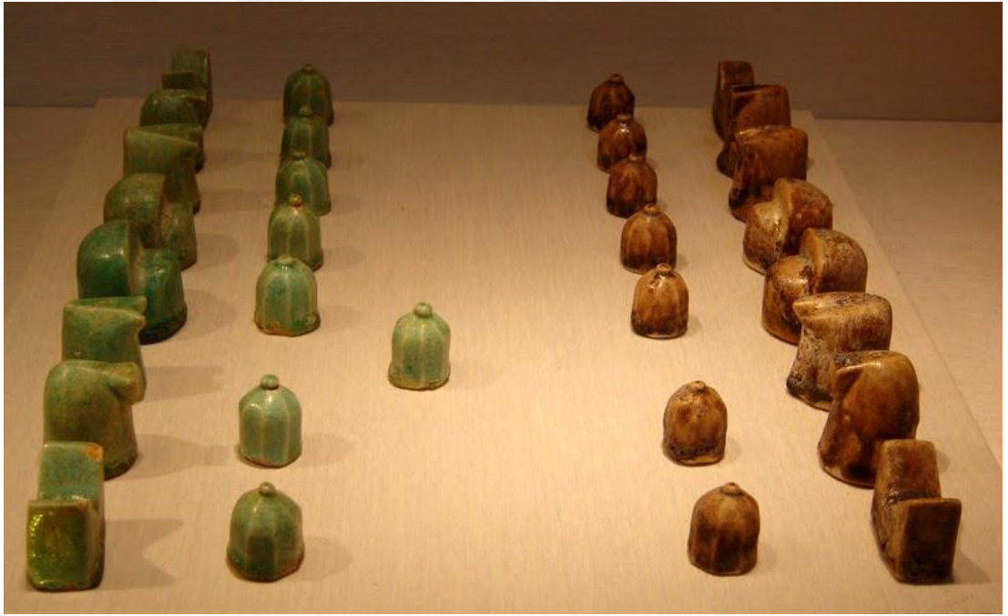
Ek-4 Selçuklu Satranç takımı Metropolitan Müzesi