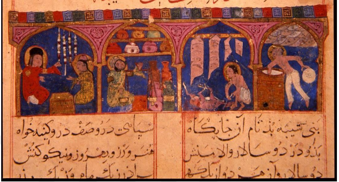
Ek-1: Varka ve Gülşah minyatürü. Çarşıda kuyumcu, eczane, kasap, ekmekçi