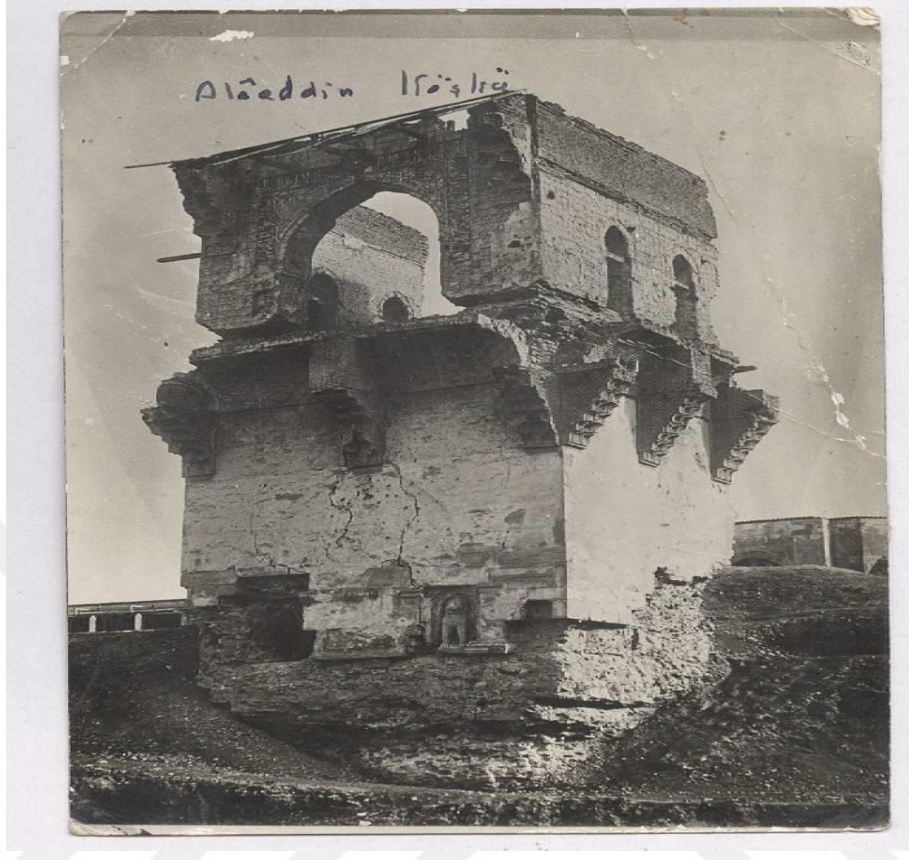
Ek-9 Konya Alaeddin Köşkü