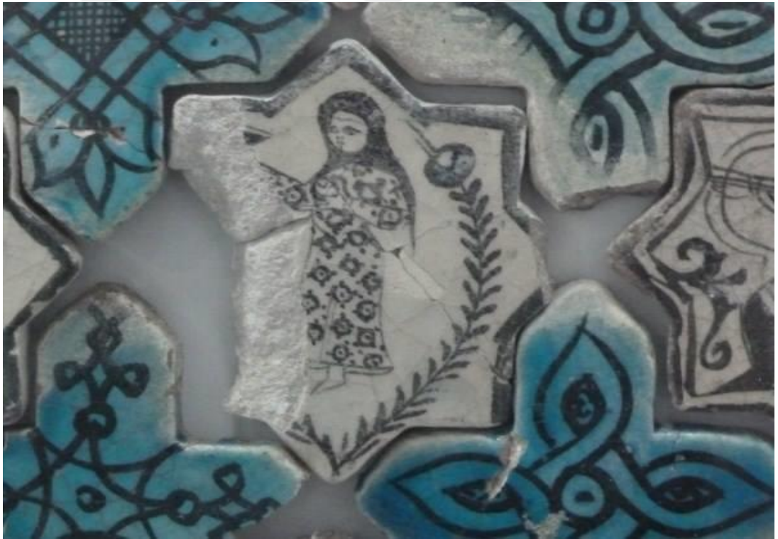
Ek-8 Kubadabad Çinileri, Konya Karatay Müzesi