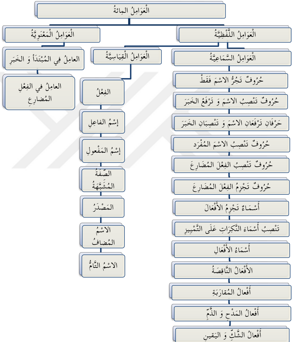
EK 1: el- 'Avâmilü 'l-mi 'e tablosu