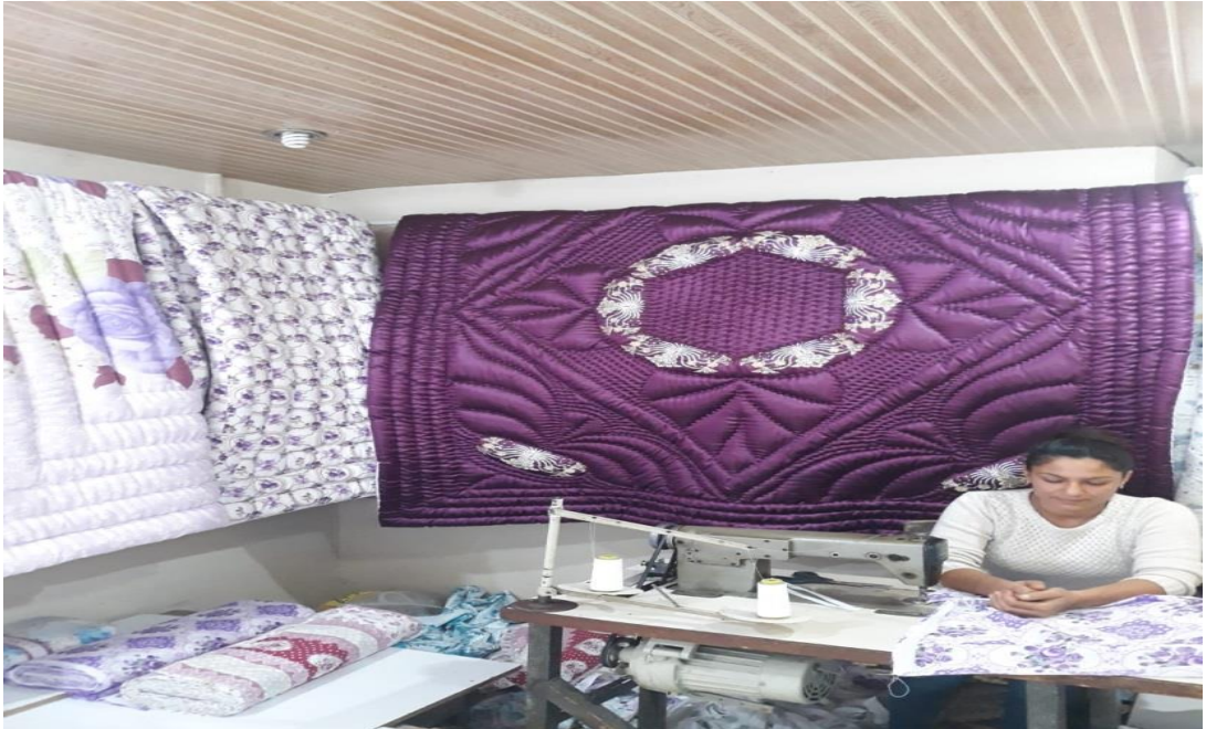
Fotoğraf 10: Kula'da yorgan ustası eşine yardım eden bir kadın ve arkasında motifli yorgan örnekleri