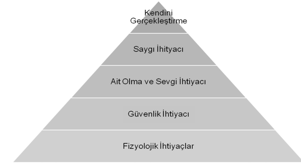
Şekil 2 Maslow İhtiyaçlar Hiyerarşisi

Teknolojinin gelişmesi, sanayileşme, aile bağların zayıflaması, kalabalık şehirler, stresli yaşam, yoğun istekler, bir o kadar yalnız yaşam, teknolojik gelişmelere bağlı olarak asosyal hayat gibi sebeplerden dolayı insanlar her yönden bir baskı altında kalmaktadır. Rekreatyonel faaliyetler ise bu noktada kurtarıcı görevi görmektedir. Gerçekleştirilen etkili etkinlikler bireyde rahatlama, stresli hayattan uzaklaşma, sosyalleşme, zihinsel ve fiziksel sağlık kazanmaktadır. Tüm bu nedenlerden dolayı rekreatyon, modern insanların vazgeçilmez haline gelmeye başlamıştır.