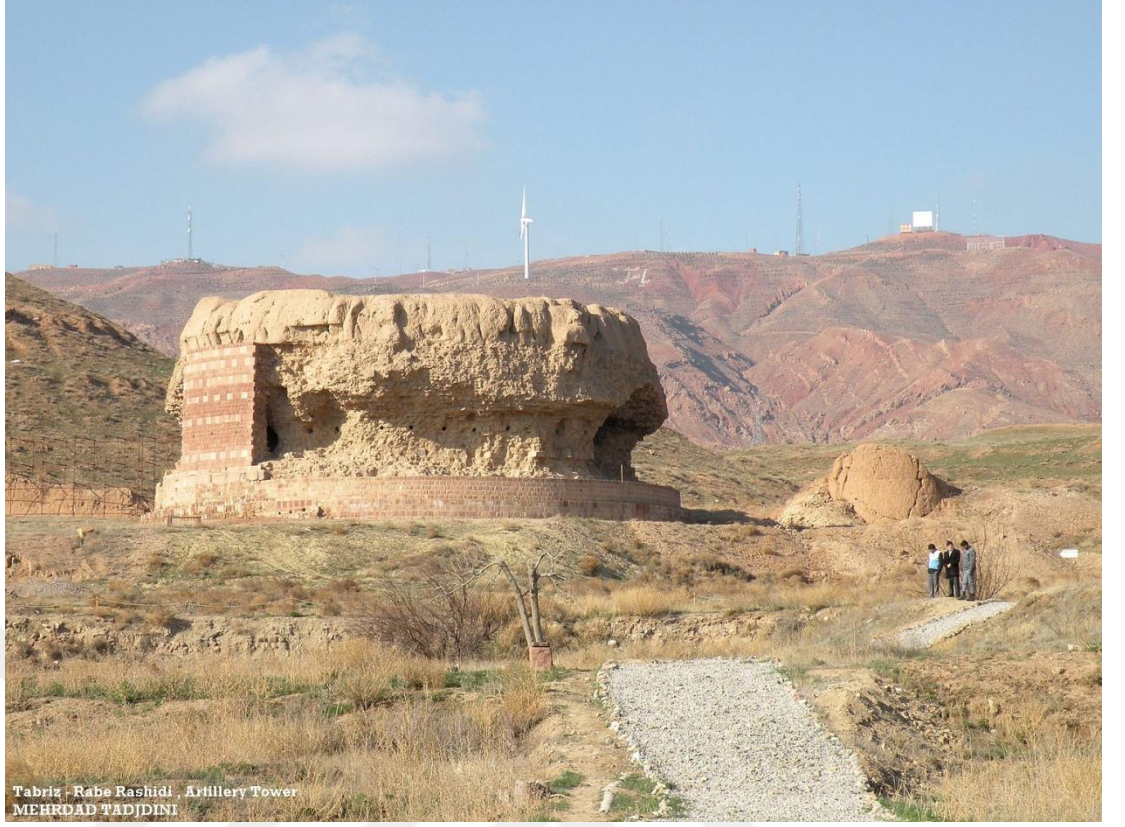
Tebriz'de bulunan Rub-i Reşidi mahallesinden kalıntı