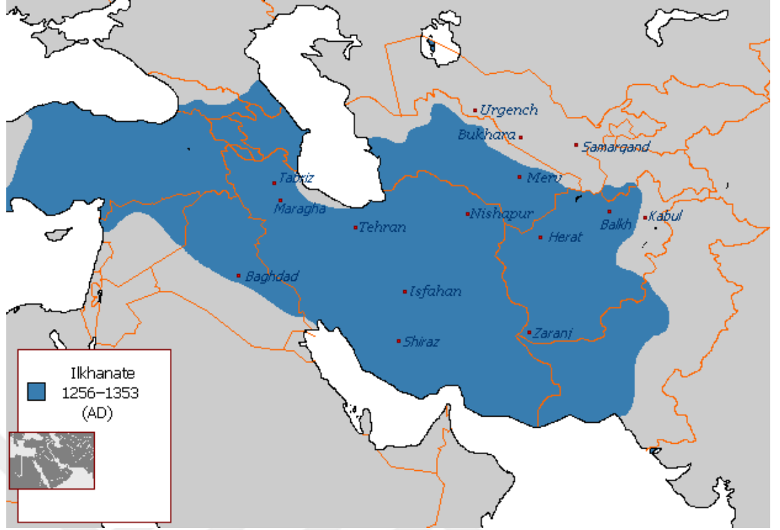
İlhanlı Devleti Haritası