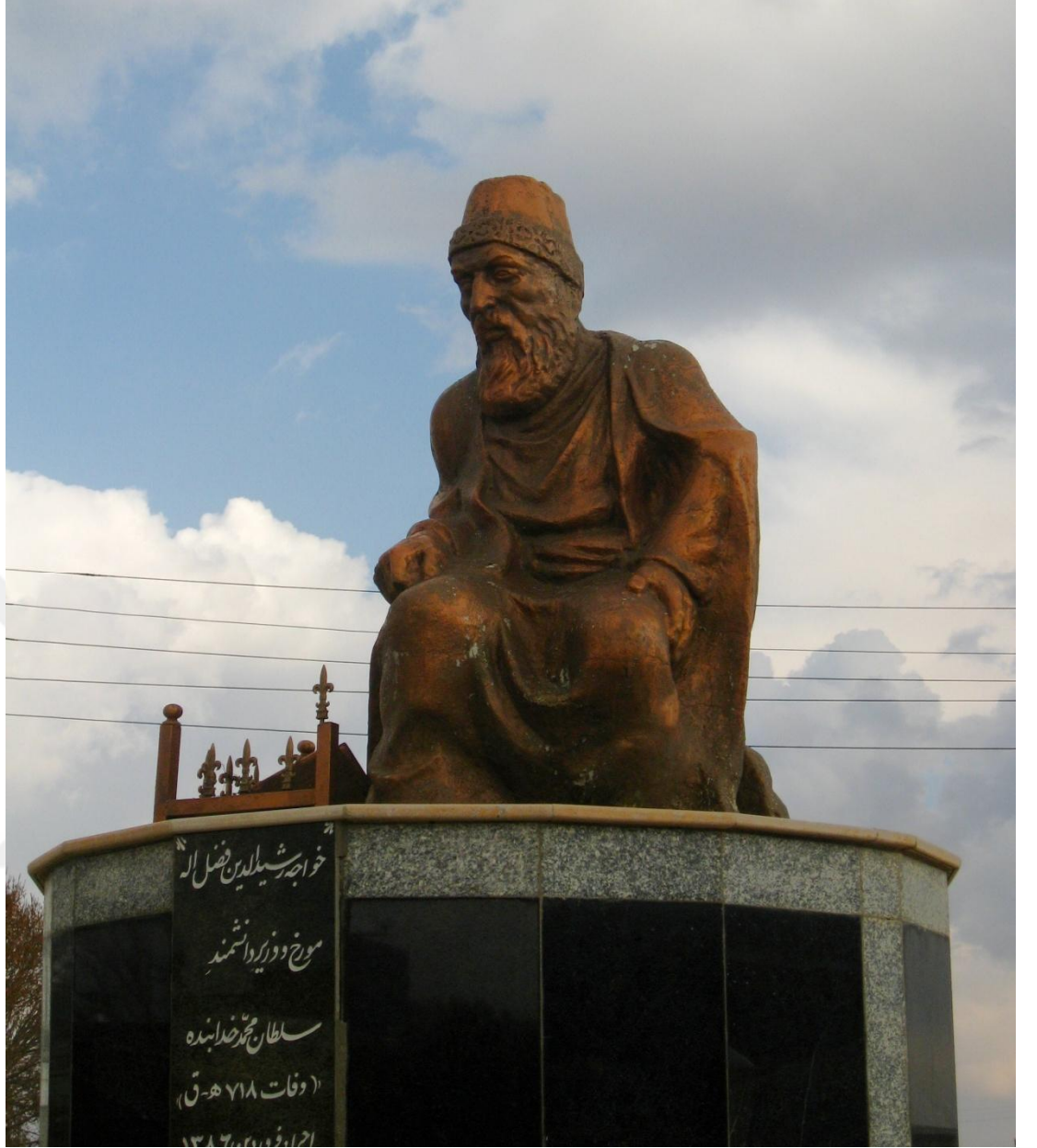
Sultaniye’de yapılan Reşidüddîn Fazlullah Hemedanî heykeli