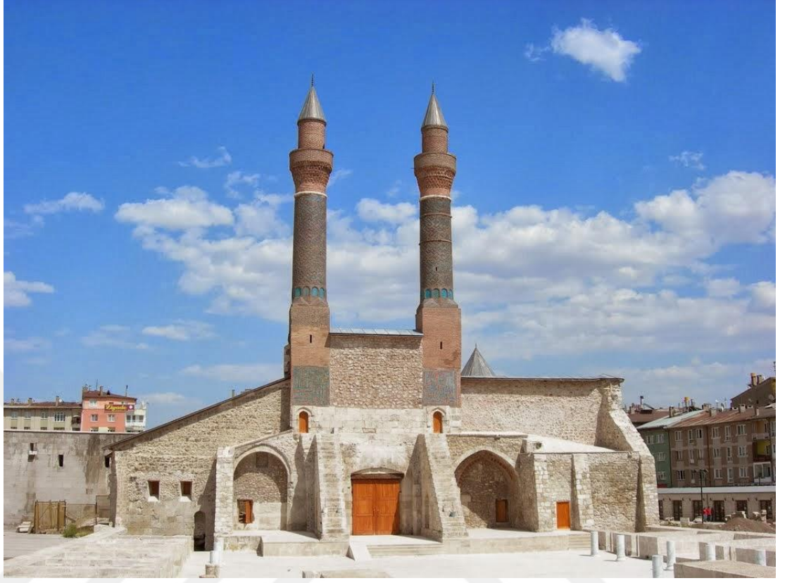
Sivas'ta bulunan Çifte Minareli Medrese