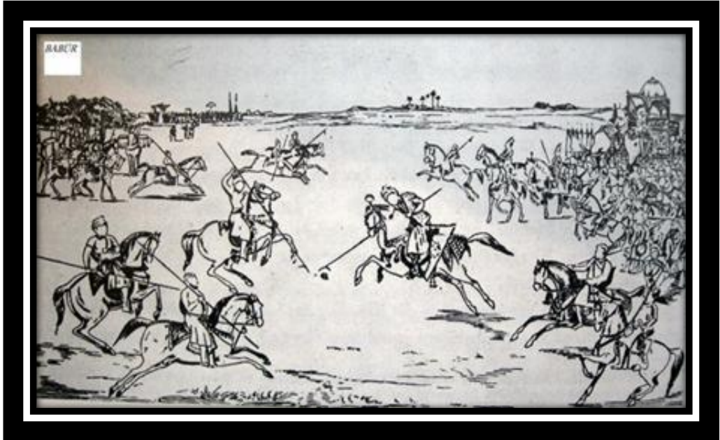
Ek: Resim 4. Türkler ve Çögen – 1