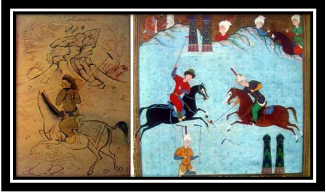
Ek: Resim 3. Türkler ve Çögen