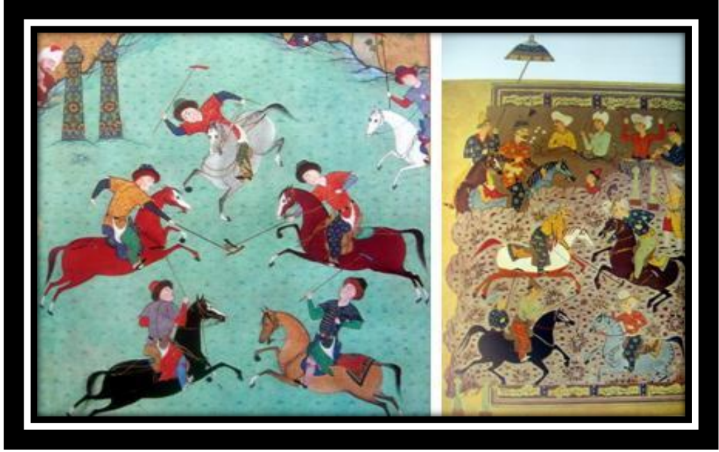
Ek: Resim 5. Trkler ve gen – 2