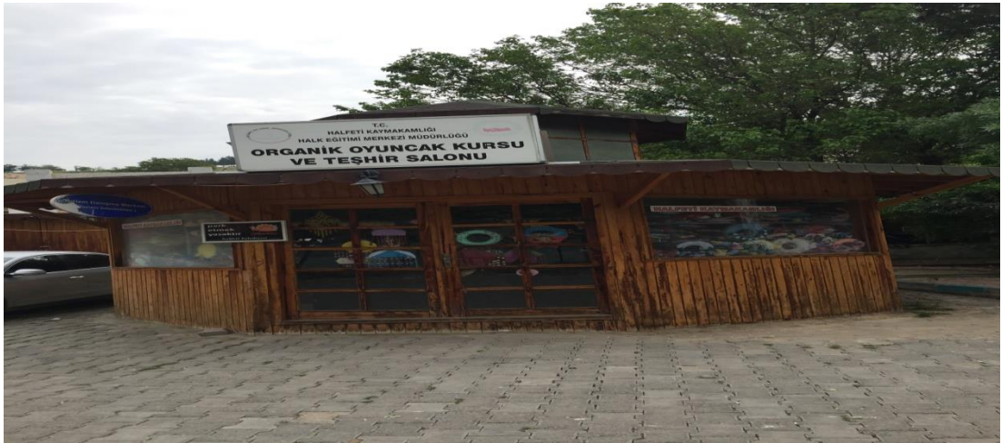
Resim.8: Organik Oyuncak Kursu ve Teşhir Salonu