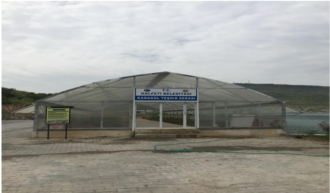
Resim.6: Halfeti Karagül Teşhir Serası