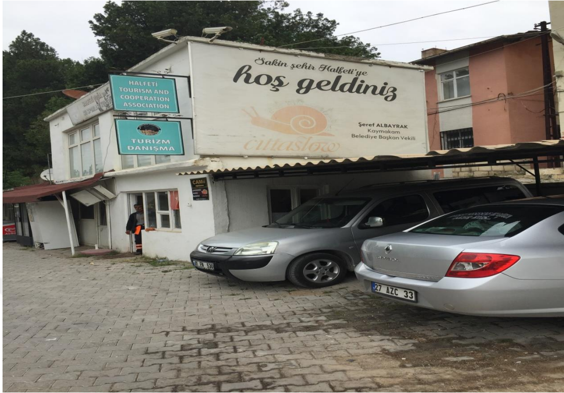
Resim.5: Halfeti Danışmanlık Bürosu