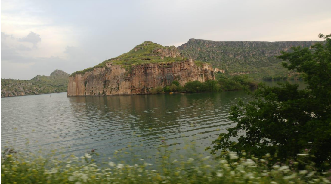
Resim.4: Halfeti Rum Kale