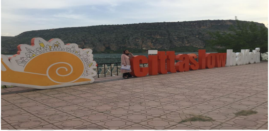
Resim.9: Halfeti Cittaslow Amblemi