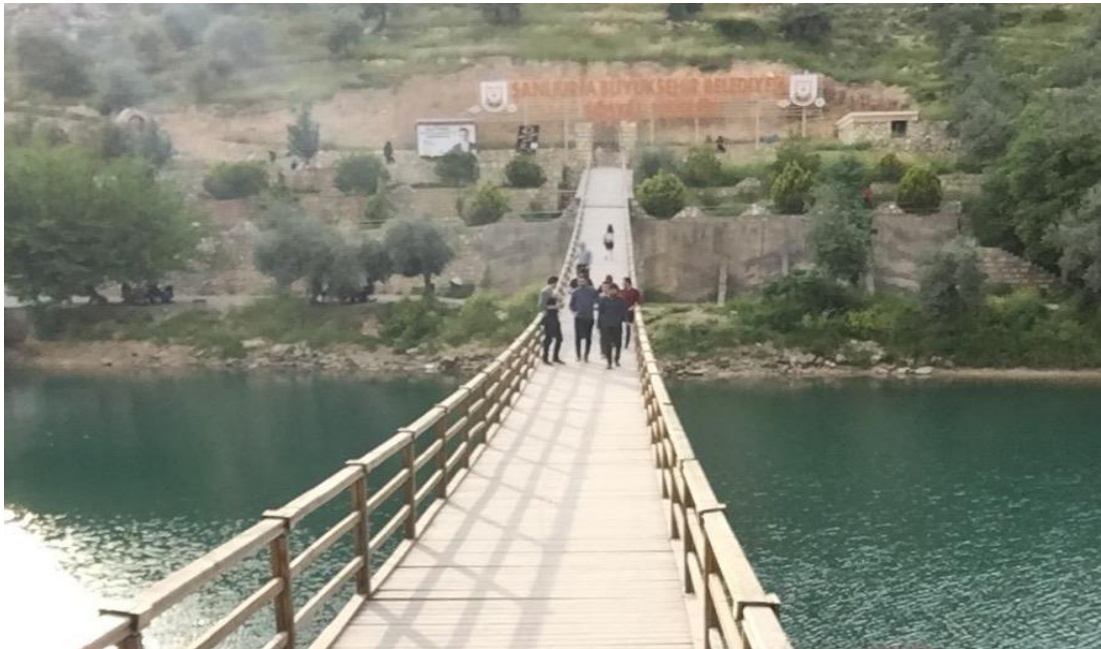
Resim.2: Halfeti Asma Köprü