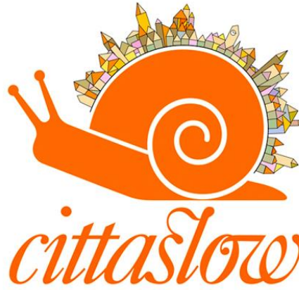
Grsel.3: Yavař Kent Hareketinin Resmi Logosu