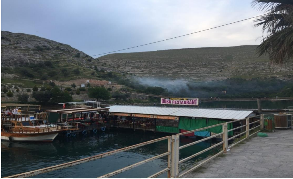
Resim.1 Halfeti Yüzer Duba Restaurant