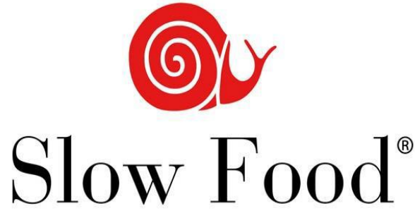
Görsel.2: Slow Food Logo