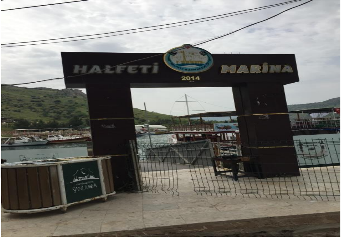
Resim.7: Halfeti Marina