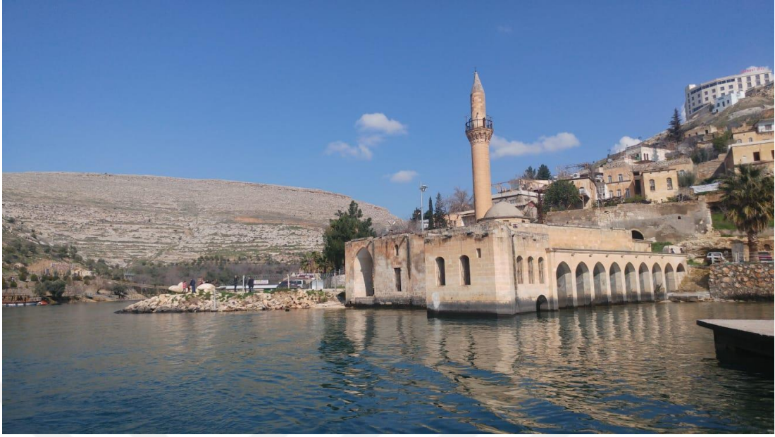
Resim.3: Halfeti Ulu Camii