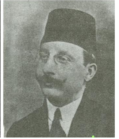
Kâzım Nami Duru 1875-1967