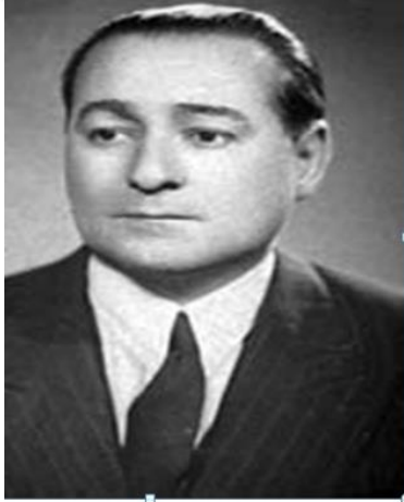
Adnan Menderes 1899-1961