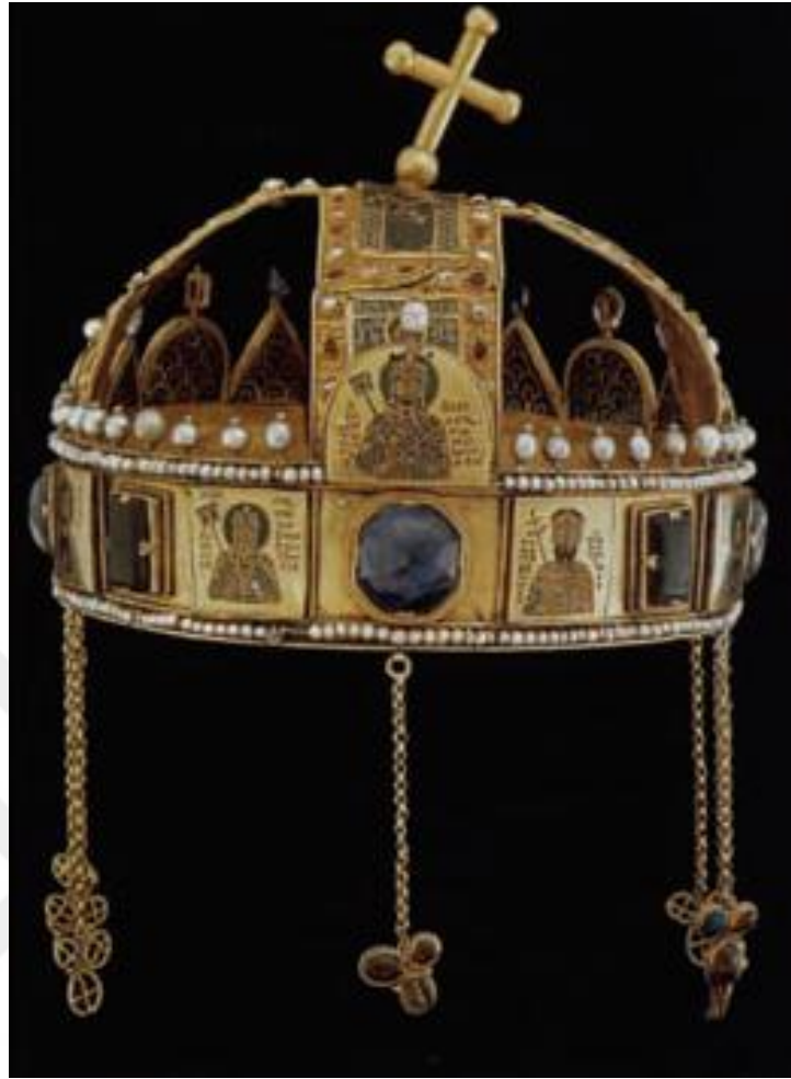
EK 5. Macar Kraliyet Tacı (1074-1077)