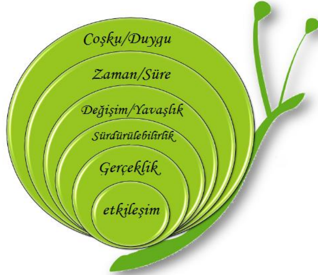
Şekil 2.2. Yavaş Turizmin Boyutları