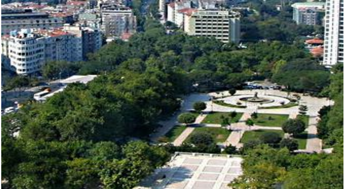
Resim 2: Taksim Gezi Parkı'nın Görünüşü