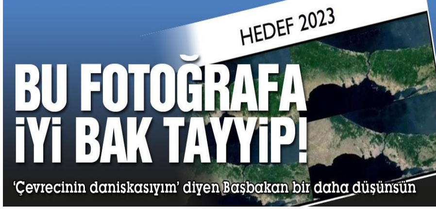
Resim 10: Sözcü Gazetesinin 9 Haziran Tarihli Haberi