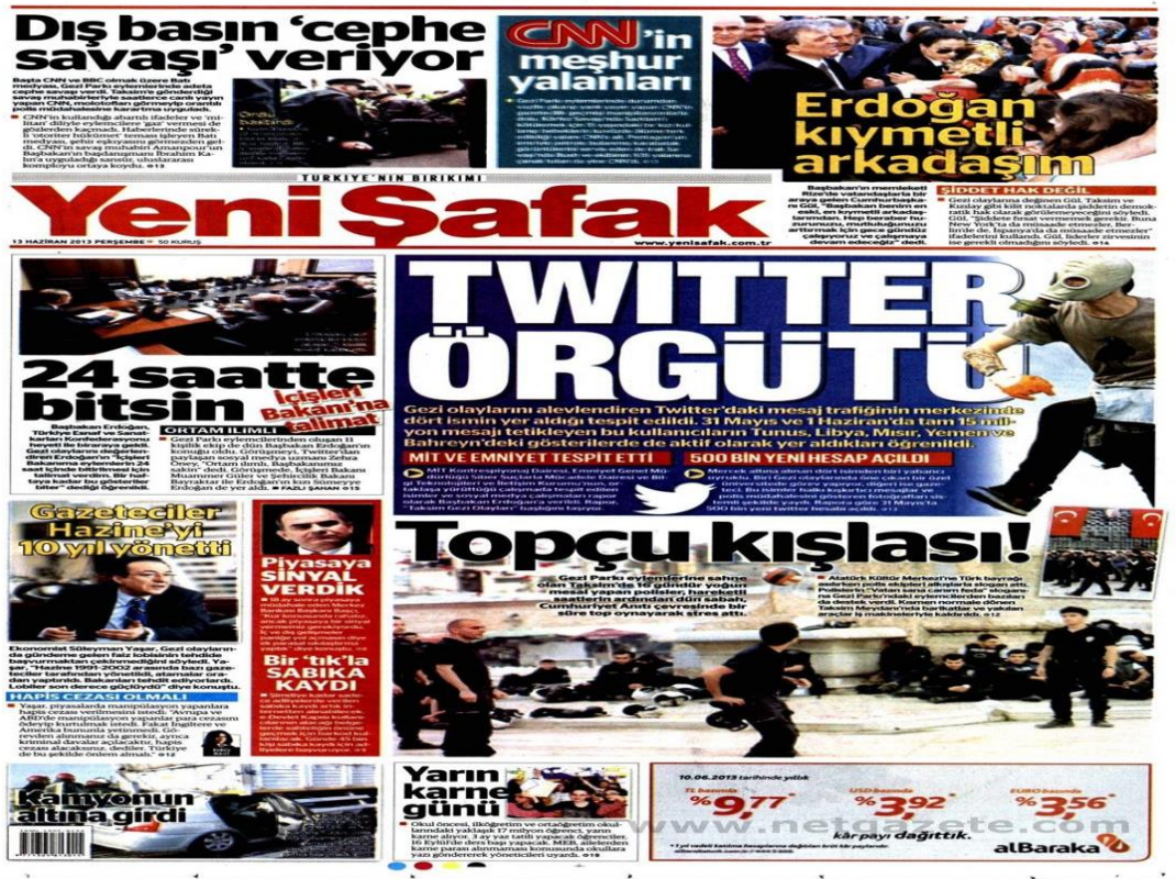
Resim 12: 13 Haziran 2013 Tarihli Yeni Şafak Gazetesi 1. Sayfası