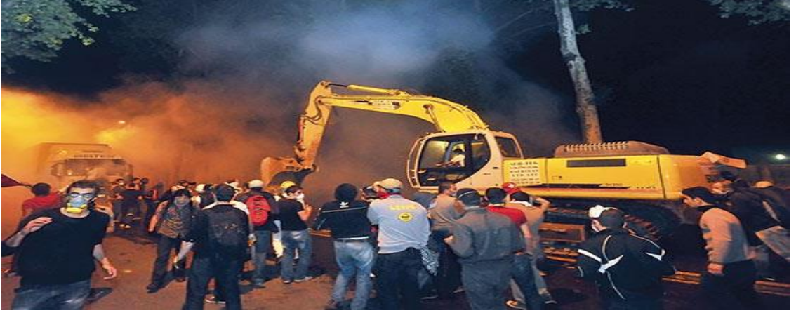
Resim 8: İş makinesiyle Başbakanlık Ofisi’ne saldırdılar