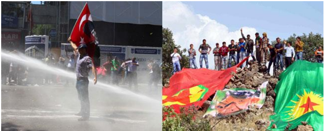
Resim 7: İki Fotoğraf İki Türkiye