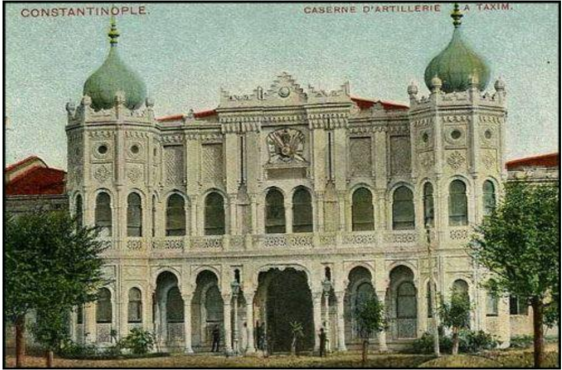
Resim 3:Taksim (Topçu) Kışlasının 1880-1893 Yılları Arasında Çekildiği Düşünülen Bir Fotoğrafi