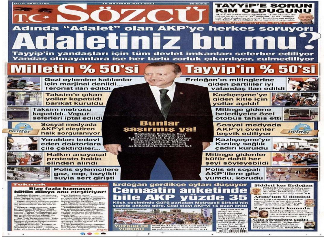
Resim 15: Sözcü Gazetesi 18 Haziran Tarihli Sayısının 1. Sayfası