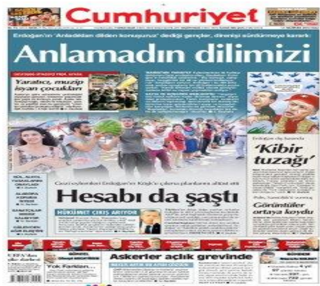
Resim 11: 11 Haziran Tarihli Cumhuriyet Gazetesinin 1. Sayfası