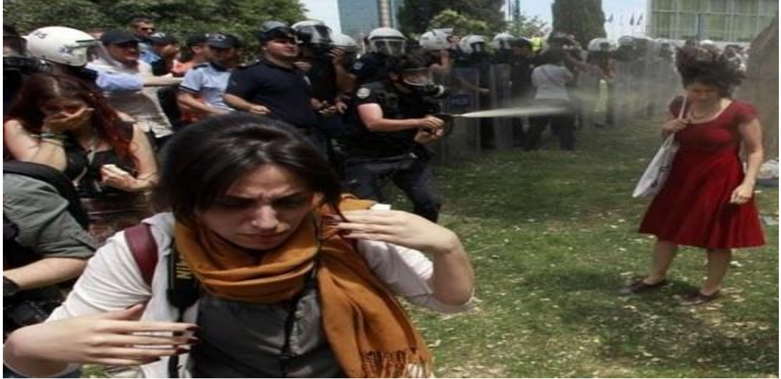
Resim 4:Gezi Parkı Yıkımına Engel Olmak İsteyenlere Yapılan Polis Müdahalesi