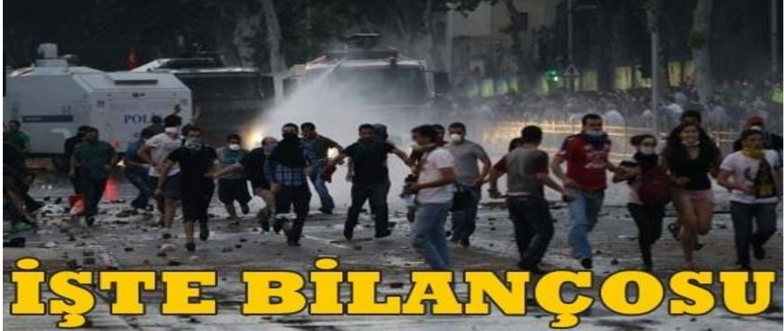
Resim 5:Eylemlere Güvenlik Güçlerinin Müdahalesi