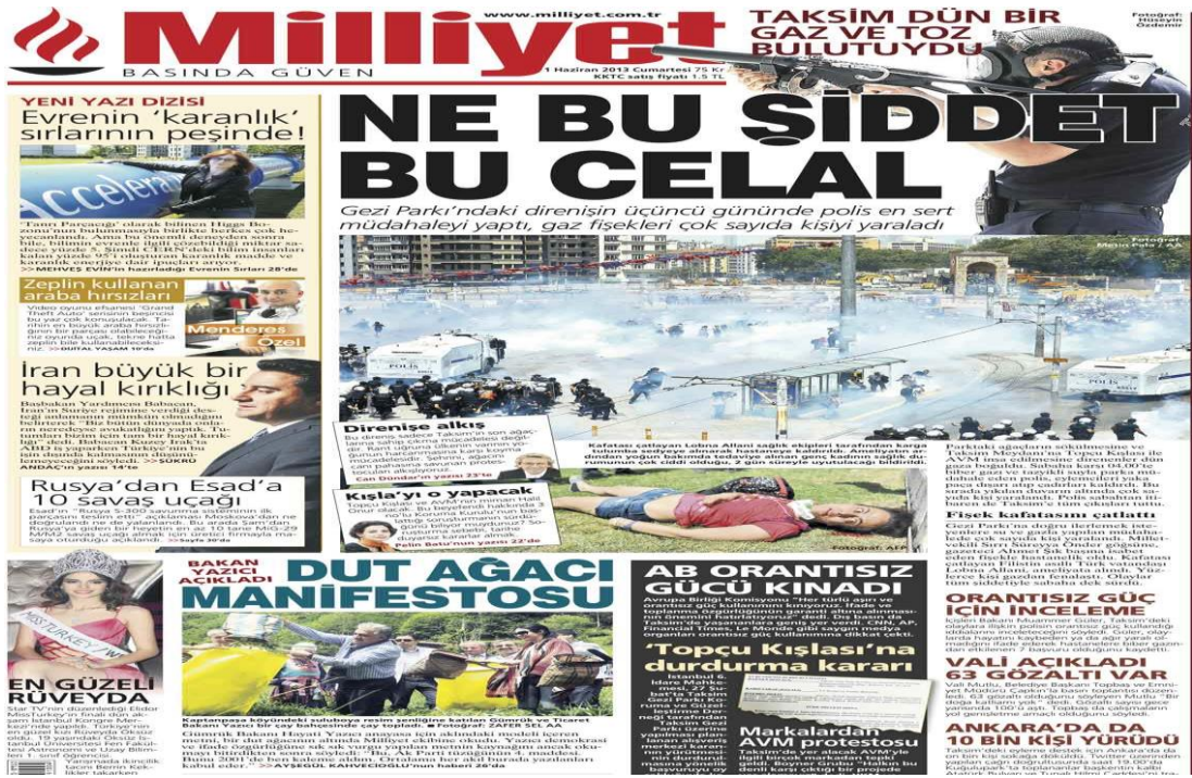
Resim 6: Milliyet Gazetesinin 1 Haziran 2013 Tarihli 1. Sayfası