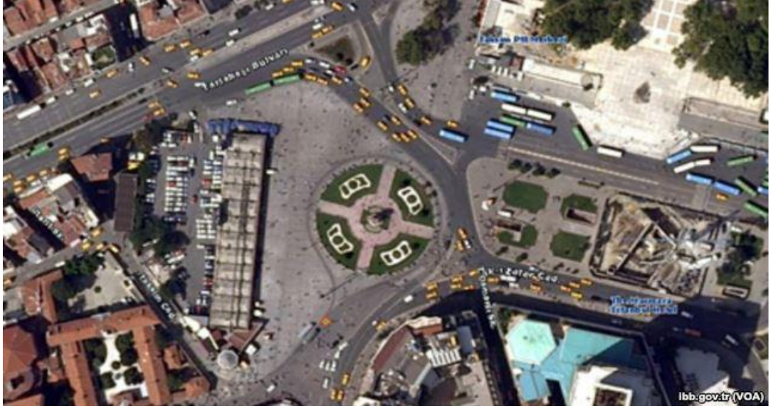
Resim 1: Gezi Parkı ve Çevresinin Havadan Görünüşü

Aşağıdaki resimlerde Gezi Parkı'nın bugünkü hali görülmektedir