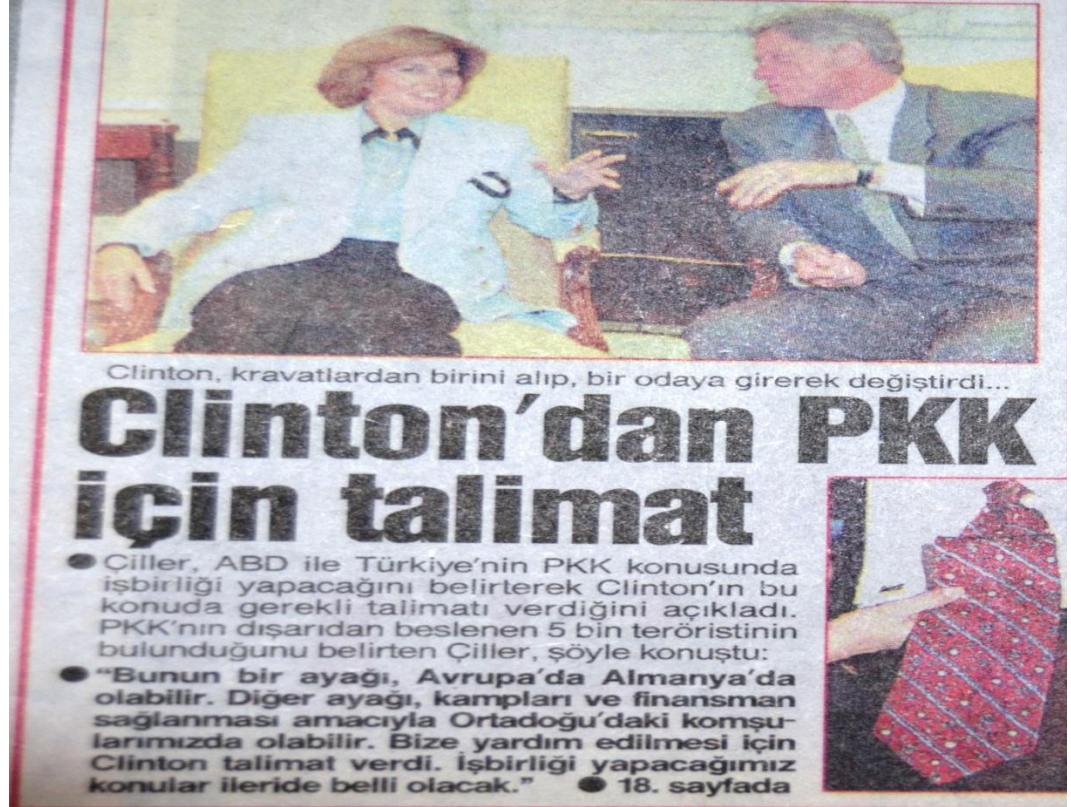
EK 6: Vermezlerse Vermesinler (Hürriyet, 11 Aralık 1995 s. 25)