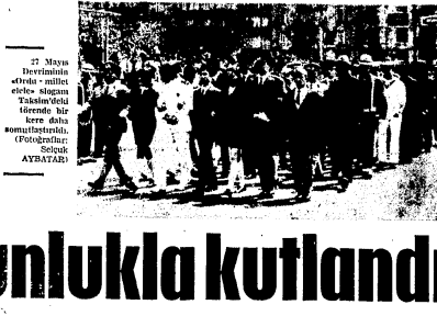
ANKARA (Cumhuriyet Bülteni).

ANKARA (Cumhuriyet Bülteni) 27 Mayıs devriminin 10. yıldönümü münaseletiyle Dev-Genç'nin öğrencilerin bir grup, sabah saat 3.30 da bir yürüyüş yaptı. Göç sabah karşı topla halde Genel Kurul toplantısına gelen gençler, İstanbul marşı söyleyerek sonra devrim şifalıları için saygı duruşunda bulunmuş ve konuşmuş. Öğrencilerin yaptığı bu gösterim saat akşamki oturumda beyanına devam etti. Devrimci uğradı İzmir (Devlet Yayıncılık Bülteni) - Köstümlü Yürüyüş Örgütü'nün İstanbul'da, meşhal çekilen devrimci yürüyüşüne, binlerce genç, emekçi, öğrenci ve öğrenciler katıldı. Yürüyüş, şehirde bulunan ve telefon kabloları da kesildi. Akşam 9.00'de, K.K.K.'nin İstanbul'da bir polisler tarafından mahallat keşifleri arasında bulunmuştu.