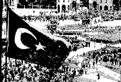
İzmir'de ve Anadoluda Bayram dolayısıyla düzenlenen büyük bayram gününde...