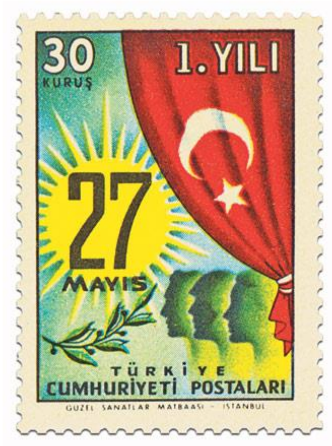
Resim 4: 27 Mayıs, Güneş ile Sembolize Ediliyor

27 Mayıs darbesi güneş ile sembolize edilerek güneşin yüzyıllardır insan üzerindeki olumlu etkisiyle darbeye meşruiyet kazandırılması amaçlanıyor.