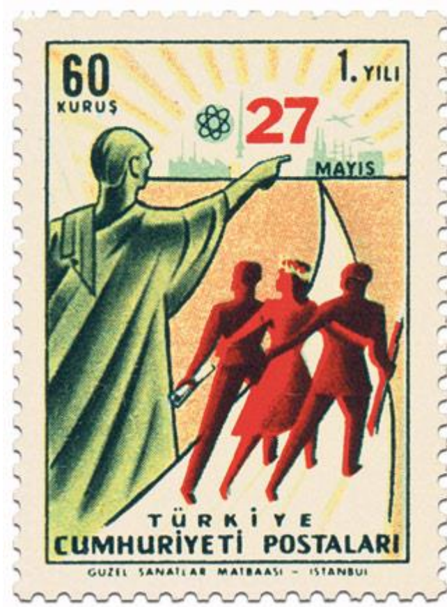
Resim 3: 27 Mayıs Darbesi ve Atatürk

27 Mayıs Darbesi ile Atatürk ilişkisi kurularak darbecilerin Atatürk'ün izinde olduğu anlatılıyor.