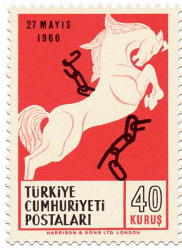
Resim 2: Zincirlerini Kıran At

Zincirlerini kıran at figürü ile darbecilerin milleti esaret kurtardığı anlatılıyor.