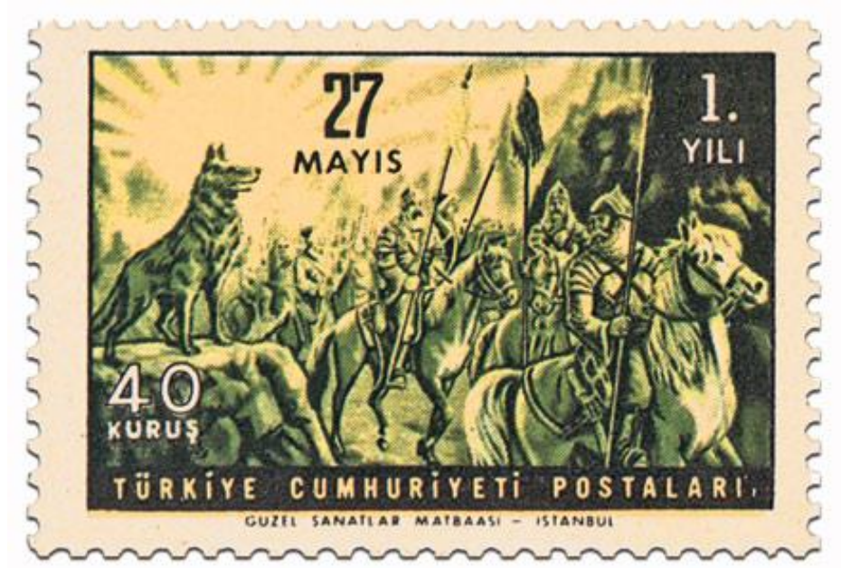
Resim 1: 27 Mayıs ile Türklerin Ergenekon'dan Çıkması

Bu pula göre darbeciler, 27 Mayıs ile Türklerin Ergenekon'dan çıkması gibi millet, baskı rejiminden kurtarılıyor.