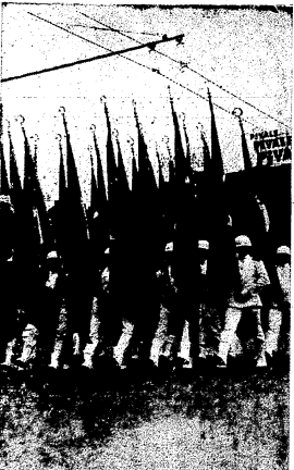
Deniz Harb Okulu öğrencileri geçti resiminde

Denişim üyelerine göre yargıçlarla ilgili madde Anayasaya aykırı ANKARA (Cumhuriyet Bülteni) Personel reformu kamu işçilerinin haklarını korumak için yapılan değişiklikler, denişim üyelerine göre Anayasa'ya aykırıdır. Denişim üyeleri, Türkiye'nin Anayasası'nın 102. maddesindeki hükümlerle, yargıçların görev ve yetkilerinin değiştirilmesini yasakladığını belirttiklerini ifade ettiler.