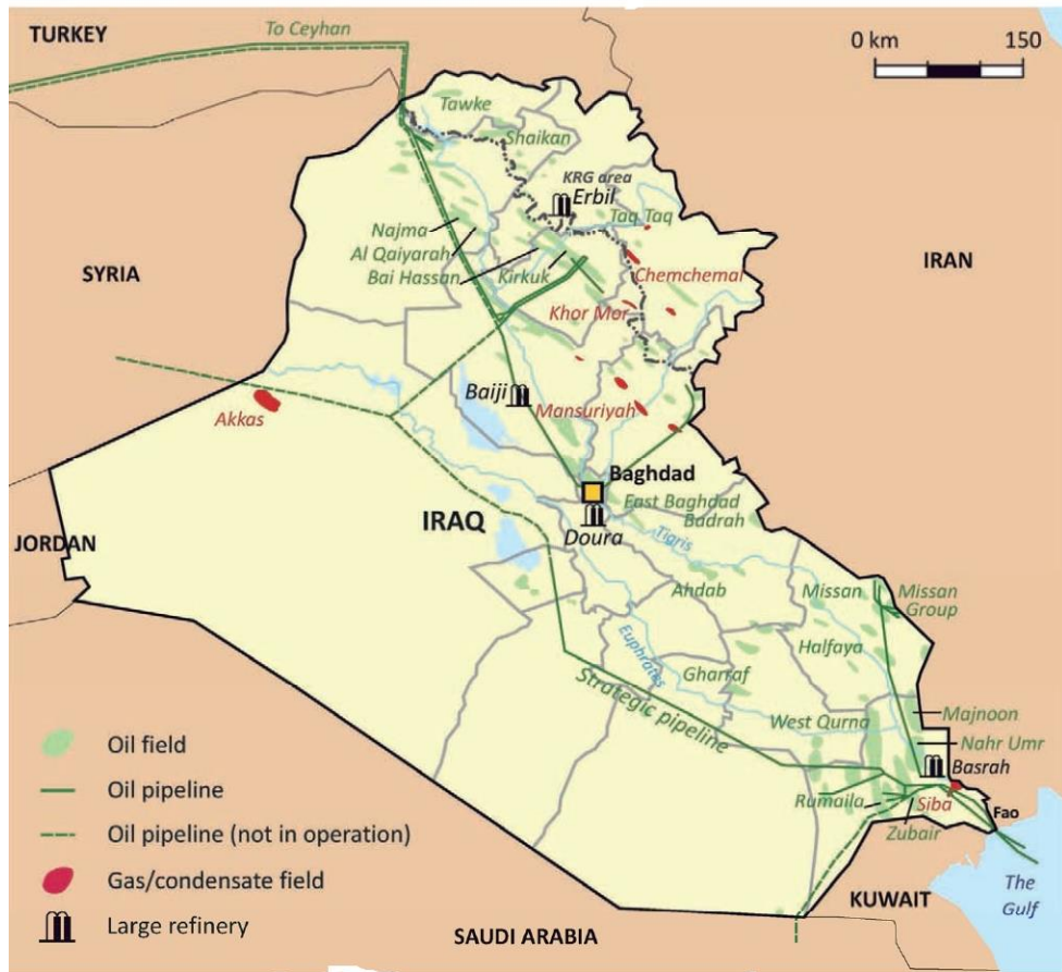
Şekil 6: Irak Petrol Yatakları ve Petrol Rafinerilerinin Dağılışı

havzanın başlıca yatakları Altinköprü, Bayhasan, Cemçemal, Çembur ve Palhane, gibi işletme bölgeleridir 86 .