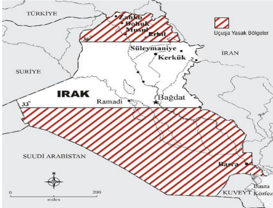
Şekil 7: Uçuşa Yasak Bölgeler