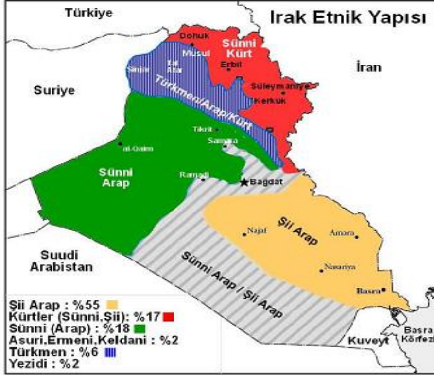
Şekil 2: Irak Etnik Yapısı