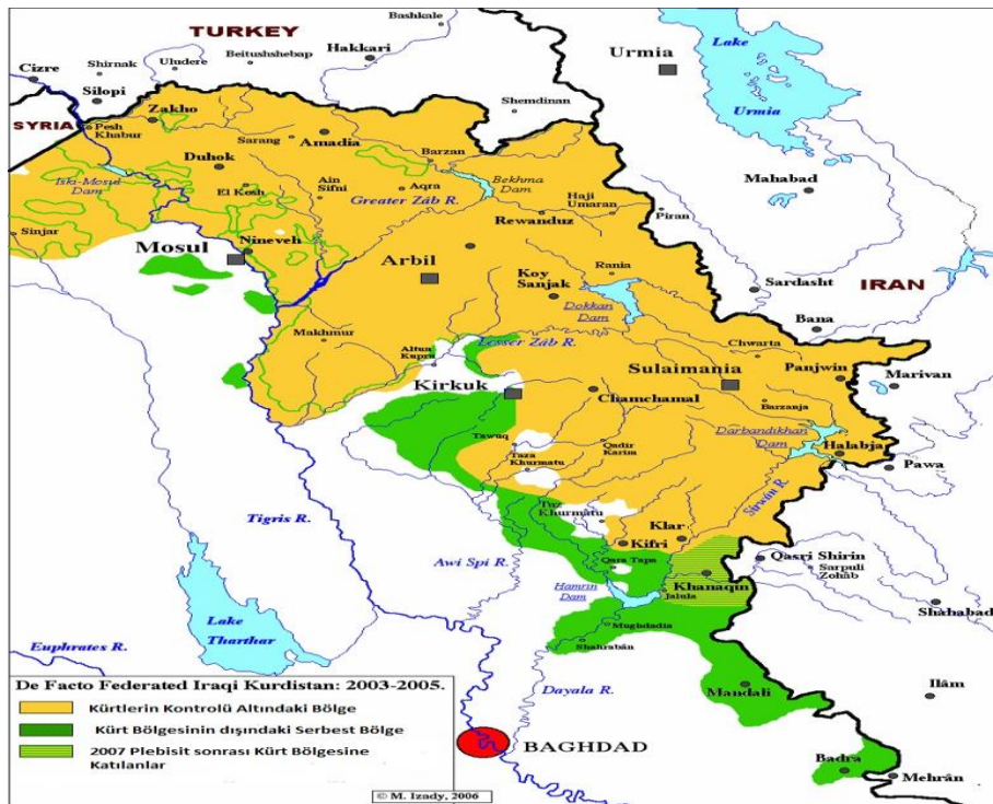
Şekil 1: Kuzey Irak Haritası

kuzey-doğu doğrultusunda uzanan dağlık kesimi ile Dicle ve Fırat Nehri havzalarının yukarı kısmını oluşturan bölgeyi içine almaktadır 8 . Irak'ın kuzeyi genel olarak Erbil, Dohuk ve Süley-maniye'yi kapsar ve 75.000 km 2 yüzölçümü olan ve Irak'ın yaklaşık 1/7'sini kapsayan bir bölgedir. Kuzey Irak diye anılmaya başlayan bölge, bir Ortadoğu ülkesi olan Irak'ın kuzeyinde ve kuzeydoğusunda yer alan topraklardır 9 . Dağlık olan bölge, kuzeyde Irak-Türkiye sınırından devam ederek Anadolu ile doğudan Irak-İran sınırı ile devam ederek te İran dağları ile bütünlük gösterir. Bu kısımda Irak'ın en yüksek noktası 3650 metrelik Revandüz dağı yer alır, güney ve batıya doğru inildikçe dağların yükseklikleri azalmaya başlar.