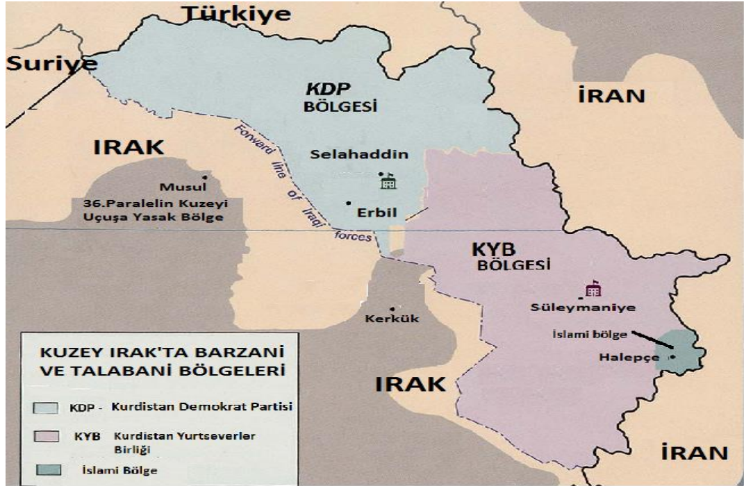
Şekil 3: Irak'ın Kuzeyinde Barzani ve Talabani Bölgeleri

KYB tarafından kontrol edilen Soran bölgesi ise Kuzey Irak'ın ekonomik ve kültürel olarak gelişmiş bölgesidir. Burada kentleşmiş bir Kürt toplumu vardır. Bölgenin en önemli şehri Süleymaniye'dir. Bölgede Kadiri tarikatı daha güçlüdür. Bölgede konuşulan Kürtçe; İran'daki Kürtlerin diyalektiğine daha yakındır 17 .