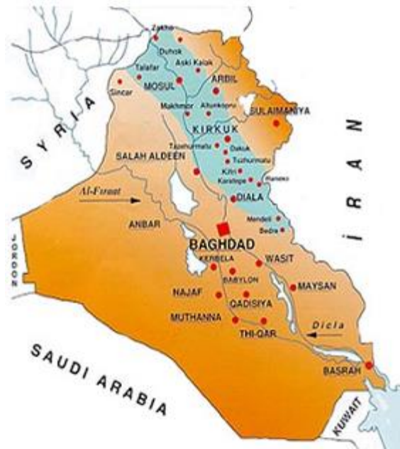
Şekil 4: Irak Türkmenlerinin Yaşadıkları Bölgeler

Türkmen nüfusu, Musul ve Erbil şehirlerinde yoğun yaşamaktadırlar. Çiftçi ve kölü ol-dukça azdır. Nüfusun büyük bir kısmı tahsillidir. Abdüsselam Arif zamanında az sayıda Türk-men Irak Ordusuna alındığından önemli kademelere geldiler. Ancak 1974'ten sonra ordudaki ağırlıkları azalmıştır. Türkiye'ye yerleşerek önemli devlet kademelerine gelen Irak'lı Türkmen vardır. Başta Prof. Dr. İhsan Doğramacı olmak üzere İstanbul eski Belediye Başkanlarından Lütfi Kırdar sayılabilir 54 .