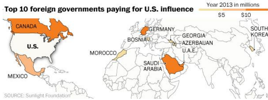
Şekil 8: ABD’de Lobiciliğe harcama yapan ilk 10 Ülke