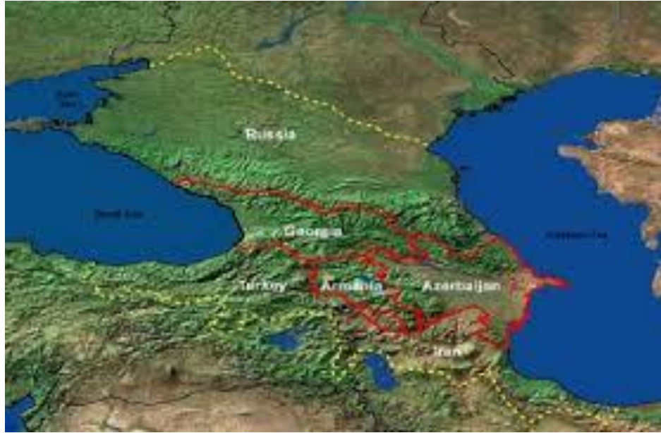
Şekil 4: Güney Kafkasya