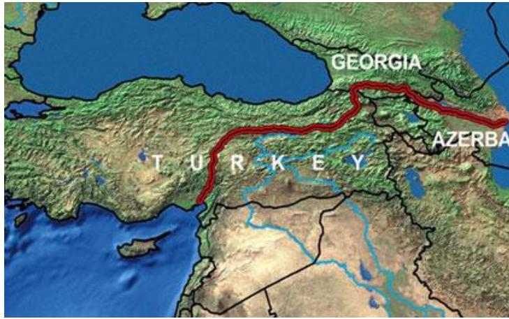
Şekil 7: Bakı-Tbilisi-Ceyhan

Genel olarak ABD'nin Azerbaycan'a yönelik politikası bazı temellere dayanmaktadır. Bunlar "Bakü-Tiflis- Ceyhan" petrol boru hattının tercih edilmesi, Dağlık Karabağ sorununda AGİT vasıtasıyla aktif rol oynayarak barışçıl çözümler sağlanması, komşular ile barış içinde yaşanması ve bölgede istikrarın sağlanması, Rusya Federasyonu etkisinin azaltılarak Azerbaycan'ın bölgesel devletlerle işbirliğinin geliştirilmesi, sınır güvenliğinin temin edilmesi, demokrasi alanındaki reformların yaygınlaştırılması ve serbest piyasa ekonomisine sahip demokratik bir devlete çevrilmesinde yardımcı olunmasıdır. 159 Sonuç olarak ABD'nin Kafkasya özellikle Azerbaycan'a yönelik politikasında realist teorisinin bütün ilkeleri görülmekte ve Azerbaycan'ı kendi çıkarları açısından ilgi alanından uzak tutmamaya çalışmaktadır.