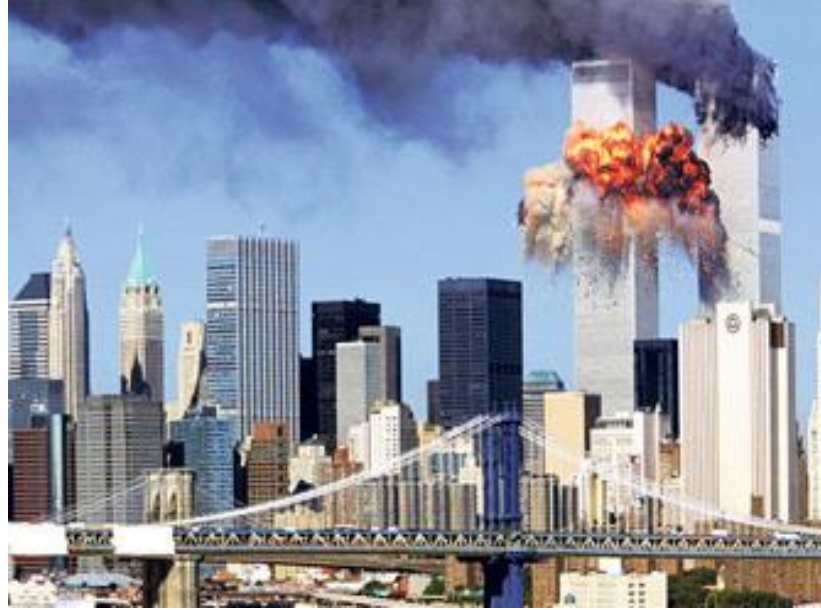
Şekil 2: New York'ta 11 Eylül saldırıları