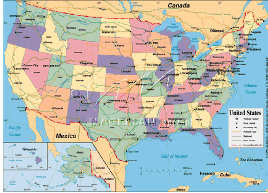
Şekil 1: ABD Haritasi