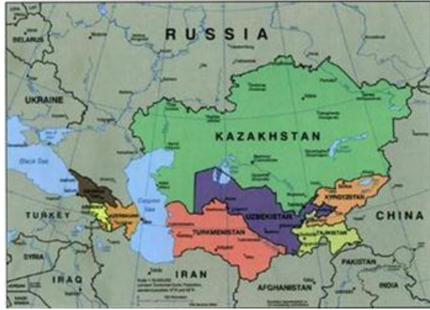
Şekil 5: Orta Asya ve Kafkasya

ilintili dört noktada önem arz etmektedir: RF' yanın bölgesel politikası, İran'ın bölgesel politikası, enerji kaynakları ve askeri üsler. 123