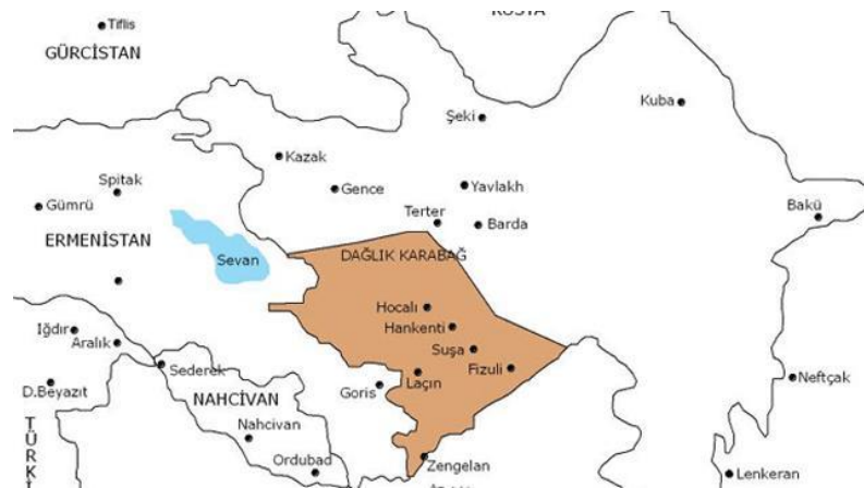
Şekil 6: Dağlık Karabağ

Dağlık Karabağ sorununun çözümü doğrultusunda olduğu vurgulanmıştır. Bu yüzden Dağlık Karabağ sorununun özellikle diplomatik yollarla çözümüne öncelik vermiş, taraflar arasında denge kurmaya çalışmış 157 ve bölgede her hansı bir savaşa karşı olduğunu beyan etmiştir, çünkü daha istikrarlı ve müreffeh Azerbaycan daha istikrarlı ve müreffeh Kafkasya demek olduğu düşüncesindeydir. Dağlık Karabağ sorununun çözümünde Azerbaycan yanlısı bir politika izlemesine bakmayarak Ermeni lobisinin etkisindeki Kongre’de kabul edilen “Özgürlükleri Destekleme Yasasına 907 Sayılı Ek ” madde nedeniyle Azerbaycan’a uzun süre yardım yapamamıştır. Bu bağımsızlığını yeni kazanmış Azerbaycan için ağır bir zarba olarak değerlendirilmekteydi. Azerbaycan’a doğrudan yardım yapamayan ABD yönetimi, Azerbaycan’a sivil toplum örgütleri aracılığıyla yardım etmiştir. Bu madenin durdurulması için karşılıklı ziyaretler esnasında gayret serf edilmesine bakmayarak George W. Bush dönemine kadar durdurulmamış, yalnız 11 Eylül 2001 tarihindeki terörist saldırılar sonrasında Azerbaycan’ın ABD’ye tam destek vermesi ve ABD’nin de Azerbaycan’la işbirliği yapacağını açıklamasıyla Bush yönetiminin Kongreye müracaatı sonrasında, “907 Sayılı Ek” maddenin kaldırılması gerçekleşmiştir. 158