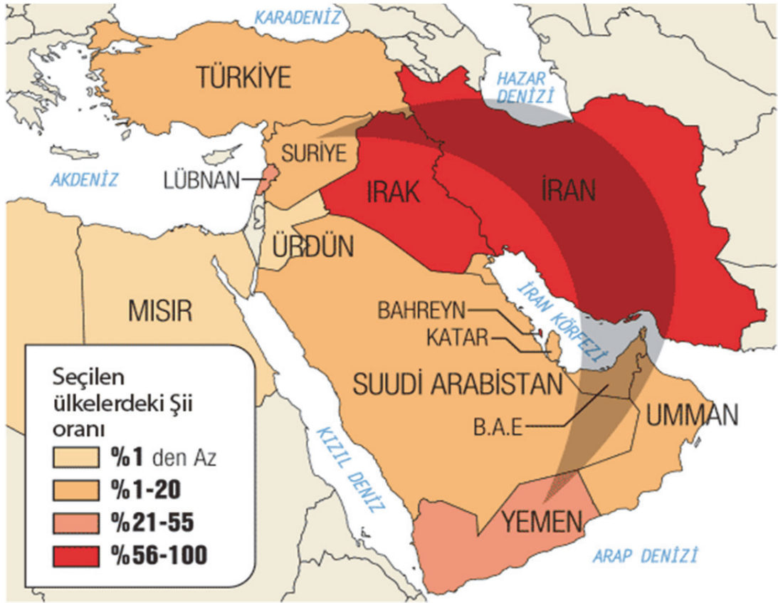
Harita-1 Şii Hilali 133

İran, oluşturmaya çalıştığı Şii Hilali ile Orta Doğu'dan Körfez'e kadar olan bu bölgede siyasal bir egemenlik kurma amacı gütmektedir. 134 Ayrıca, Şii jeopolitiğin, İran için bu kadar önem arz etmesinin en önemli sebeplerinden biri de dünya enerji kaynaklarının üçte birinin yer aldığı Basra Körfezi'nde 14 milyon Şii'nin bulunmasıdır. Bu durumu kendi ulusal çıkarları için büyük bir avantaj olarak gören İran, Şii mezhebini ve İslam dinini açık bir şekilde araçsallaştırma eğilimindedir. Türkiye'de Şii jeopolitiğini çalışan önemli isimlerden biri olan Şadi Aydın'a göre 135 , Şii Hilali, inanç ve maneviyat temelli işlememektedir. Coğrafyada mezhebi kullanarak diplomasi yürüten tek ülkenin İran olduğunu belirten Aydın, rejimin Şii