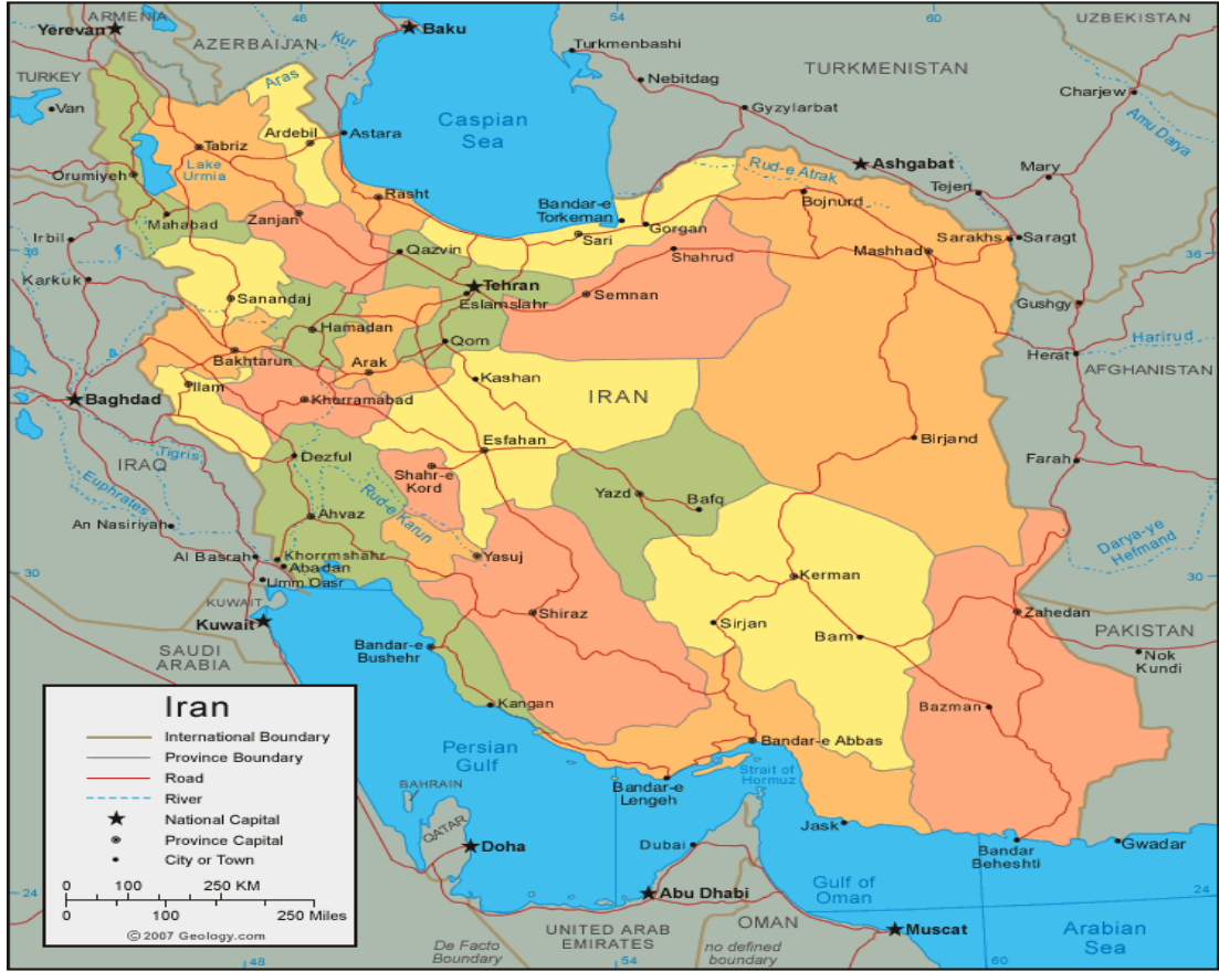
Şekil 1: İran Siyasi Haritası