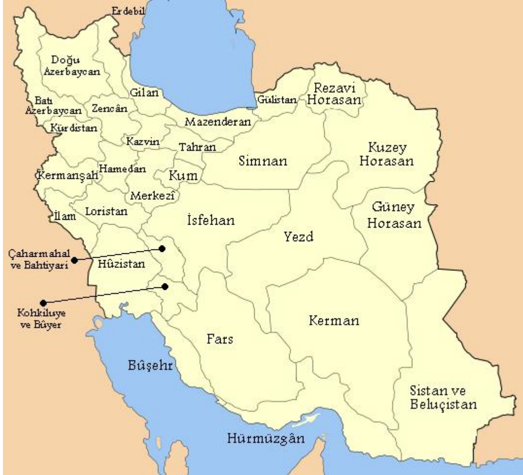
Şekil 5: İran Eyaletler Haritası

Beluciler ve Kürtlerin yaşadıkları bölgelerdir (Samii, 2000: 3). Nüfusun dağılımından da anlaşılacağı üzere İran eyalet sistemi şeklinde bir yapılanmaya sahiptir ve her etnik grup ülkenin çeşitli eyaletlerinde yoğunlaşmıştır. Aşağıdaki harita da ülkenin eyalet şeklindeki yapılanmasını daha net olarak göstermektedir.