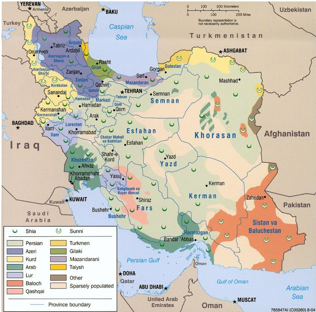
Şekil 3: İran Etnik Haritası