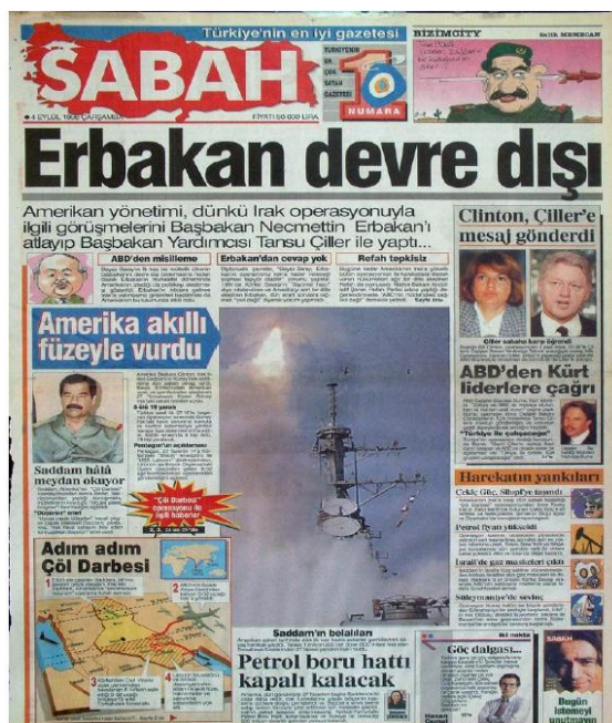
Sabah Gazetesi: Erbakan Devre Dışı (04 Eylül 1996).

ABD'nin Irak operasyonu ile ilgili olarak Başbakan Erbakan yerine Çiller ile görüştüğünü iddia eden Sabah Gazetesi, bu haberi ile Erbakan'a istenmiyorsun mesajı veriyor. Ayrıca bu duruma, yani Başbakanın muhatap alınmamasına eleştirel yaklaşılıyor.