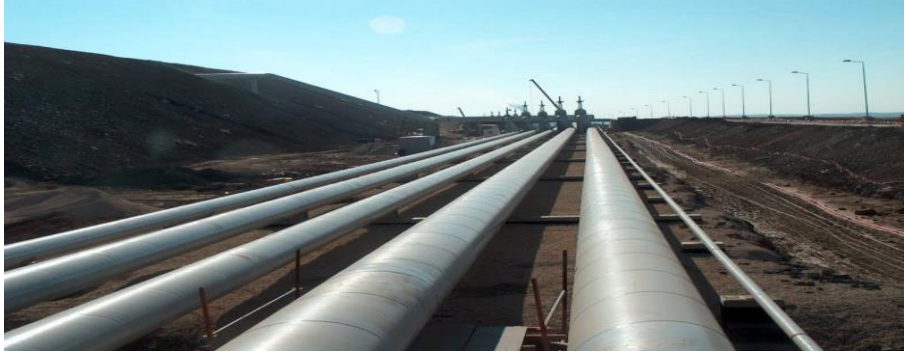
Şekil 6: Bakü-Tiflis-Ceyhan Petrol Boru Hattından Bir Kesit