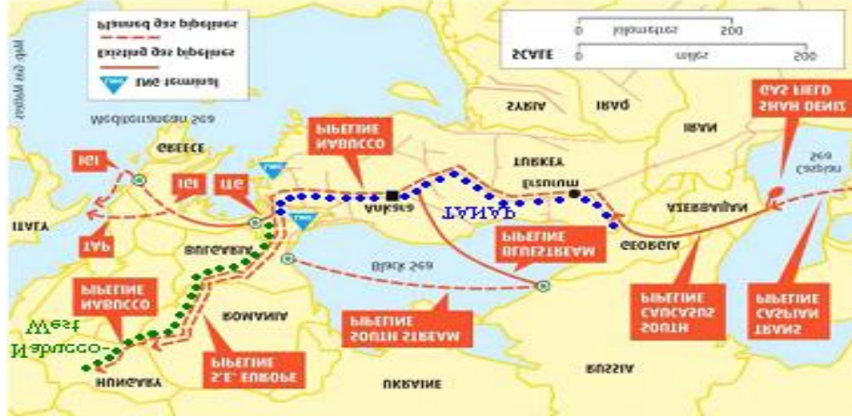
Şekil 7: NABUCCO Projesi Geçiş Güzergâhı

Kaynak: ( http://vestnikkavkaza.net/sites/default/files/southstream.jpeg , adresinden aktaran, Kısacık, 2013).