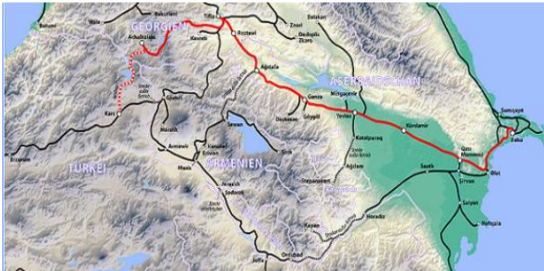
Şekil 10: Kars-Tiflis Bakü Demiryolu (21. Yüzyılın İpekyolu) Projesinin Güzergâhı