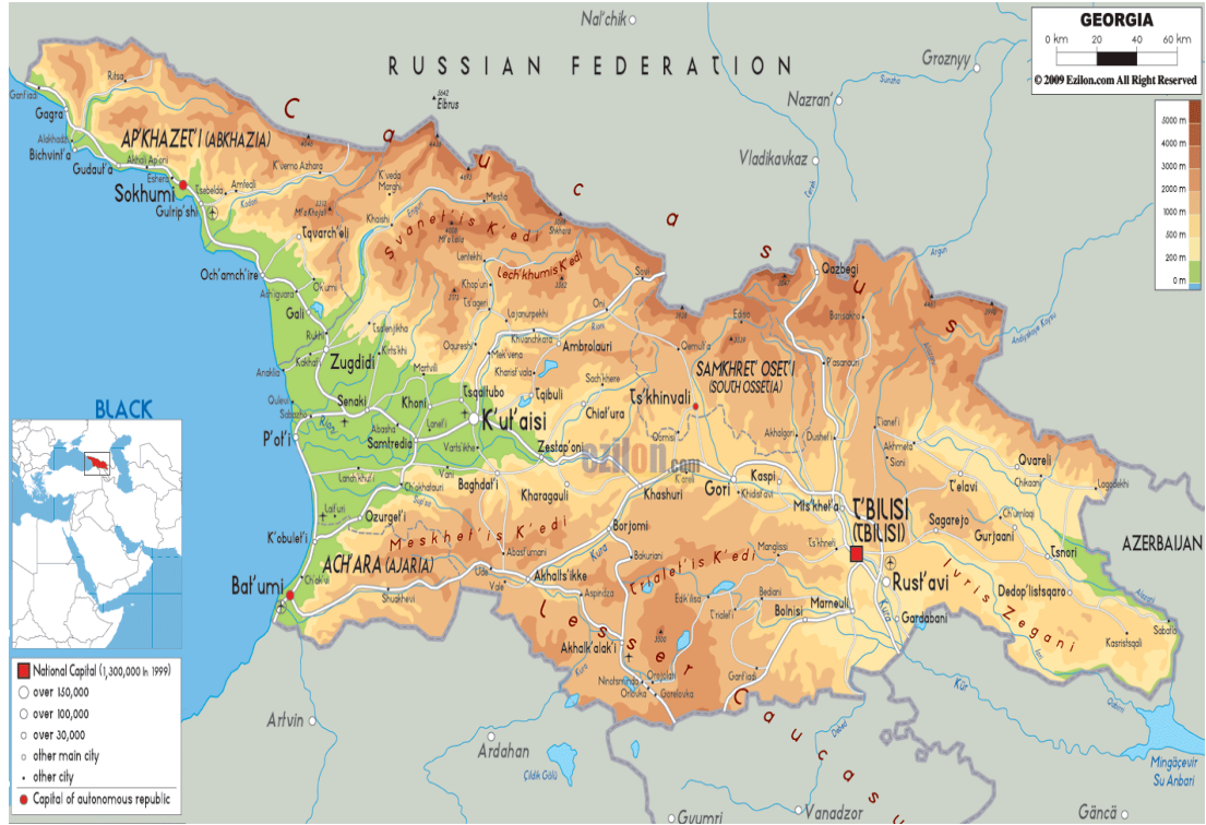
Şekil 4: Gürcistan Fiziki Haritası