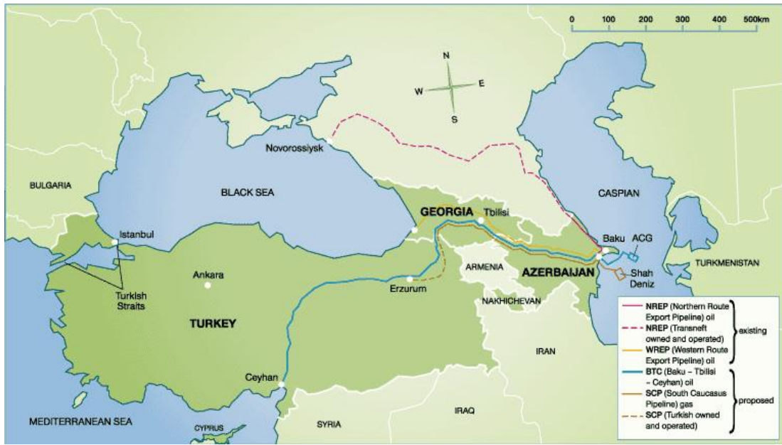
Şekil 5: Bakü-Tiflis-Ceyhan Petrol Boru Hattı