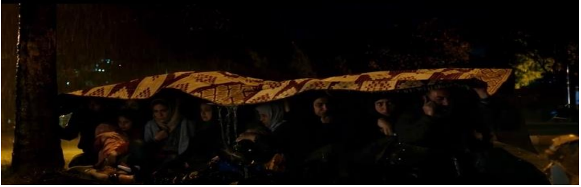
Görüntü.4.19. sokakta kalma sahneleri.

Kalacak yerleri olmadığı için Ahmet ve ailesi Bodrum'a gidip oradan kaçak yollar ile Yunanistan'a gitme planları yaparlar. Meryem de gitmek ister fakat bu sefer Ahmet kabul etmez. Meryem bir tekstil atölyesinde iş bulur ve çalışmaya başlar. Lina'yı ve kardeşini parkta bırakıp kendisi gelinceye kadar burada beklemelerini söyler. Meryem ile pek anlaşamayan Lina kardeşini alıp kaçmaya kalkışır. Buna sinirlenen Meryem onu azarlar. Fakat Lina ailesinin öldüğünden haberi olmadığı için sürekli Suriye'ye gitmek istediğini söyler. Meryem Lina ve kardeşini parkta bırakıp tekstile gider. Lina parkta kardeşi ile ilgilenirken daha önceden ailesi ile birlikte Suriye'den kaçmak zorunda kalan Said ile tanışır ( Görüntü.4.20. ).