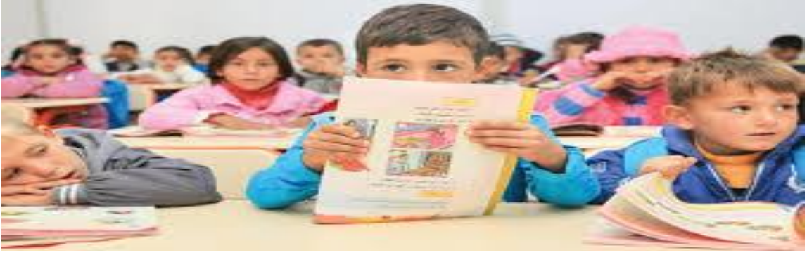
Görüntü.2.5. Türkiye’de kurulan kamplarda Suriyeli mültecilerin yaş ortalamasına göre eğitim imkânları sağlanmıştır