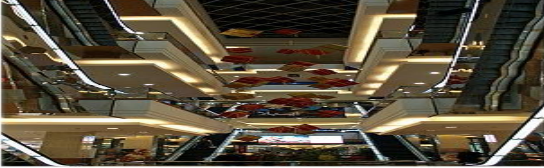
Görüntü. 2.1. Bombalanmadan önce Suriye de bir alışveriş merkezi

ayaklanma ve protestoları şiddetli bir şekilde devam ettirmişlerdir (Bayraktar, 2015, ss.54-55). Böylece ülke halen devam eden bir iç savaşa sürüklenmiş, şehirler bombalanmış ( Görüntü.2.1. ), on binlerce insan ölmüş, Suriye yaşanılmaz bir yer haline gelmiştir.