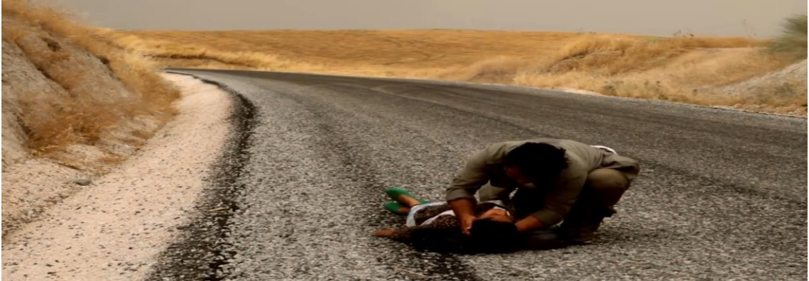
Görüntü.4.5. Zeynep'in öldü sanıldığı sahne

Bunu gören Murat tır durdurup şoförü yaptığından dolayı döver. İnip öfkeli bir şekilde sigara içtikten (filmin başlama sahnesi) sonra Zeynep'i sırtlayıp yolda yürümeye devam eder. O sırada Zeynep'in krizi tutar ikisi uzanmış bir şekilde yolun ortasında görünür( Görüntü.4.5. ).