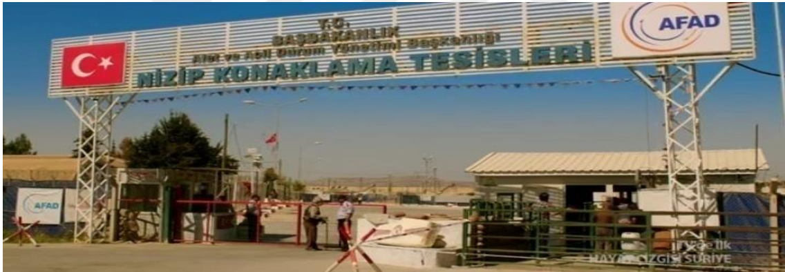
Grnt.4.15. kamp alanının olduđu sahne.

Elinde ailesinin fotođrafı olan adam akřam vakti ıssız bir sokakta yrrken grlr. Biraz dinlendikten sonra yoluna devam eder. Dođan otel odasında dřnceli bir řekilde dururken odaya Barıř girer ve yaptıkları iin zr diler. O sırada Dođan'ın annesi arayıp neden İstanbul'a gelmediđini sorar. Dođan sinirlenip telefonu kapatır. Dođan ryasında Ayře ile beyazlar iinde bir ormanda olduđunu grr. Ayře mayına basar. Dođan onu kurtarmak iin eđilir. Eđilirken beyazlar iinde olan Ayře kaybolur, yerine siyah giyinmiř, Dođan'ın niřanlısı olan Melis grlr. Dođan grdđ kbusun etkisi ile uyanır. Ertesi gn hastanede ameliyat ettiđi hastasını ziyaret eder. İiřlerinde grevli olan Ayla Hanım da ordadır. Ayla Hanım hastayı Ankara'ya gtrmek istediđini syler. Fakat Dođan daha erken olduđunu syler. Bu sırada yařlı adam elindeki fotođraf ile birlikte mlteci kampına gelmiřtir( Gtnt.4.15. ).