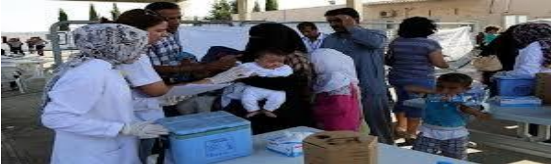
Görüntü. 2.6. Suriyeli mültecilere sağlık hizmeti verilmektedir

Yaklaşık olarak üç milyonu aşan Suriyeli mülteci yaşadığı bölgelerde sağlık hizmetlerinden ve diğer hizmetlerden (yeme içme, barınma, eğitim vb.) yararlanmışlardır. Sağlık Bakanlığı’na bağlı göçmen sağlık merkezleri kurulmuştur. Ülkemizde bulunan Suriyeli mültecilerin sağlık hizmetlerinden yararlanabilmesi için “geçici koruma kimlik belgesi” verilmiştir. Hastane müracaatında acil vakalar dışında Göç İdaresi İl Müdürlüklerince kayıtlarının yapılması için yönlendirilmişlerdir (Gültaş ve Balçık, 2018,s.196-197).