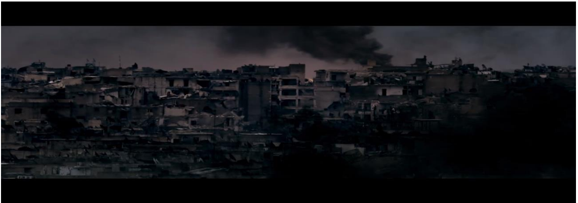
Görüntü.4.23. Yıkılmış binalar Suriye

Filmin Suriye’de geçen kısmında görülen yanmış yıkılmış binalar ( Görüntü.4.23. ). Suriye’de yaşanan yıkımın ve dramın büyüklüğünün; saldırı anında çocukların top, lego vb. oyuncaklarının havaya saçılması yok olan çocukluğun ve umutların; Lina’nın annesi ve babasının tatlı atışmaları aile bağlarının güçlü olduğunun; Meryem’in kaçarken para gömmesi geri dönebilme umutlarının sönmediğinin; yolculuk sırasında yol kenarında görünen dikenler, çıkılan yolun çok zorlu bir yol olduğunun; dikenli teller iki ülkeyi birbirinden ayıran sınırın; kurumuş ağaçlardan oluşan bir ormanda dalgalanan Suriye bayrağı ülkenin iç savaş sonucunda çoraklaşmasının ve harabeye dönmesinin göstergesidir.