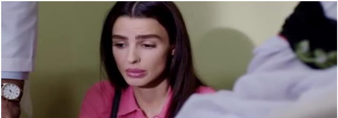
Görüntü.4.13. Kadının Suriye'de yaşadıklarını anlattığı sahne.

Sonraki sahnede başhekim olan Akif Bey odasında namaz kılarken Doğan ve asistanı Barış odaya girerler. Akif Bey namazını bitirdikten sonra operasyonun başarılı geçtiğini duyduğunu söyler ve onları tebrik eder. Doğan burada kalıp hastasını gözlemlemek istediğini söyler. Akif Bey bunu kabul eder. Necat içeri girip söylenenleri duyduktan sonra hastayı kendilerinin de gözlemleyebileceklerini söyler. Fakat Doğan bunu kabul etmez. Kendi hastası olduğu için kendisinin bunu yapmak istediğini söyler. Daha sonra Barış ile hastanenin bahçesinde konuşurken Gaziantep'e gidip bir şeyler alması gerektiğini; bir süre daha burada olacaklarını söyler. O sırada Ayşe ve diğer hemşireler servise binerler. Doğan da fikrini değiştirip oda Gaziantep'e gitmeye karar verir. Onlarda servise binerler. Serviste Barış Doğan'a bir şeyler anlatmaya başlar. Ama Doğan Ayşe'ye bakmaktadır. Doğan Ayşe ile konuşup merhabalaşmak için yanına oturur. Ayşe çekingen tavırlar sergiler. Bunu fark eden Doğan yanından kalkar. Merkeze geldiklerinde beyaz bir araba ile Ayşe'yi bekleyen bir adam görünür. Ayşe arabaya binip gider. Doğan ve Barış Gaziantep'i dolaşip alışveriş yapıp yemek yerler. Yemek yedikleri sırada yaşlı adam görünür. Elinde fotoğraf gelip gidene fotoğrafı göstermektedir. Ertesi gün hastanede Doğan kadın bir hastanın tercümanlığını yapması için Ayşe'den yardım ister. Kadın Suriye'de yaşadıkları kötü olayları anlatır( Görüntü.4.13. ). İkisi de anlatılan bu vahşetten etkilenip kendilerini kötü hissederler.