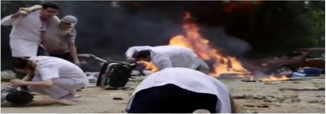
Görüntü.4.14. Hastanedeki patlama sahnesi.

Kendini kötü hissetmeye başlayan Doğan gelip merdivenlerde oturur. Arkasından Ayşe gelir. İyi olup olmadığını sorar. Duyduklarından sonra iyi olmadığını söyler. Ayşe savaşı durdurmaya güçlerinin yetmediğini, fakat en azından savaş mağdurlarına yardım edebileceklerini söyleyip gider. Doğan yerinden kalkıp koridorda yürürken ani bir patlamanın meydana gelmesi ile ortalık savaş alanına döner. Yere savrulan Doğan, Ayşe diye seslenip dışarı doğru koşmaya başlar. Dışarıda olan patlamanın etkisi ile içerisi gibi dışarı da savaş alanına dönmüştür ( Görüntü.4.14. ).