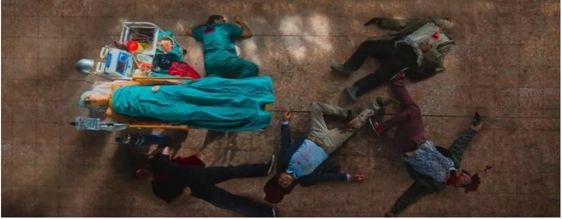
Görüntü.4.9. Yaşlı adamın öldüğü sahne.

Kısa süre sonra olay yerine polis ve sağlık ekipleri gelir. Böbreği alınan mülteci kadını ambulansa alırlar. Ambulansta parayı alan hemşire de vardır ve kadının kulağına eğilip “merak etme her şey yolunda paranda bende” der. Yaralı kadın lafi duyunca yüzünde tebessüm oluşur. Daha sonraki sahnede böbreği alan adamın oğlu ayağa kalkmıştır. Böbreği alınan kadın kızı ile birlikte mutlu bir şekilde parkta oynamaktadır. Yaşlı çiftler ölü de olsa mutlu bir şekilde güneşin batışını izlemektedir. Onlardan geriye kalan eski ve boş bir binadır.