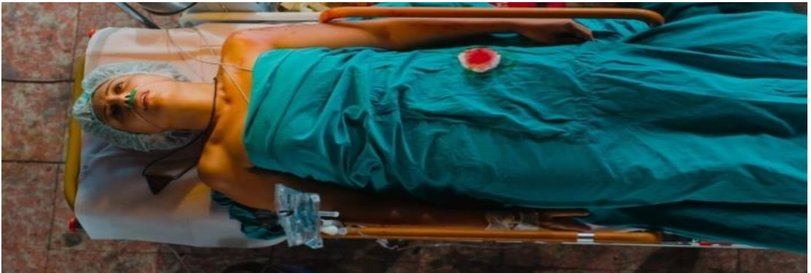
Görüntü.4.7. Kızın ameliyat masasındaki sahnesi.

Arabada oturan kadının yüzünde endişe vardır. Adam ise rahat tavırlar sergilemektedir. Biraz zaman geçtikten sonra kadını isteyen diğer adam gelir. Beğendiğini belli ederek “Kız bu mu” diye sorar. Binadaki yaşlı adam ve karısı da hala onları dikkatle izlemeye devam etmektedir. Ambulans gelir ve doktor mülteci kadın ile tanışır. Doktorun nereli olduğuna ilişkin sorusuna mülteci kadın “ne fark eder” diye cevap verir. Operasyonun yapılması için binada uygun bir yer bulmaya giderler ve operasyon için uygun ortam bulup ameliyat düzenini kurarlar. Bu sırada oğlu hasta olan yaşlı adam gelir ve mülteci kadına kendisi sayesinde oğlunun kurtulacağını söyleyerek teşekkür eder. Kız çaresiz bir şekilde “Tanrı bizimle” der. Kızı ameliyat masasına yatırıp böbreğini alırlar( Görüntü.4.7. )