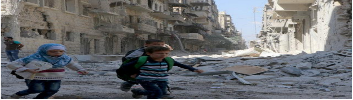
Görüntü .2.3. Savaşın en büyük mağduru olan çocuklar

Göç etmek zorunda kalan insanlar göç ettikleri yerlerde büyük bir adaptasyon süreci geçirmişlerdir ( Görüntü.2.4. ). Karşılaşılan yeni insanlar, yeni coğrafyalar ve yeni toplumlara uyma süreci zaman almıştır. Bunun dışında fiziki ve biyolojik ihtiyaçları olan beslenme, barınma gibi ihtiyaçlarını karşılamada büyük sıkıntılar çekmişlerdir. Daha savaşın etkisinden kurtulamayan bu insanlar, bu zorluklar sonucunda büyük bir korku ve telaş içine girmişlerdir.