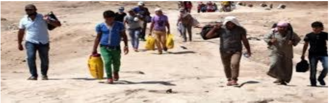
Görüntü.2.4. Savaştan kaçan Suriyeli mülteciler

Göç etmek zorunda kalan insanlar göç ettikleri yerlerde büyük bir adaptasyon süreci geçirmişlerdir ( Görüntü.2.4. ). Karşılaşılan yeni insanlar, yeni coğrafyalar ve yeni toplumlara uyma süreci zaman almıştır. Bunun dışında fiziki ve biyolojik ihtiyaçları olan beslenme, barınma gibi ihtiyaçlarını karşılamada büyük sıkıntılar çekmişlerdir. Daha savaşın etkisinden kurtulamayan bu insanlar, bu zorluklar sonucunda büyük bir korku ve telaş içine girmişlerdir.