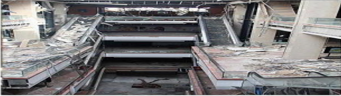
Görüntü .2.2. Bombalanmadan sonra alışveriş merkezi

Suriye’de en önemli sorunlardan biri göç etme, yani yerinden edilme sorunudur. Savaşın ilk kıvılcımları ile ortaya çıkan bu sorun ile birlikte hem ülke içinde hem de ülke dışına mecburi göçler olmuştur. Göç hareketlerinin başlaması ile operasyon alanları genişlemiştir. Göç etmek zorunda kalan insanların nüfusunun çoğunluğunu çocuklar oluşturmuştur.( Görüntü 2.3. ).