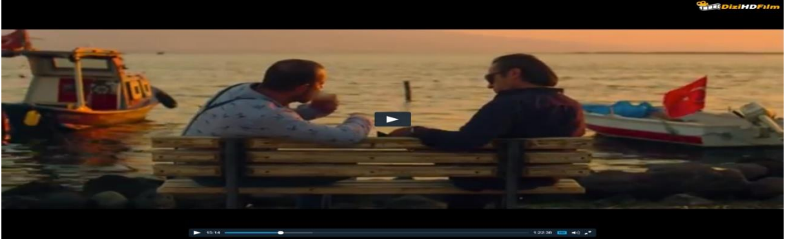
Görüntü.4.11.Pazarlıkların Türk bayrağı önünde yapılması

işlerin zaman zaman milliyetçilik kullanılarak temize çıkarılmaya çalışıldığının göstergesi olarak kullanılmıştır.(Görüntü.4.11).