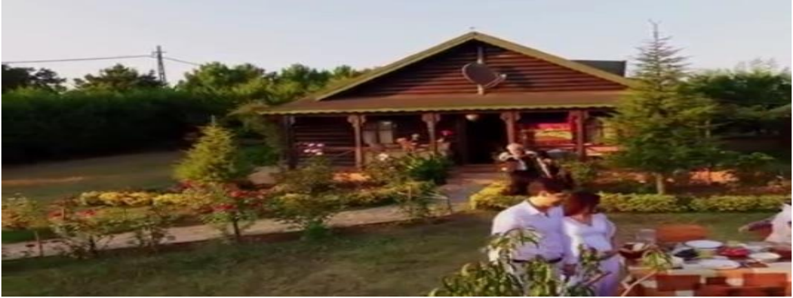
Görüntü.4.17. filmin son sahnesi.