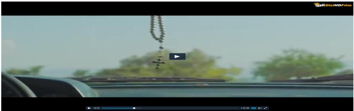
Görüntü.4.10. Kadın satıcısının arabasındaki Haç figürlü tesbih

Filmde kadın satıcısının kulağındaki küpede ve arabasının ön camına asılı tesbihte haç figürüne yer verilmesi, yasadışı iş yapanların Hristiyan batılı güçlerle olan sıkı bağlarına gönderme yapmaktadır( Görüntü. 4.10. ).