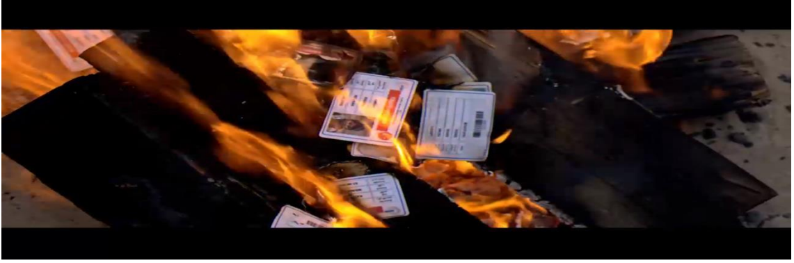
Görüntü.4.22. Bota binmeden önce kimliklerin yakılması

Kendi kişiliklerinin ve varlıklarının göstergesi olan kimleri yakmaları, yeni bir yaşama adım atmak için tüm aidiyet duygularından sıyrıldıklarına ve benliklerinden vazgeçmeyi kabul ettiklerine işaret eder. Gidecekleri yerin kültürünü, geleneklerini, kurallarını kabul etmeye hazır olduklarına göndermede bulunur.