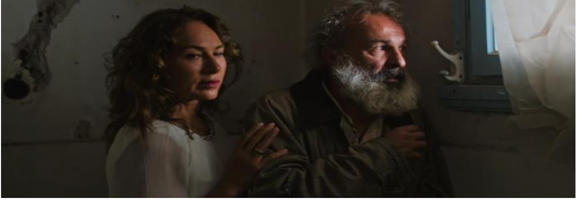
Görüntü.4.6. Yaşlı adam ve karısının olayı anlamaya çalıştığı sahne.

Arabada oturan kadının yüzünde endişe vardır. Adam ise rahat tavırlar sergilemektedir. Biraz zaman geçtikten sonra kadını isteyen diğer adam gelir. Beğendiğini belli ederek “Kız bu mu” diye sorar. Binadaki yaşlı adam ve karısı da hala onları dikkatle izlemeye devam etmektedir. Ambulans gelir ve doktor mülteci kadın ile tanışır. Doktorun nereli olduğuna ilişkin sorusuna mülteci kadın “ne fark eder” diye cevap verir. Operasyonun yapılması için binada uygun bir yer bulmaya giderler ve operasyon için uygun ortam bulup ameliyat düzenini kurarlar. Bu sırada oğlu hasta olan yaşlı adam gelir ve mülteci kadına kendisi sayesinde oğlunun kurtulacağını söyleyerek teşekkür eder. Kız çaresiz bir şekilde “Tanrı bizimle” der. Kızı ameliyat masasına yatırıp böbreğini alırlar( Görüntü.4.7. )