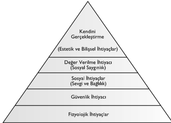
Şekil 1.2: Maslow'un İhtiyaçlar Hiyerarşisi

Birçok araştırmacı tarafından da belirtilen bireyi bir şey yapmaya motive eden etkenin ihtiyaçlar olması unsurunu ilk savunan İbn-i Haldun'dur, daha sonra daha detaylı olarak ele alıp ihtiyaçları sınıflayan Maslow olmuştur. Maslow insan ihtiyaçlarının bir önemlilik hiyerarşisi içinde olduğunu ileri sürmektedir. Buna göre, alt düzeydeki fizyolojik ihtiyaçların karşılanmasından sonra diğer ihtiyaçların karşılanmasına yönelik bir çaba oluşmaktadır. İhtiyaçların da tatmin edilme düzeyi kişileri davranışa sevk etmektedir (Şener, 2007). Maslow'un ihtiyaçlar hiyerarşisinde ihtiyaçlar iki boyutta ele alınmıştır (İbrahim ve Cordes, 2002). Bireyde meydana gelen yokluk hissi ve bu hissi giderme isteği ya da doğal veya sosyal yaşamdan ortaya çıkan gereklilik durumu ihtiyaç olarak açıklanmıştır (Karaküçük, 1999). Bu ihtiyaçların yoğunlukları bireyden bireye değişiklik göstermektedir. Maslow tarafından sınıflandırılan ihtiyaçlar hiyerarşisine aşağıdaki şekilde yer verilmiştir.