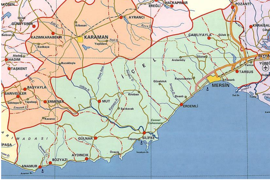
Mersin Siyasi Haritası