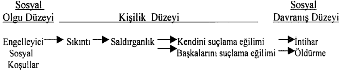
Şekil 4.1. Henry ve Short (1954)'un engelleme ve saldırganlık kuramı şeması