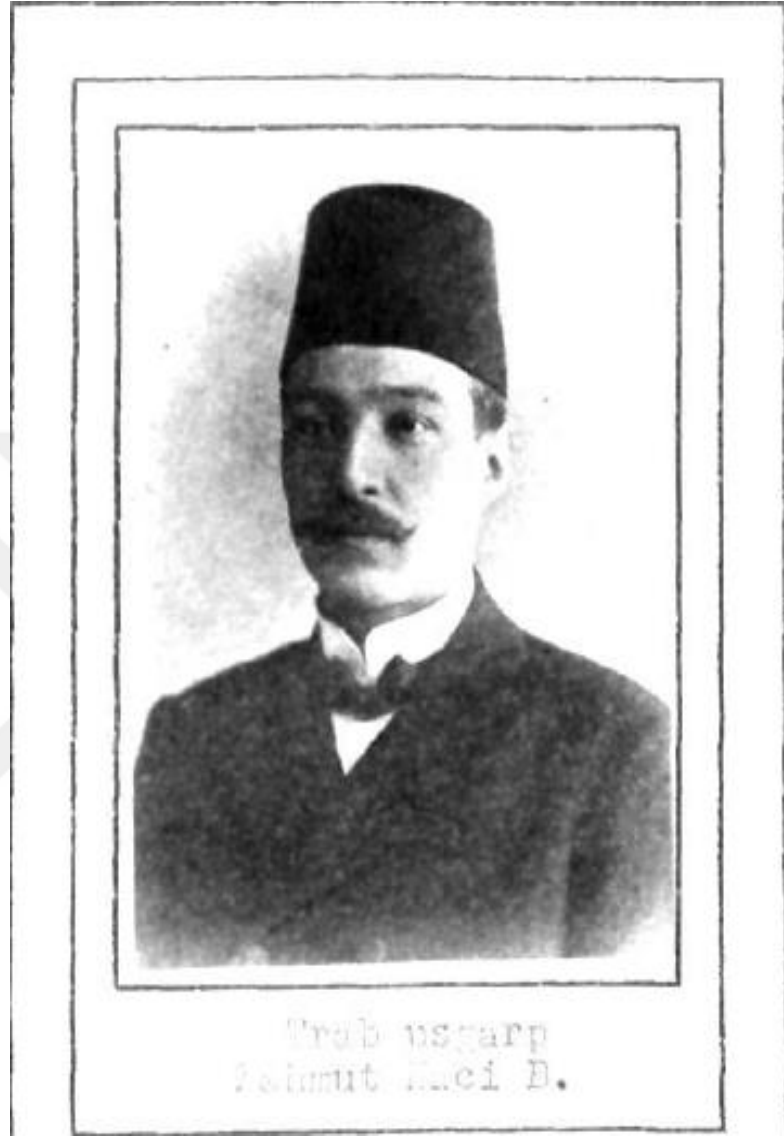
Trablusgarp vilayetinden 1912 yılında seçilen Türk milliyetine mensup Mahmut Naci Bey.