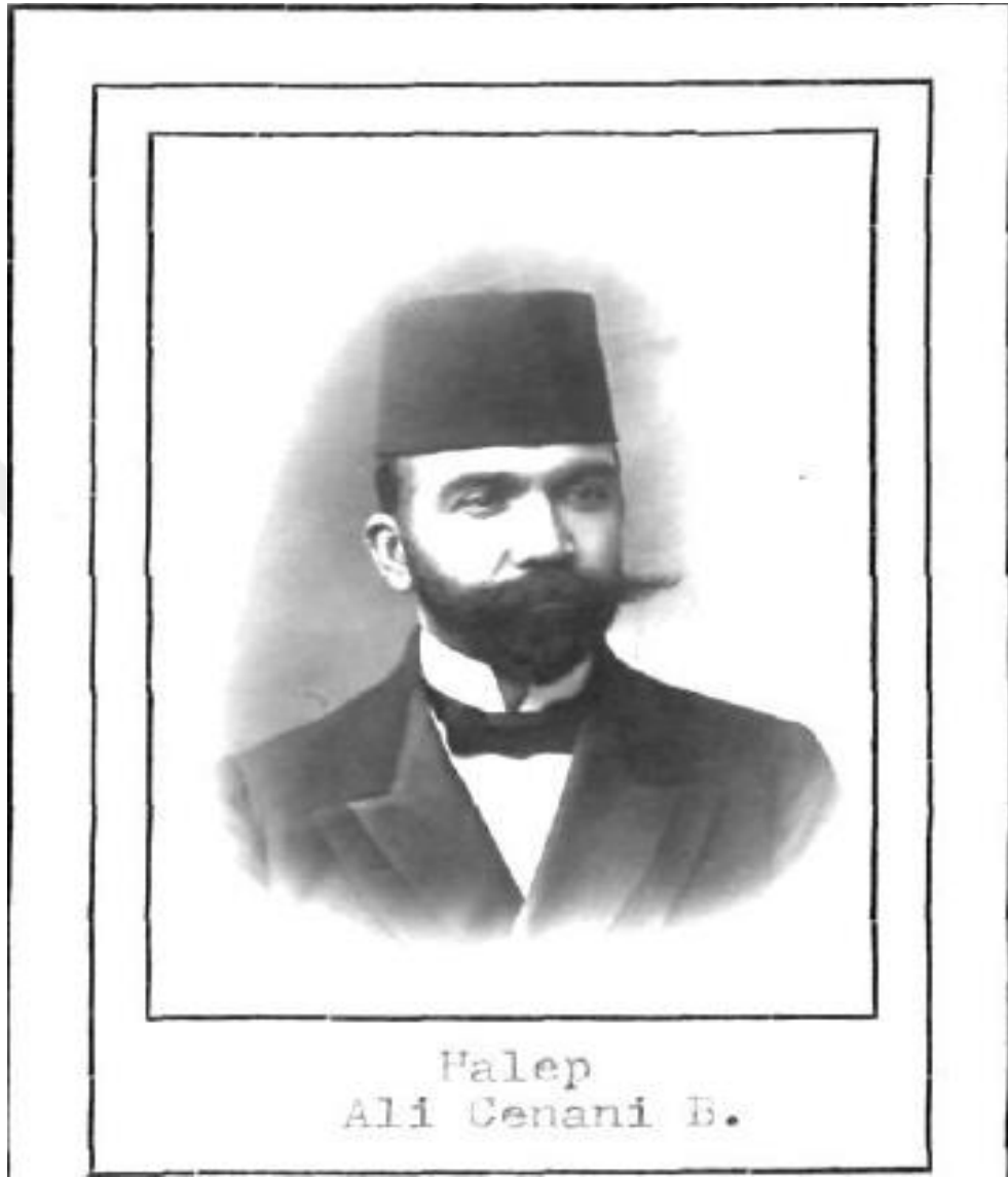
Halep vilayetinden 1912 yılında seçilen Ali Cenani Bey.