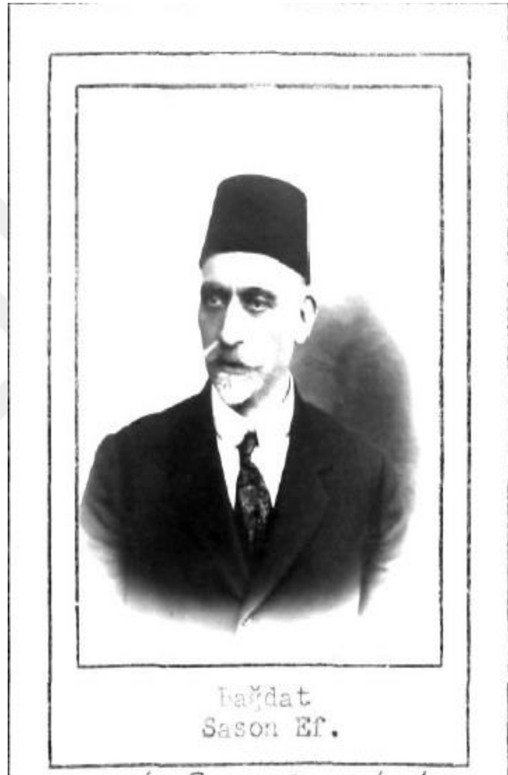
Bağdat'tan 1912 yılında seçilen Musevi milliyetine mensup Sason Efendi.