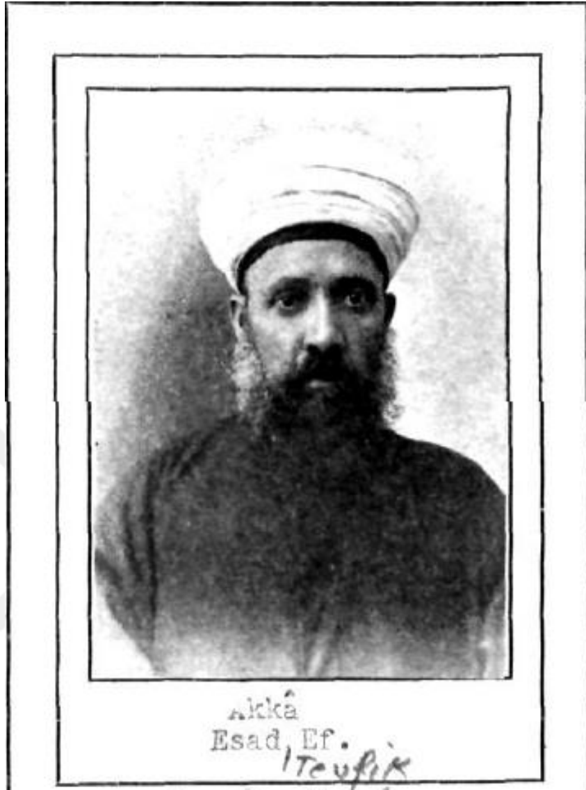
Akka sancağından 1912 yılında seçilen Arap milliyetine mensup Esad Efendi.