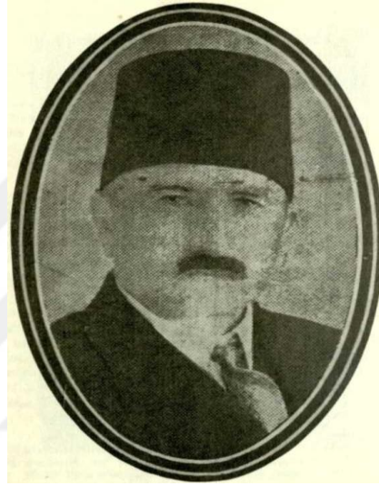
Resim: 1 Mustafa Vasfi Beyin ilk milletvekilliđi yıllarında çekildiđi fotoğraf