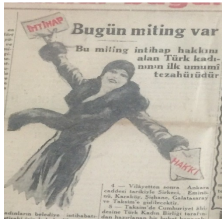
Cumhuriyet 11 Nisan 1930