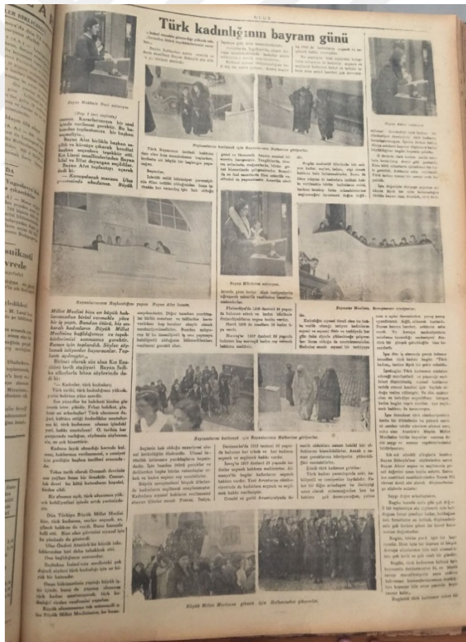
Ulus 8 Aralık 1934