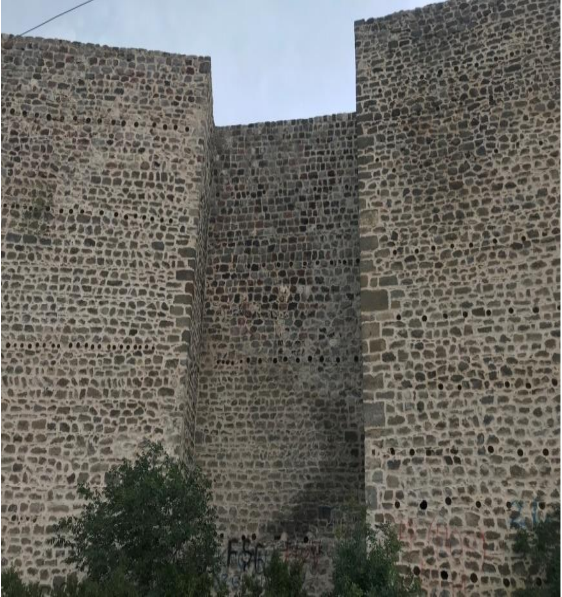
Resim 1: Niksar Kale Surları