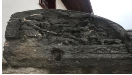
Resim 12: Lüleçizade Çeşmesinin Genel Görünüşü ve Akroterleri