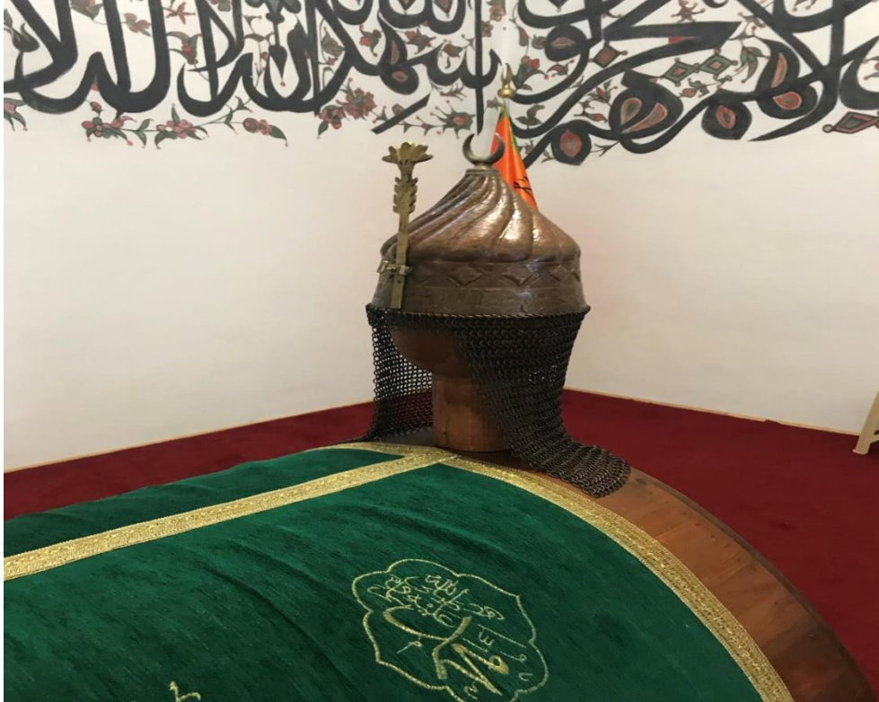
Resim 22: Melik Ahmed Danişmend Gazi Türbesi'nin İçten Görünüşü