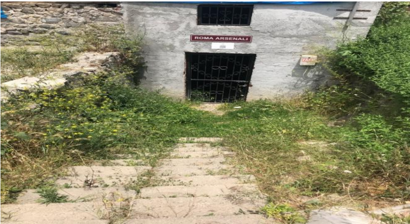
Resim 11: Roma Arsenali'nin Girişi