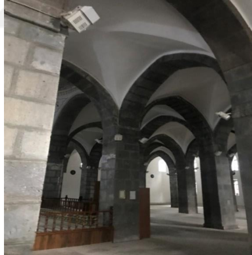
Resim 16: Niksar Ulu Camii'nin İten Grntleri