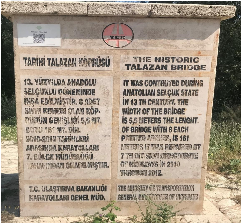
Resim 28: Talazan Köprüsü'nün Açıklama Metni