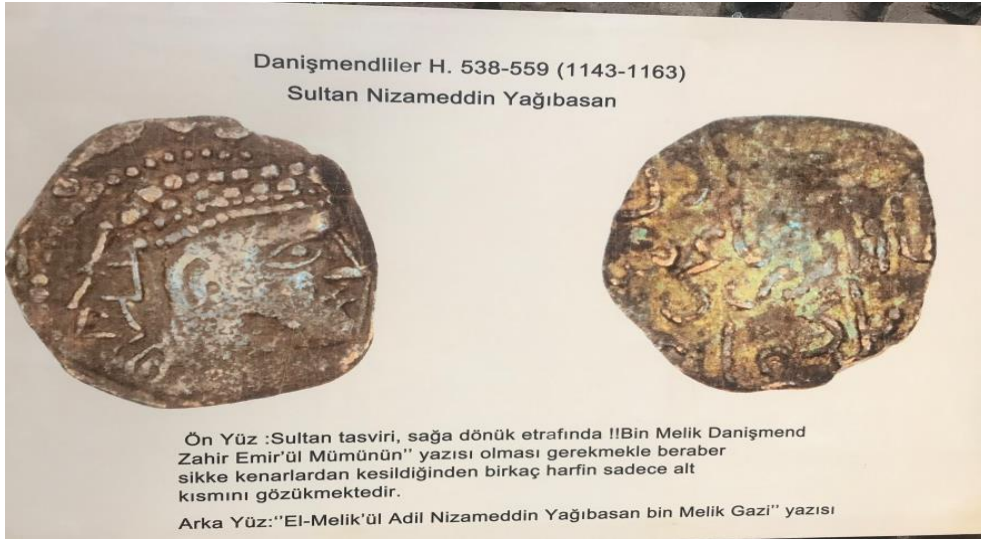
Resim 31: Yağıbasan Medresesi'nin İçinde Sergilenen Sikke Fotoğrafları