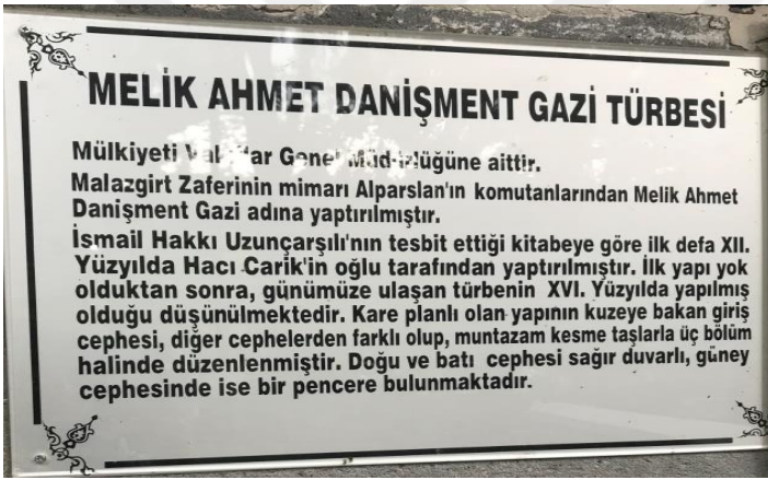
Resim 20: Melik Ahmed Danişmend Gazi Türbesi'nin Görüntüsü