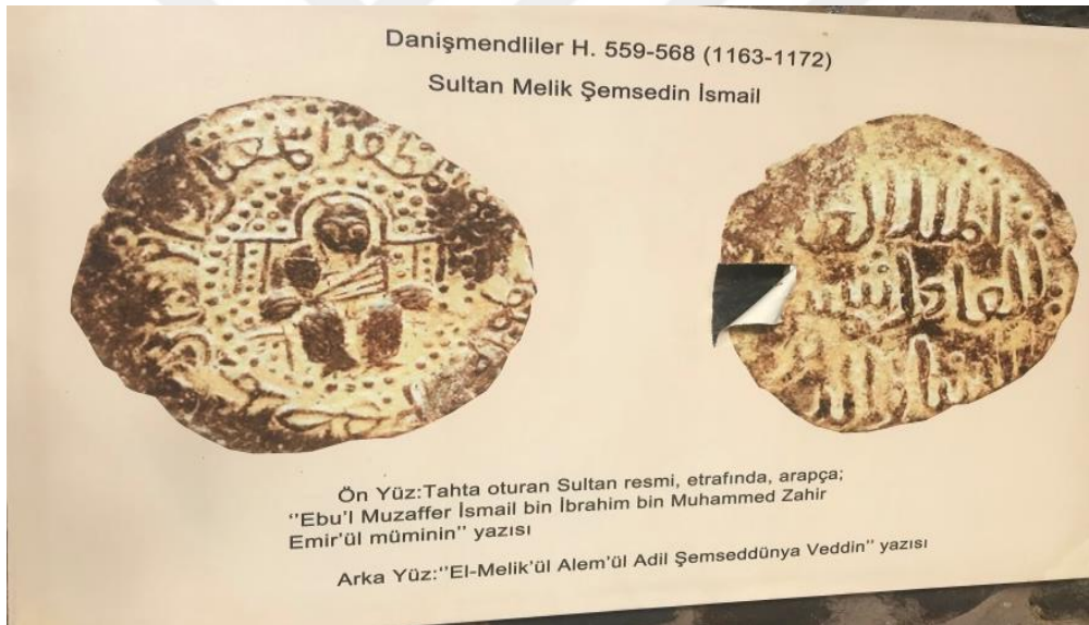
Resim 32: Yağıbasan Medresesi'nin İçinde Sergilenen Sikke Fotoğrafları