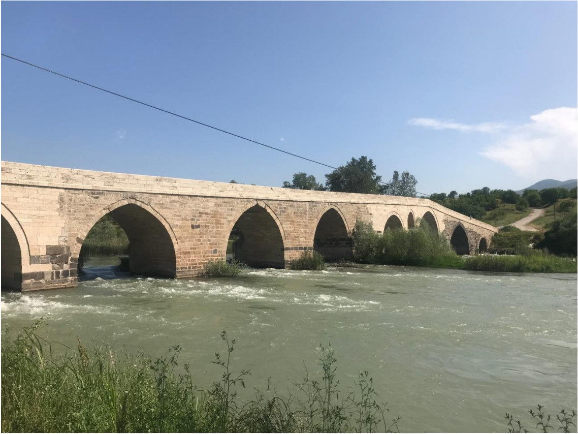
Resim 29: Talazan Köprüsü'nün Genel Görünüşü