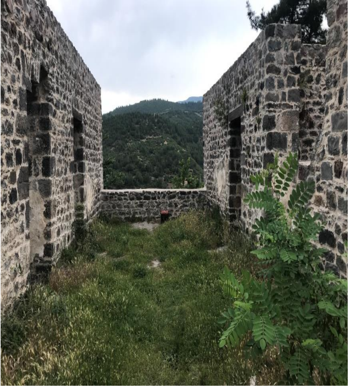
Resim 2: Kale Surlarından Görüntüler (Emine Tetik Kanar Fotoğraf Arşivi)