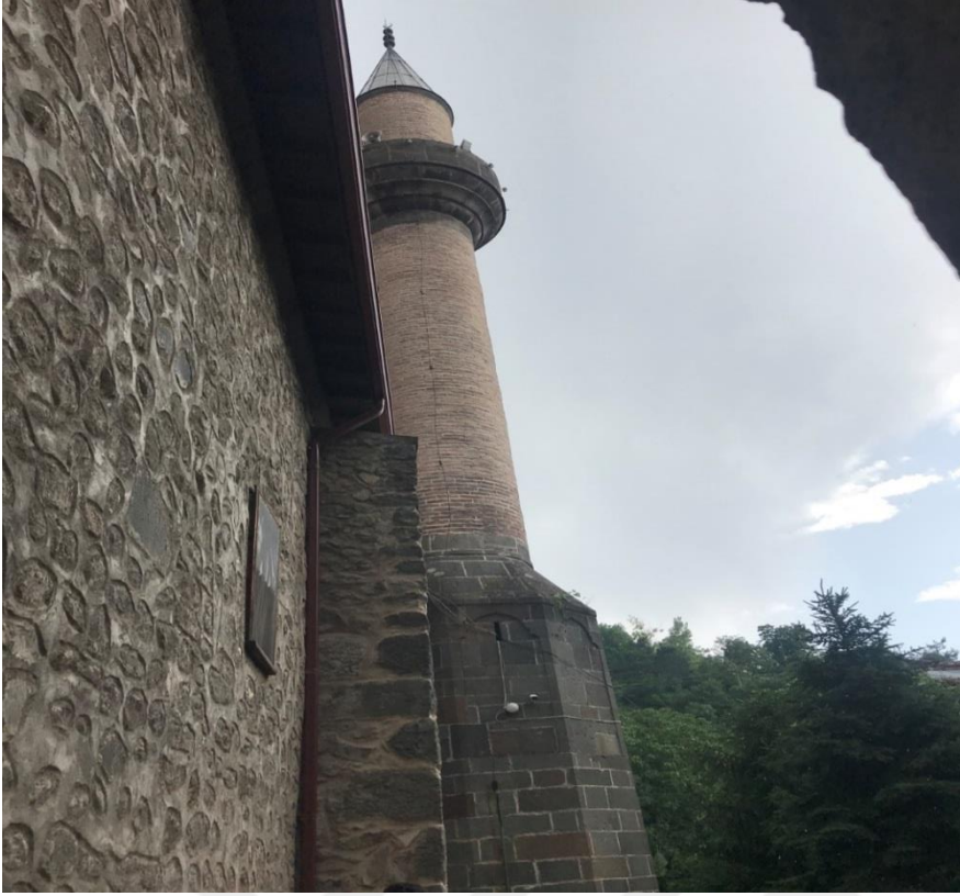
Resim 15: Niksar Ulu Camii'nin Minaresi