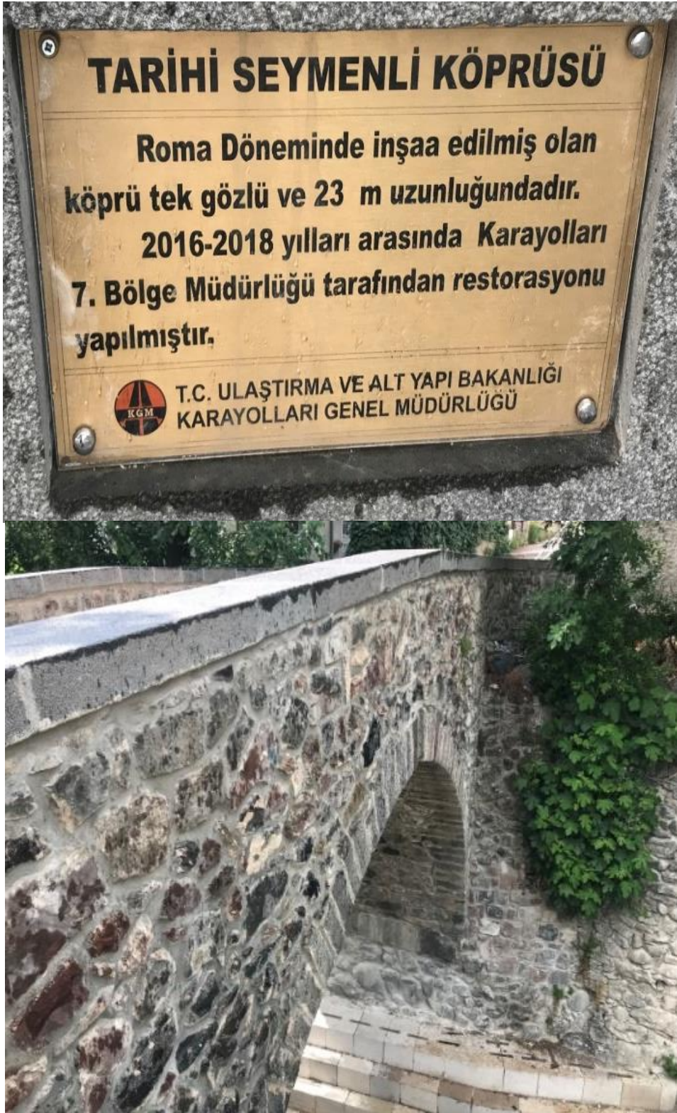
Resim 14: Seymenli Köprüsünün Genel Görünüşü