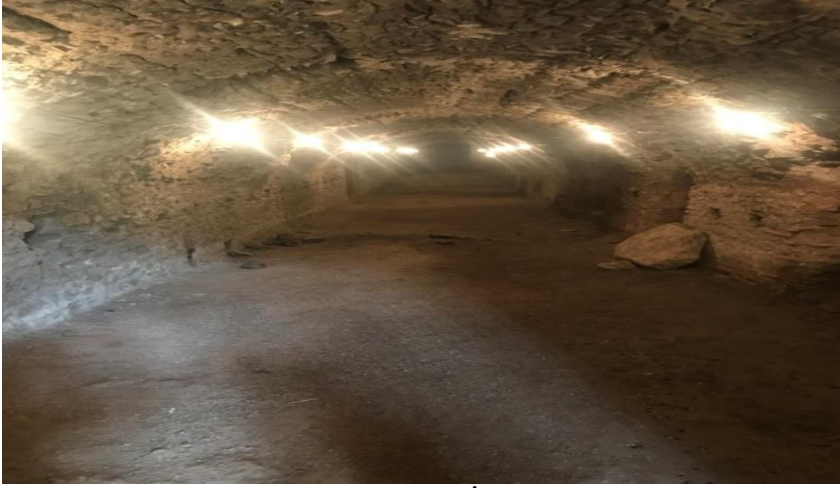
Resim 9: Roma Arsenali'nin Dıştan İçe Görüntüsü