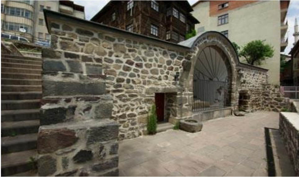
Resim 27: Hacı Çıkrık Medresesi 374