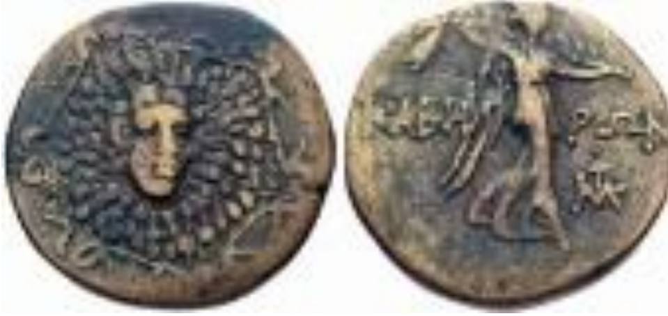
Resim 33: Kaberia Sikkesi 375