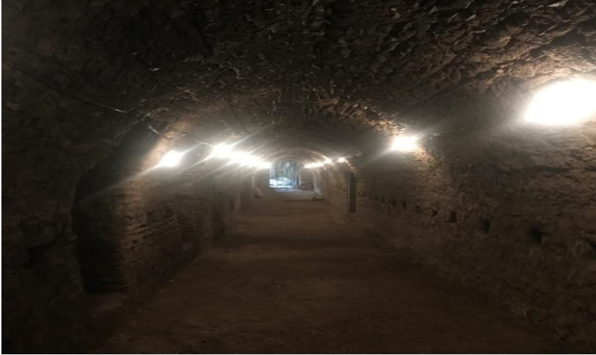
Resim 10: Roma Arsenali'nin İçten Dışa Görüntüsü