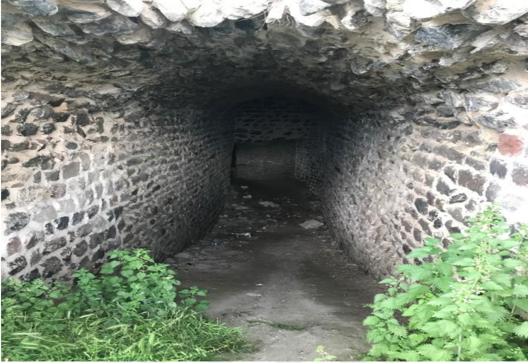
Resim 3: Kale Zindanının Giriş