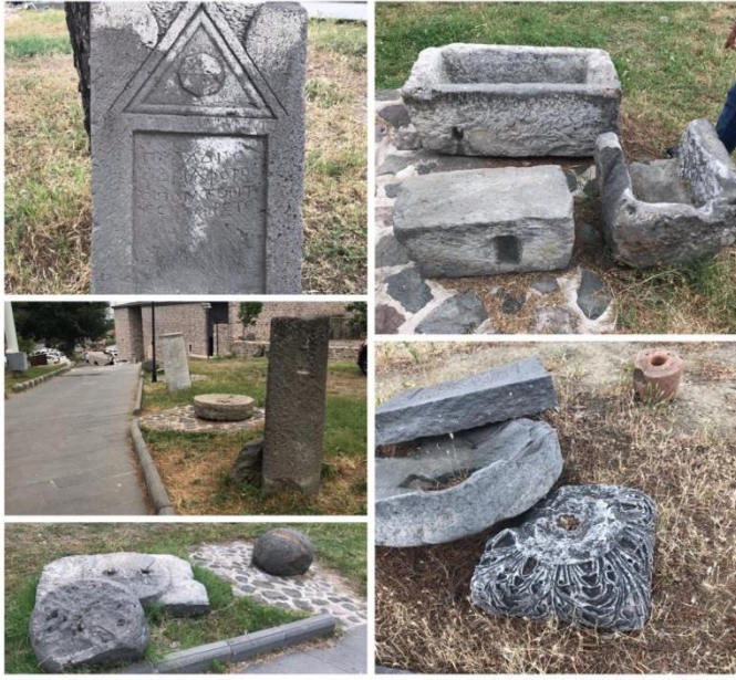
Resim 7: Kalede Sergilenen Bazı Taş Eserler