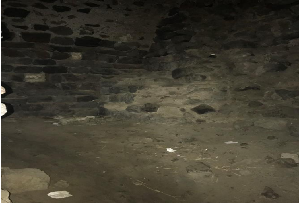
Resim 4: Kale Zindanının İçi