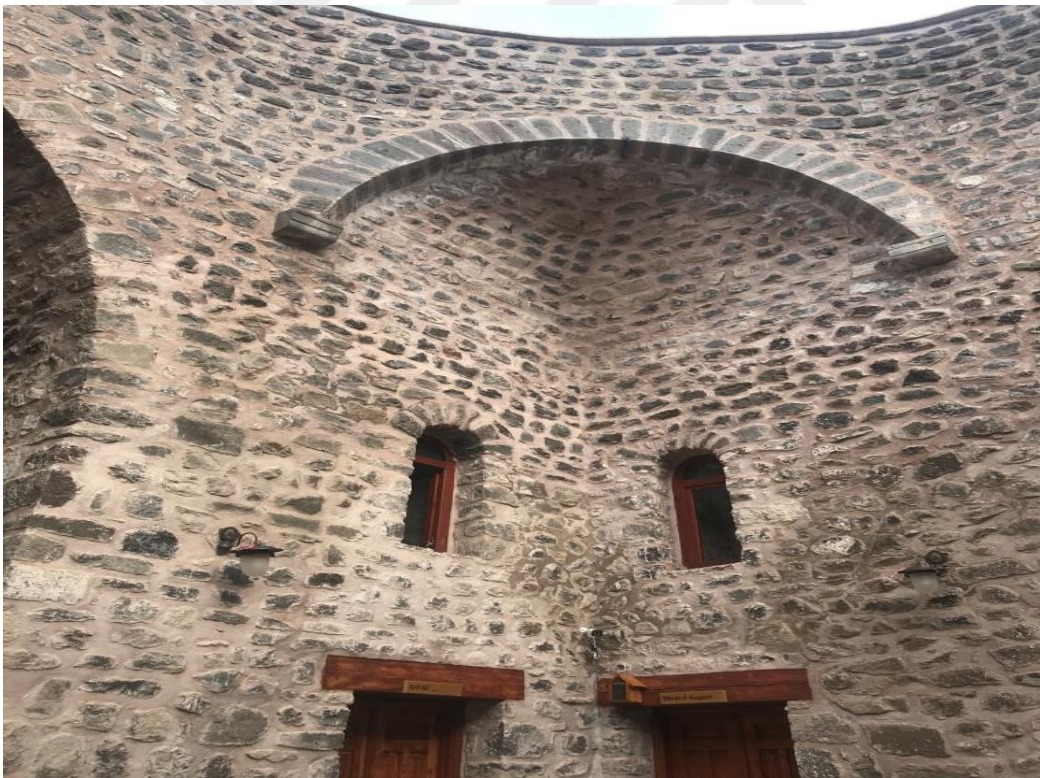
Resim 26: Yağıbasan Medresesi'nin İçten Görüntüleri