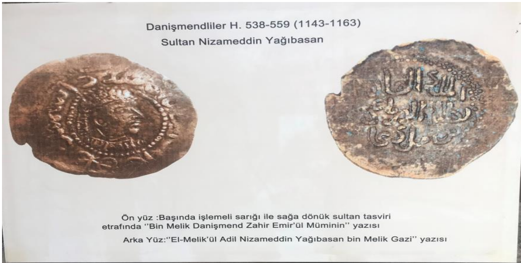
Resim 30: Yağıbasan Medresesi'nin İçinde Sergilenen Sikke Fotoğrafları