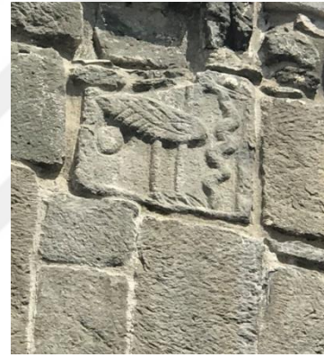
Resim 13: Leylekli Köprü'nün Genel Görünüşü ve Üzerindeki Leylek Motifi