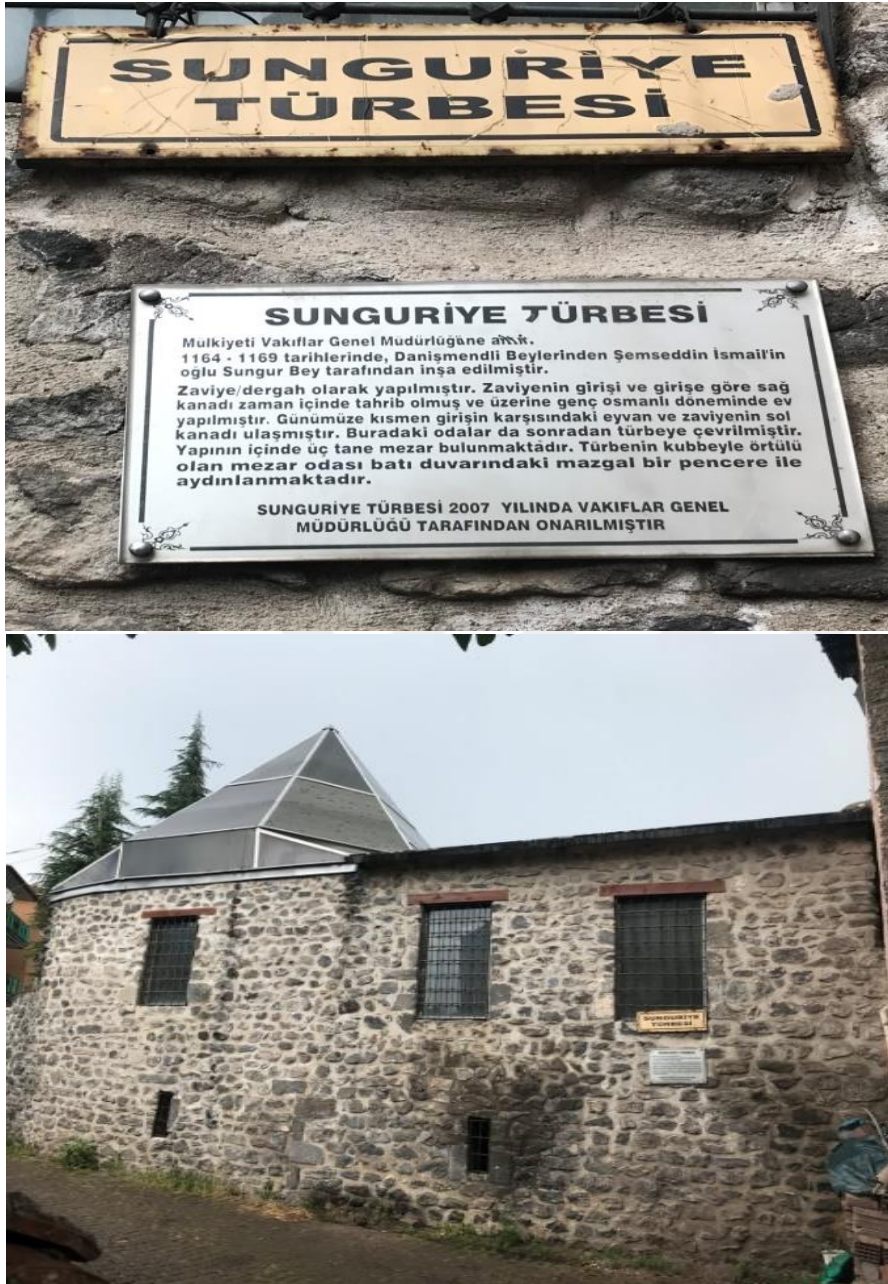
Resim 18: Sunguriye Türbesinin Genel Görünüşü