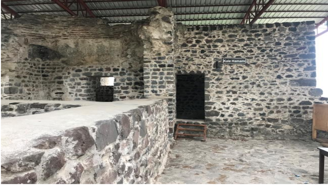
Resim 5: Kale Hamamı