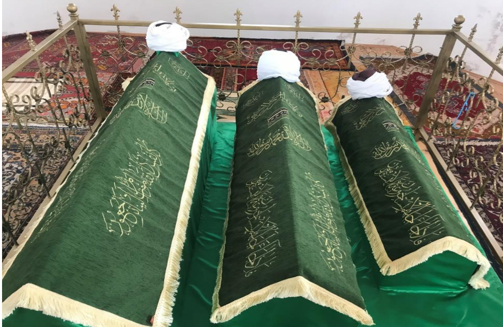
Resim 23: Nizameddin Yağibasın Türbesi'nden Görüntüler