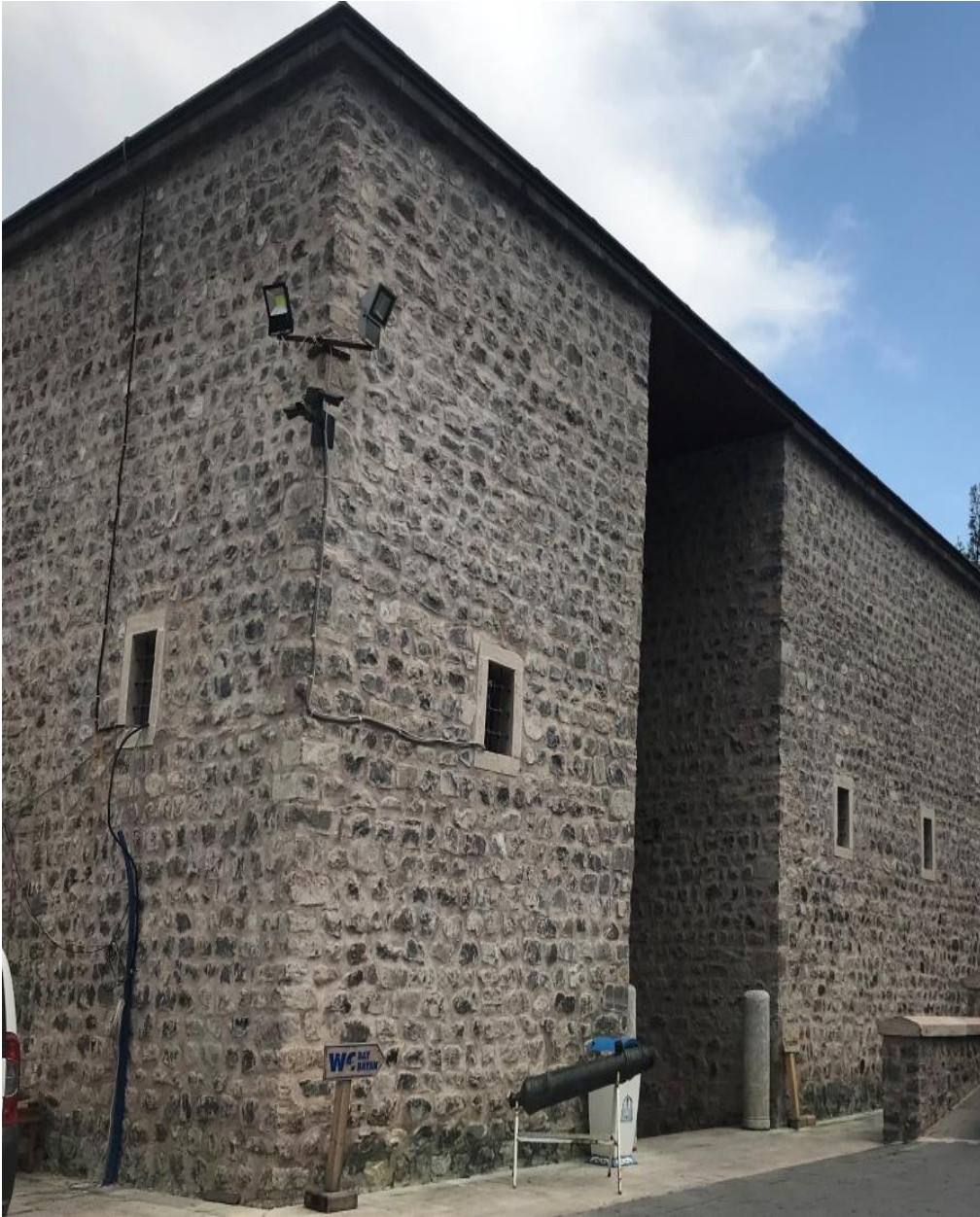
Resim 25: Yağıbasan Medresesi'nin Dıştan Görünüşü