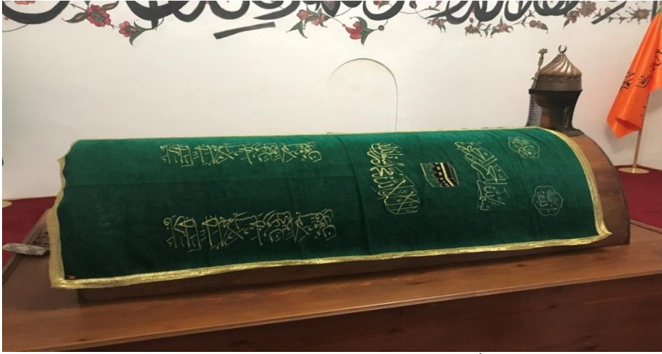
Resim 21: Melik Ahmed Danişmend Gazi Türbesi'nin İçten Görünüşü