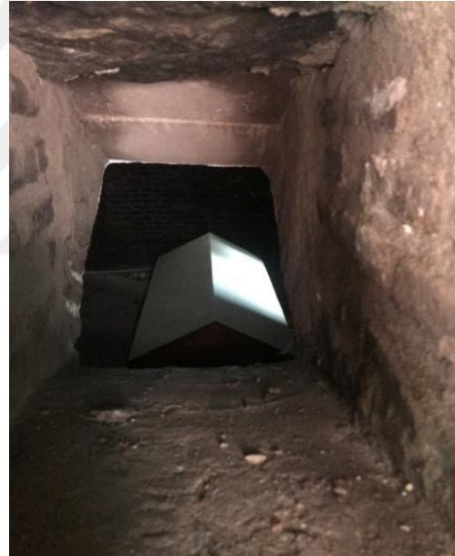
Resim 17: Kırkkızlar Türbesinin Genel Görünüşü ve Mumyalık Bölümü