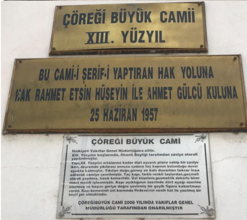
Resim 19: Çöregi Büyük Camii'nin Kapısı