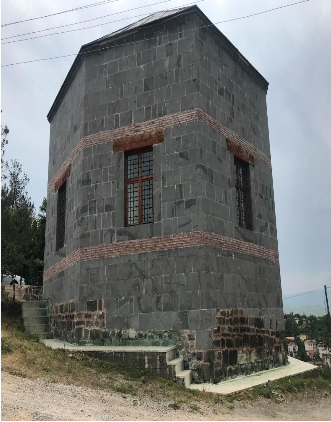
Resim 24: Nizameddin Yağlıbasan Türbesinin Genel Görünüşü