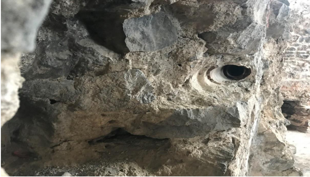
Resim 6: Kale Hamamı Su Tesisatı