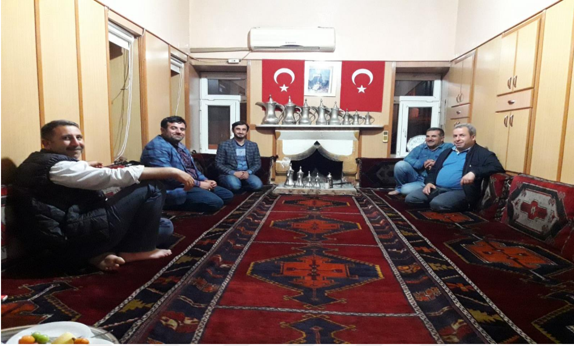
17-Barak Odası Arıkdere Köyü