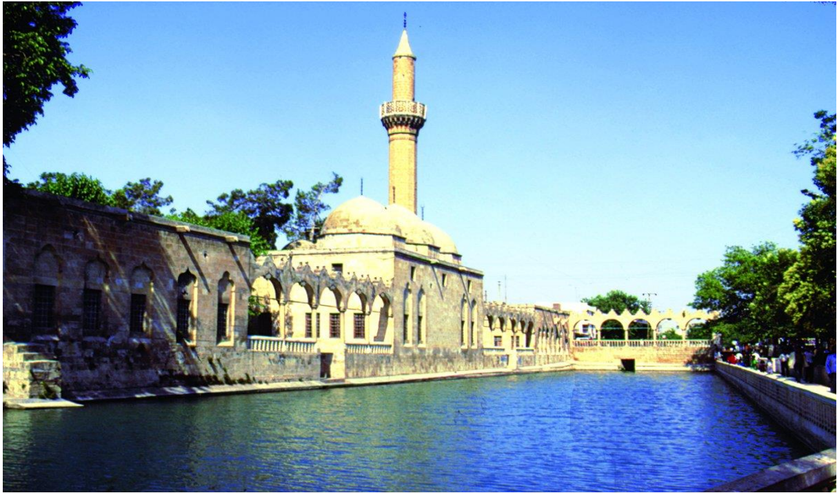
6-Şanlıurfa'da Bulunan Halilurrahman ve Balıklı Göl.