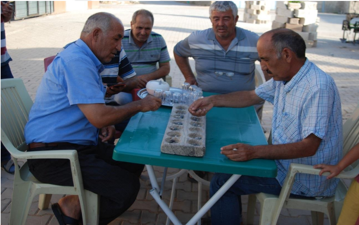
24-Arıkdere Köyünde Mangala Oyunu