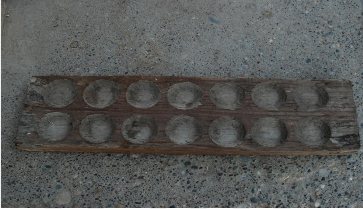
15-Mangala Oyunu Tahtası