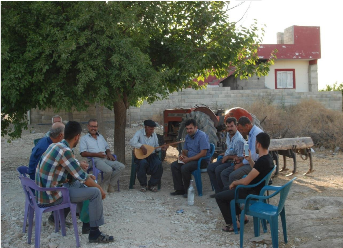
22-Eceler Köyünde Yapılan Mülakata Ait Bir Fotoğraf.