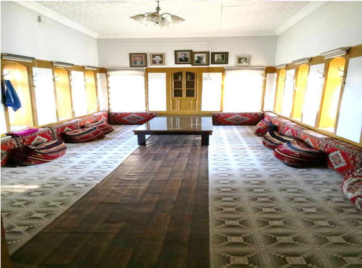
18-Barak Odası Balaban Köyü