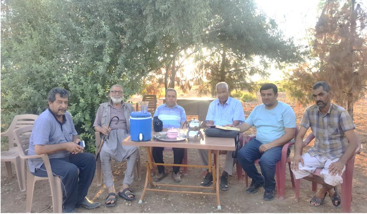
21-Erenyolu Köyünde Yapılan Mülakata Ait Bir Fotoğraf.