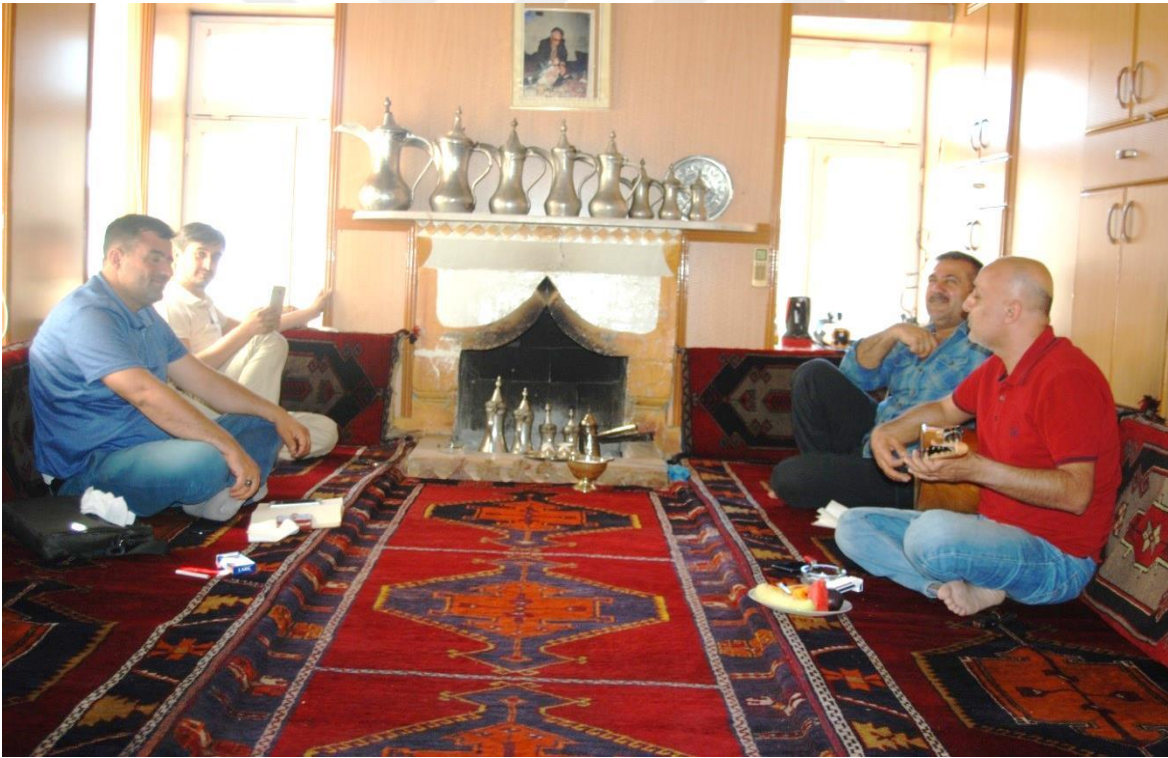
16-Arıkdere Köyünde Yapılan Mülakata Ait Bir Fotoğraf