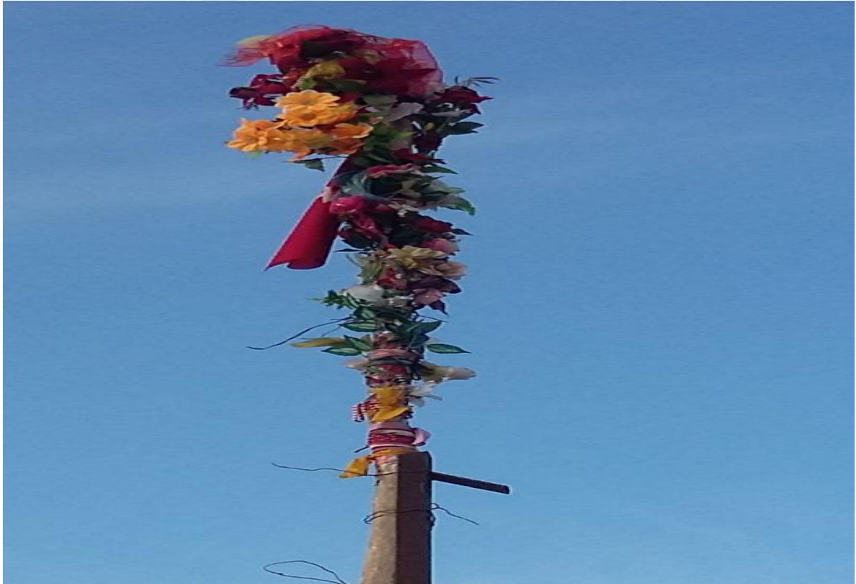
10- Düğün Bayrağına Bir Örnek.