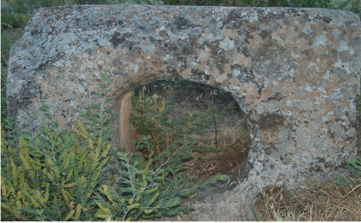
7-Çakırođlu Köyü Mezarlığında Bulunan Öksürük Kayası.