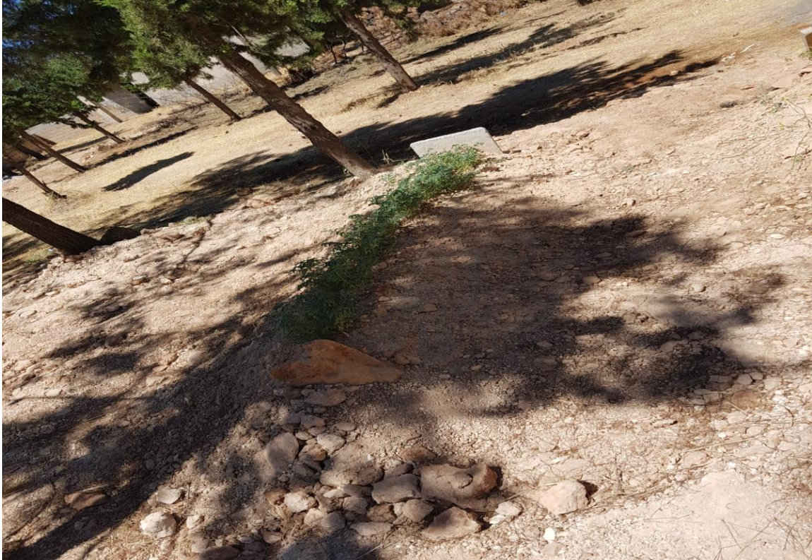
8-Yeni Ölen Bir Kişinin Mezarı Üzerine Ekilmiş Nohuta Örnek