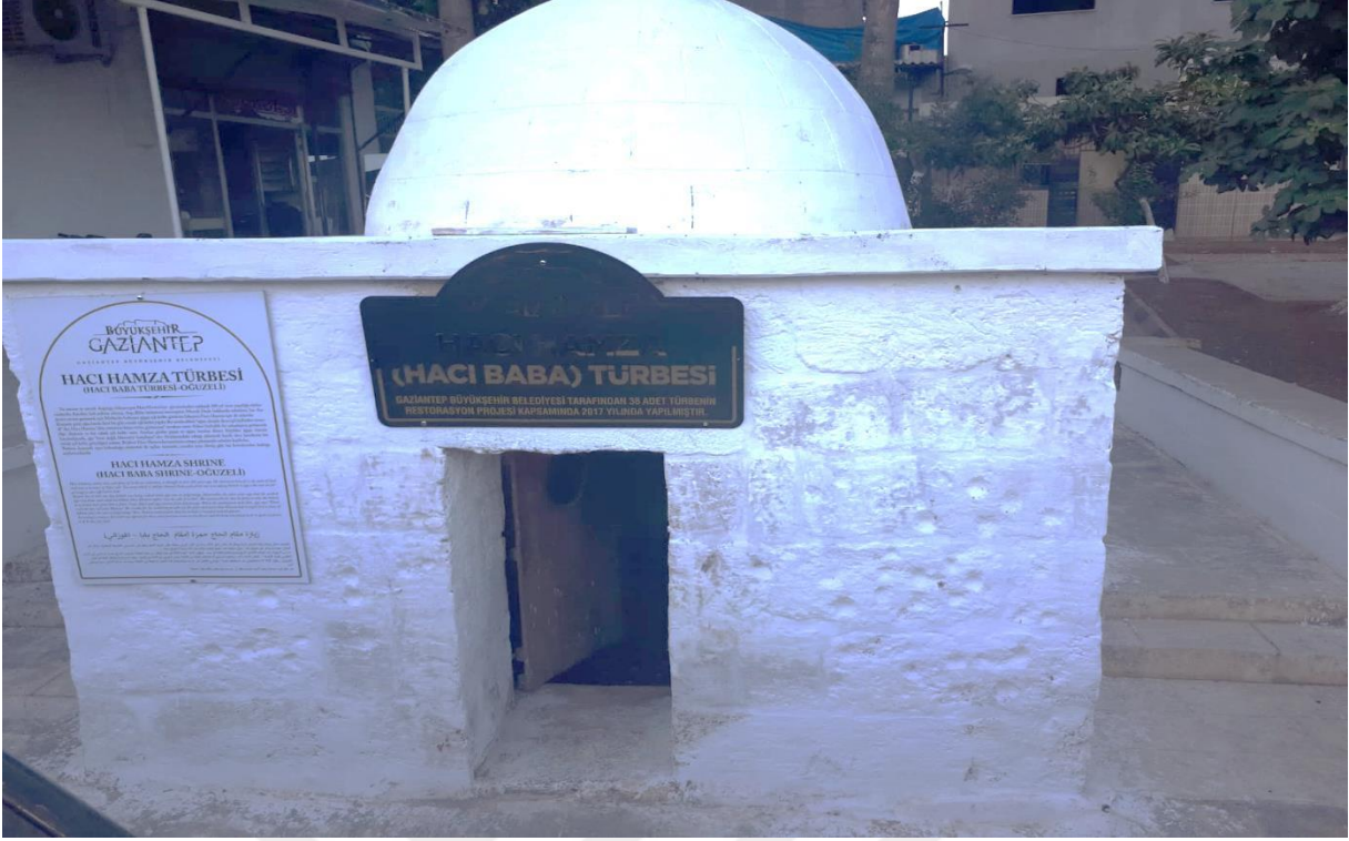
3-Oğuzeli ilçesinde Bulunan Hacı Hamza Türbesi.