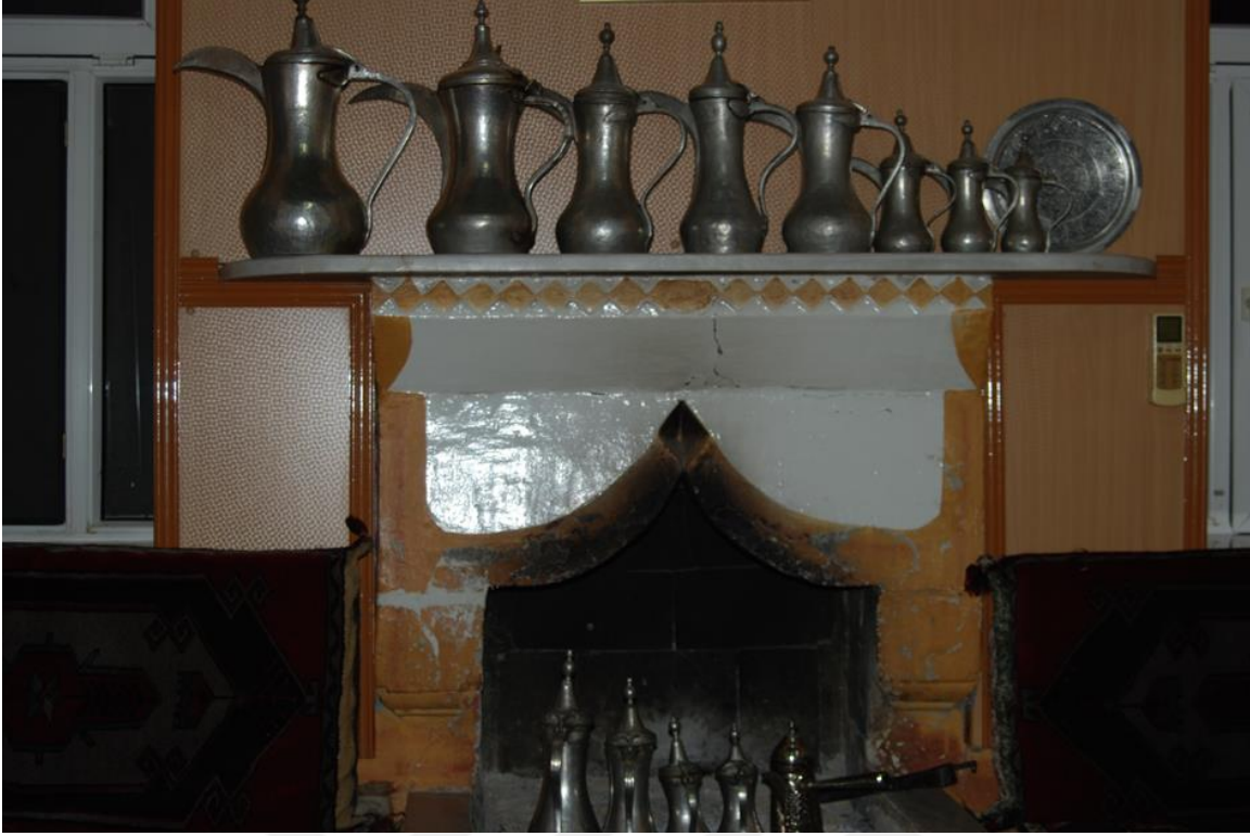
19-Acı Kahve Yapımında Kullanılan Cezveler