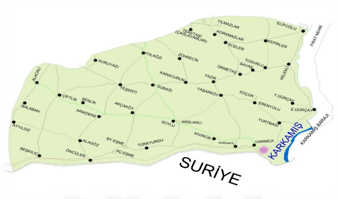
1-Karkamış İlçe Sınırlarını Gösterir Harita