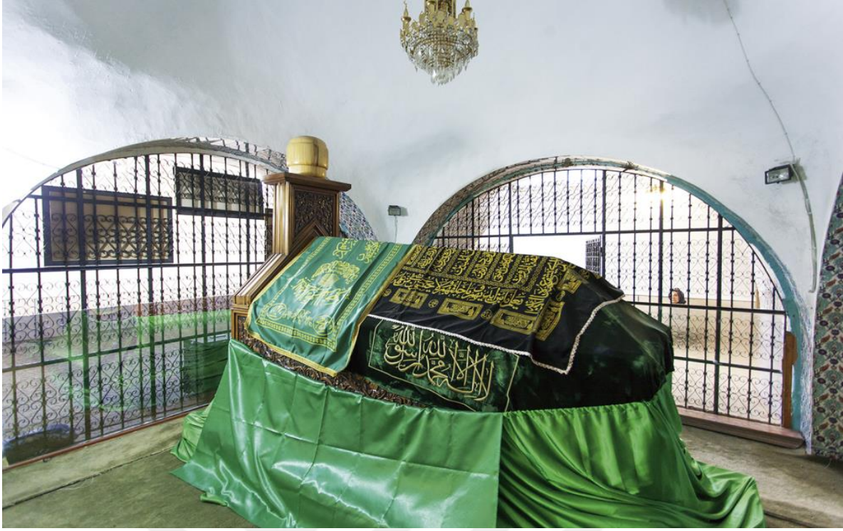
5-Nurdağı İlçesinde Bulunan Ökkeşiye Türbesi