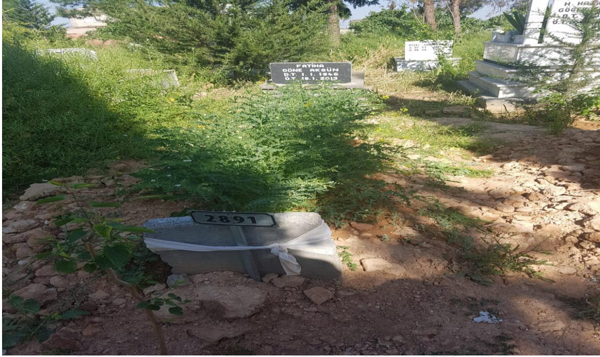
9-Mezar Üzerine Ekilmiş Nohuta Bir Örnek Alaçalı Köyü