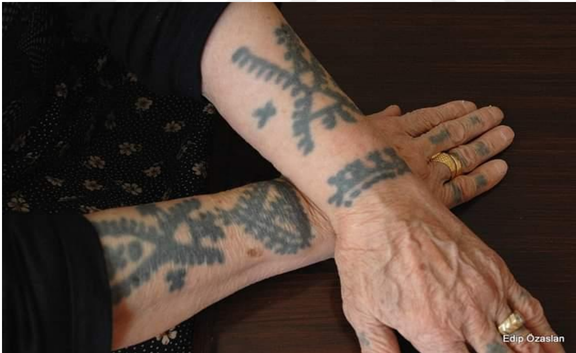
2-Barak Kadınlarında Bulunan Dövmeye Bir Örnek