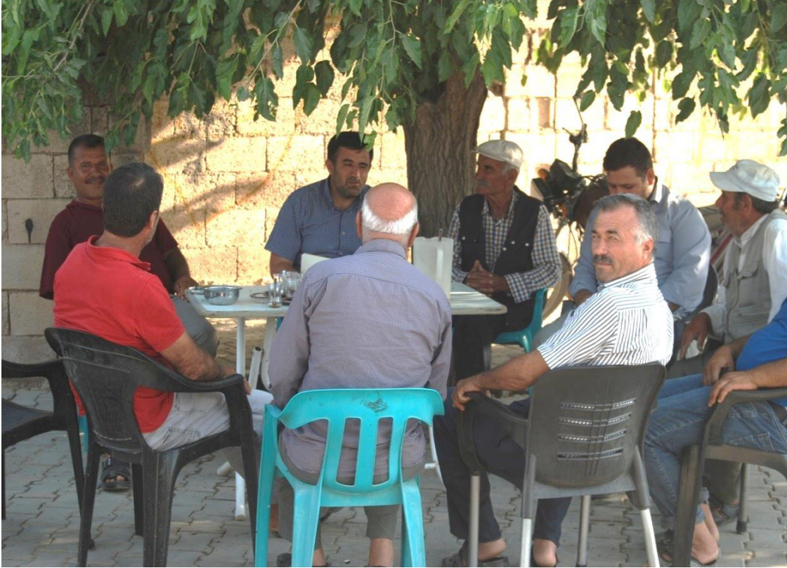
23-Keekli Köyünde Yapılan Mülakata Ait Bir Fotoğraf.