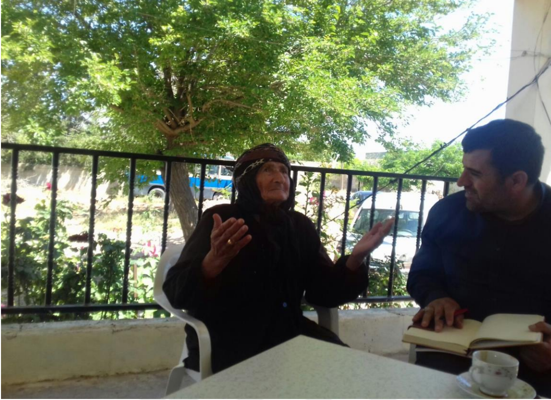
25-Alaçalı Köyünde Yapılan Mülakata Ait Bir Fotoğraf.