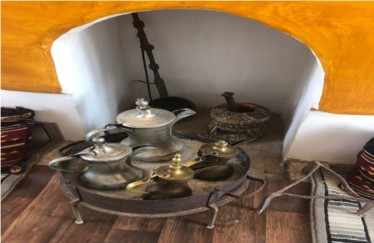
20-Acı Kahve Yapımında Kullanılan Dibek, Kahve Tavası, Cezve... vs.