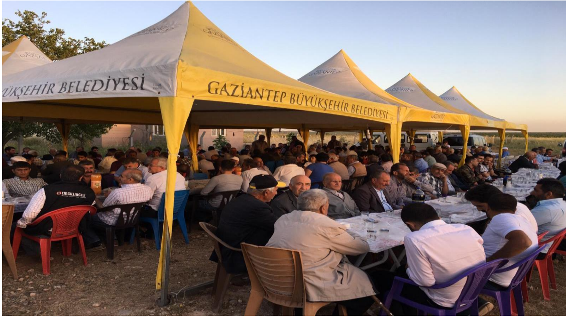
13-Alaçalı Köyünde Taziye Çadırına Bir Örnek.