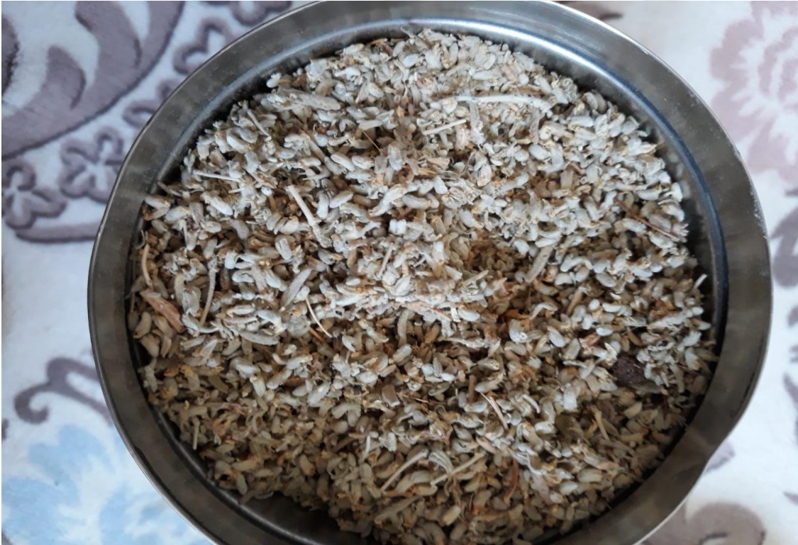
12-Üzerlik Tütsüsünde Kullanılan Üzerlik Bitkisi