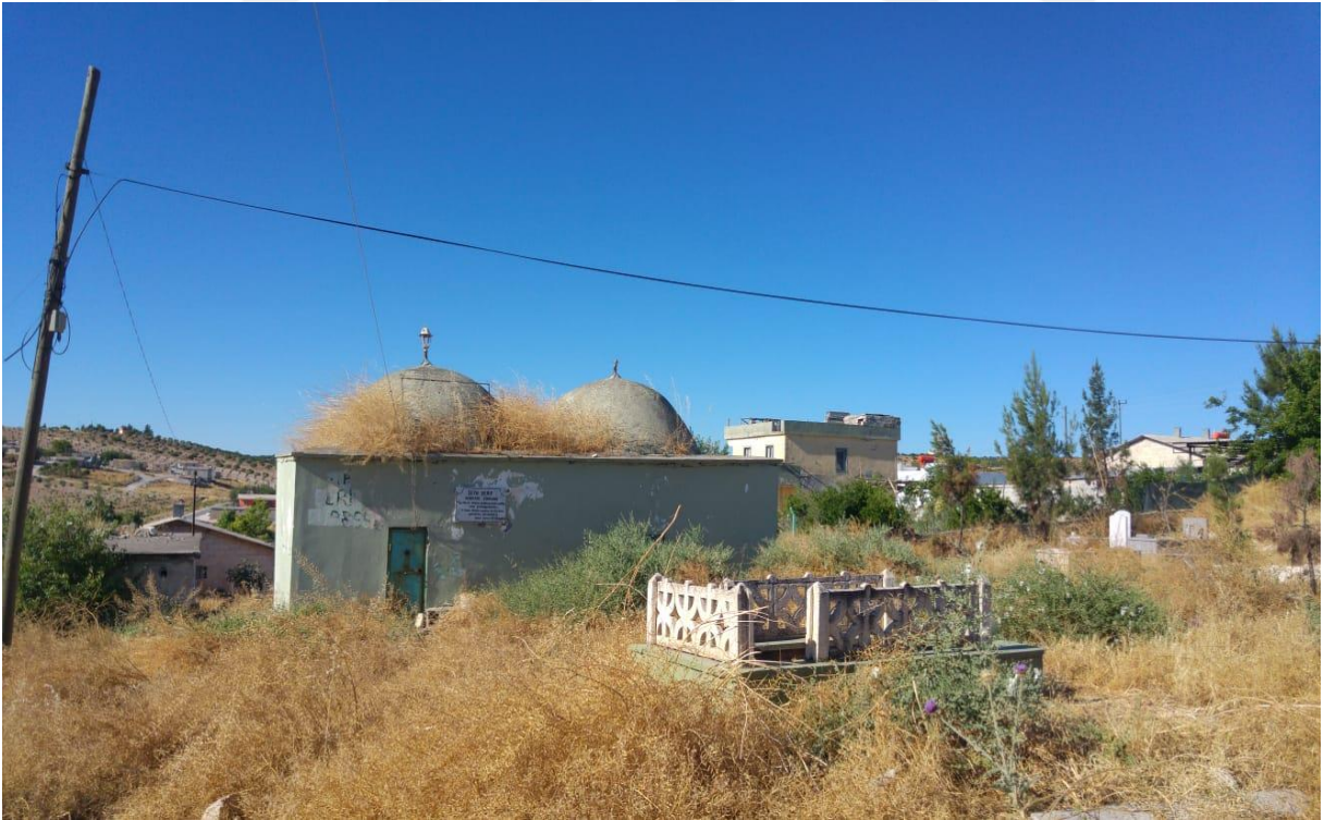
4-Nizip İlçesine Bağlı Kale Köyündeki Şih Şerif Türbesi.