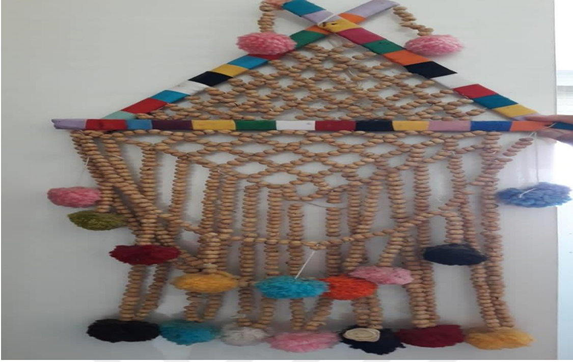
11-Üzerlik Bitkisinden Yapılmış Bir Nazarlık