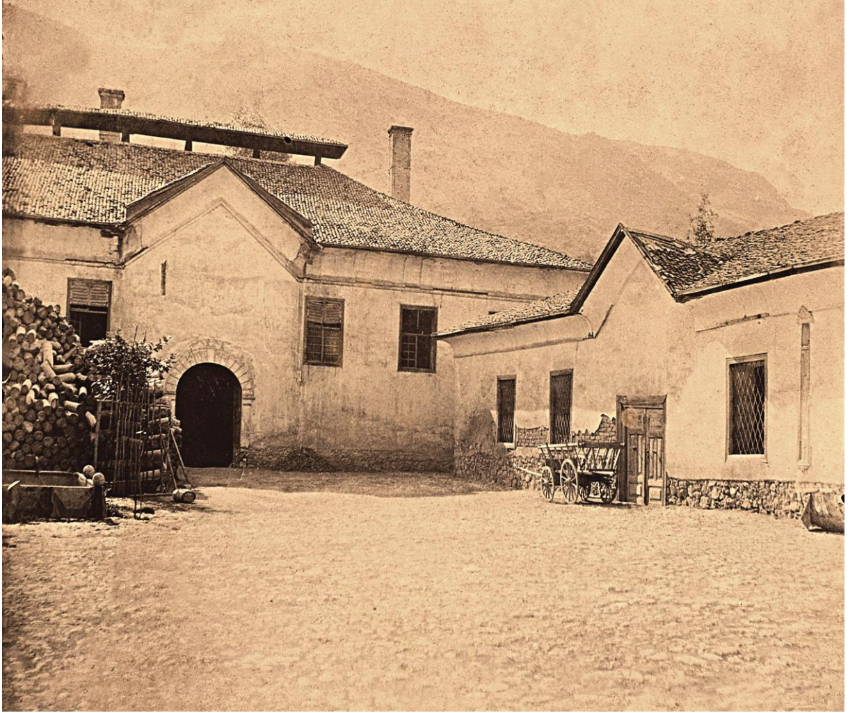
Tokat Kalhanesi fotoğrafı.