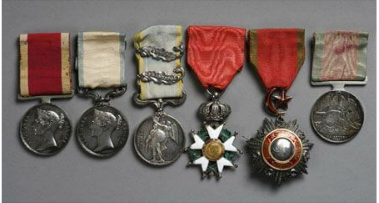
Ek:4- Osmanlı Devleti'nde verilen nişanlara örnekler.

( https://www.kitantik.com/product/OSMANLI-MECIDI-MURASSA-NISANI-MADALYA-COK-NADIR-A6161 )