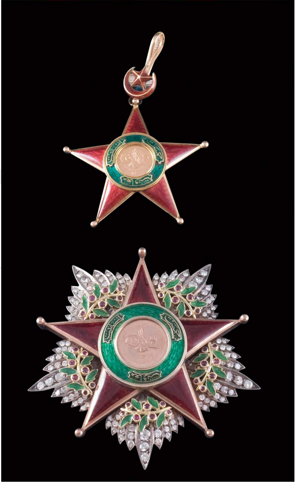
Ek:5- İmtiyaz Nişanı Örneği.

( https://ismek.ist/blog/icerik.aspx?p=1202 )