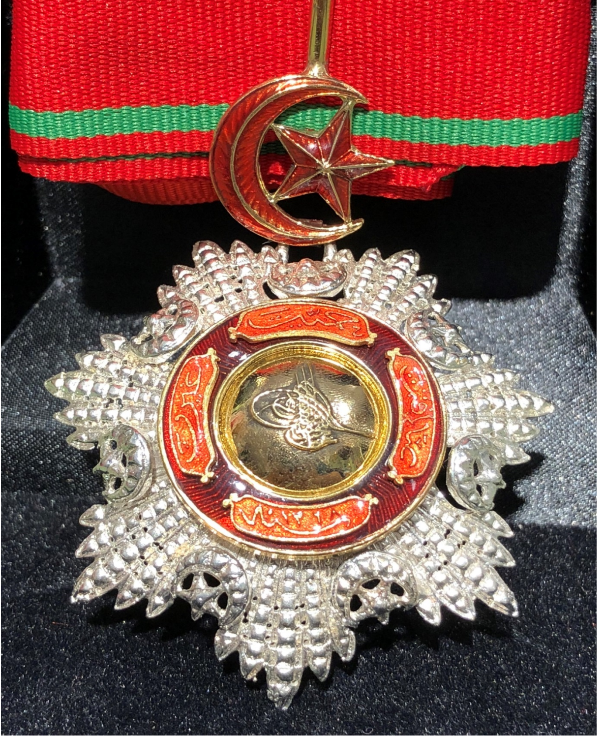
EK:1- Mecidi Nişan Örneği.

( https://osmanlidunyasi.com/osmanli-mecidi-nisani-gumus-04 )