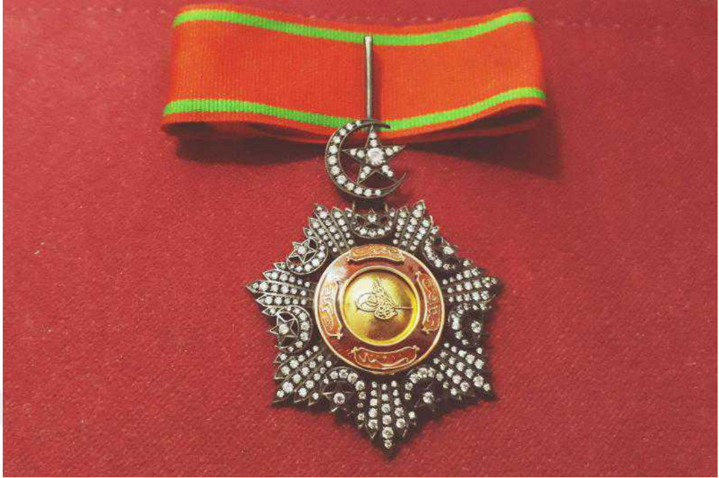
Ek:3- Murassa Nişanı Örneği.

( https://www.kitantik.com/product/OSMANLI-MECIDI-MURASSA-NISANI-MADALYA-COK-NADIR-A6161 )