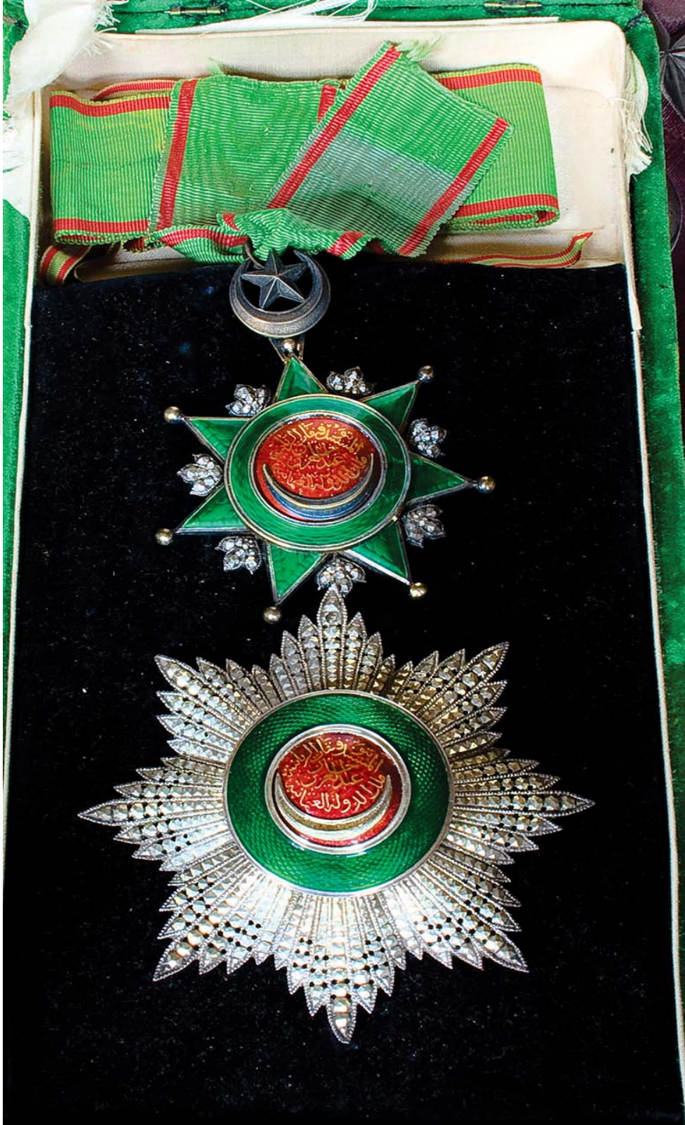
Ek:2- Osmani Nişan Örneği

( https://ismek.ist/blog/icerik.aspx?p=1202 )