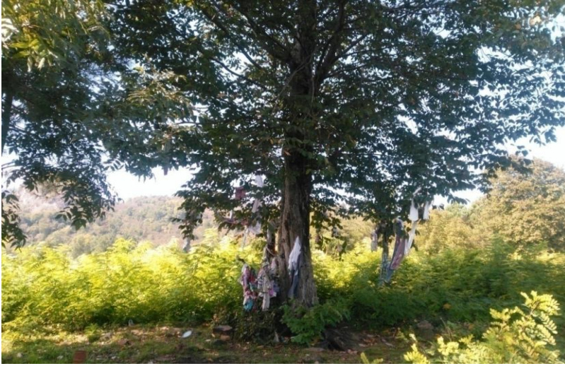
Resim- 8: Karahamza Dilek Ağacı - Çatalpınar