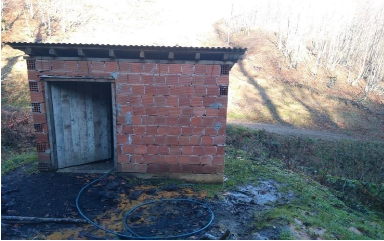
Resim- 5: Belalan Erikdamı Mevkii Acı Suyu - Korgan