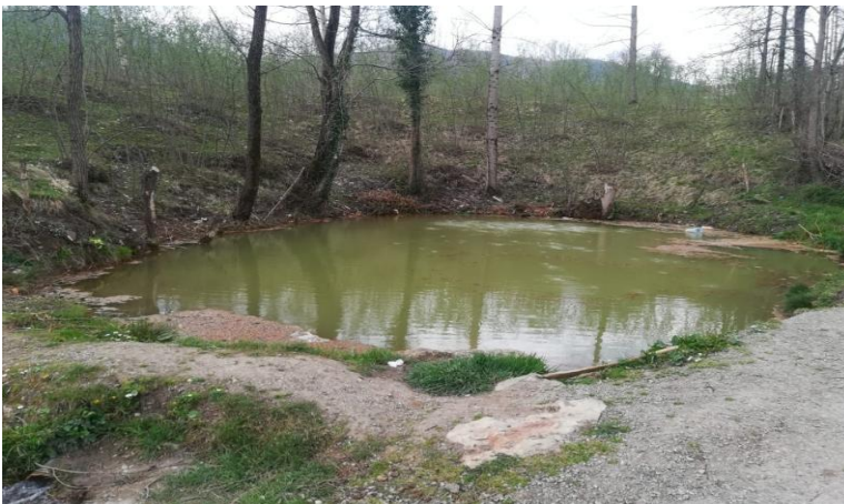
Resim- 6: Çermik Suyu - Gölköy