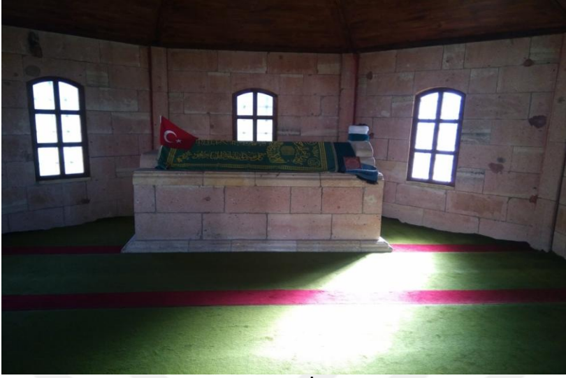
Resim- 12: Emîr Kümbet Türbesi İç Kısmı - Aybastı