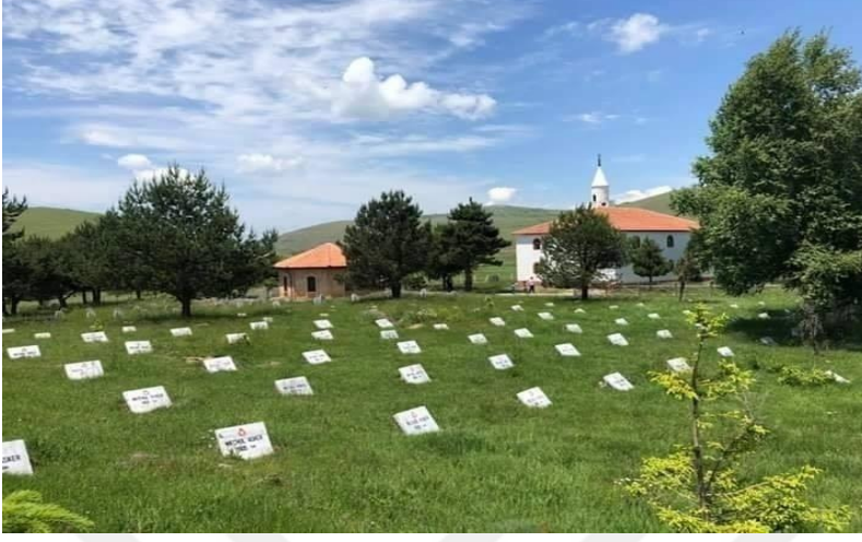
Resim- 1: Aybastı Perşembe Yaylası Dânişmendli Devleti ve Trabzon Rum Devleti'nin Savaş Yaptığı Alan