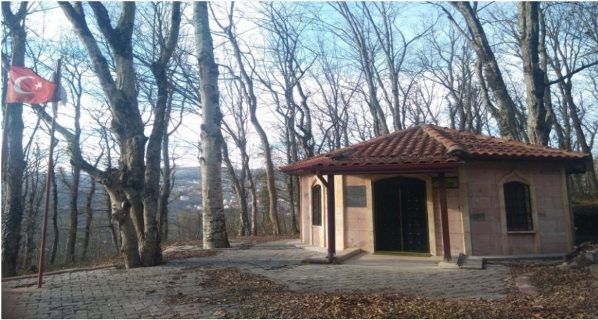
Resim- 13: Kutlu Doğmuş Türbesi - Aybastı