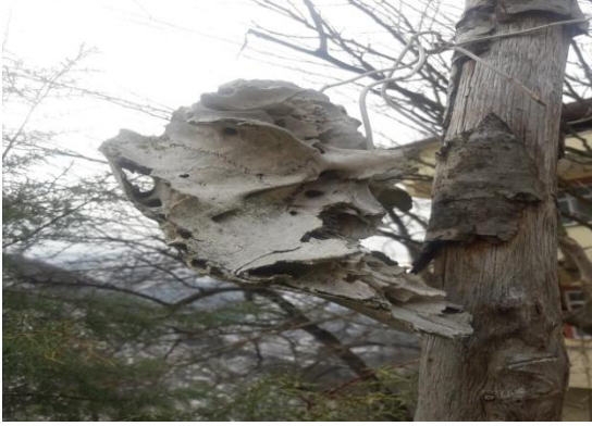
Resim- 2: Nazarlık olarak kullanılan kafatası (Bu fotoğraf Gürgentepe Muratçık Mahallesinde çekilmiştir.)