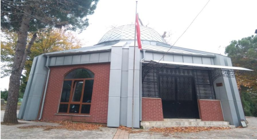
Resim- 16: Yunus Emre Türbesi - Ünye