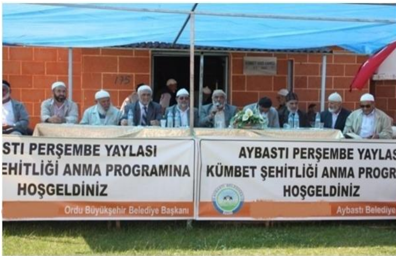
Resim- 11: Perşembe Yaylası Sahra Daveti - Aybastı