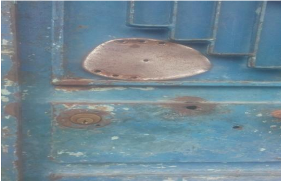
Resim- 2: Nazarlık olarak kullanılan at nalı (Bu fotoğraf Aybastı Armutlu Mahallesinde çekilmiştir.)