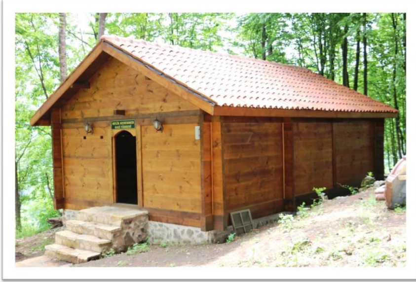
Resim- 15: Tuzak Türbesi - Akkuş