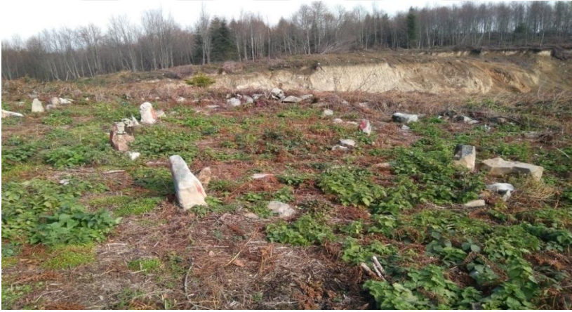
Resim- 10: Çitlice Akıncı Mezarlığı - Korgan