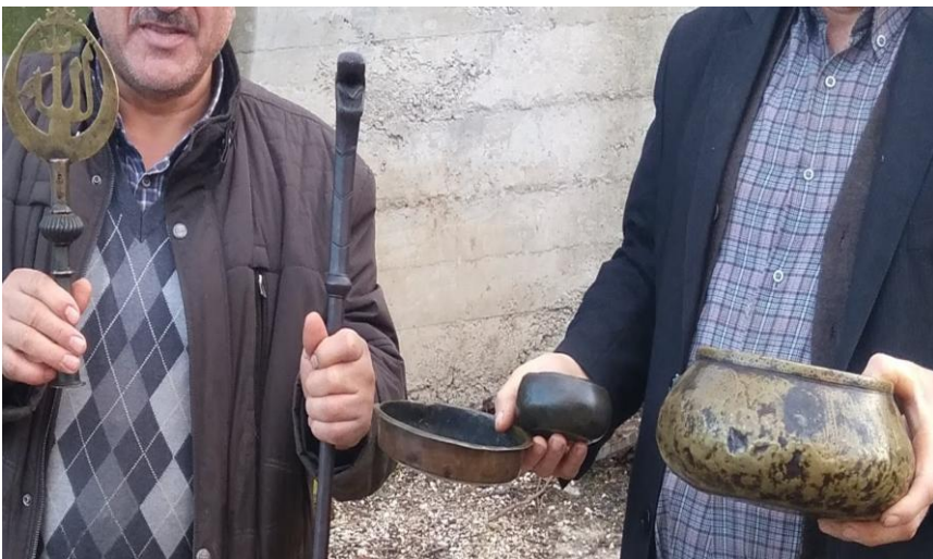
Resim- 19: Kuzköy Şidlü Dede'den Kalan Eşyalar - Kabataş