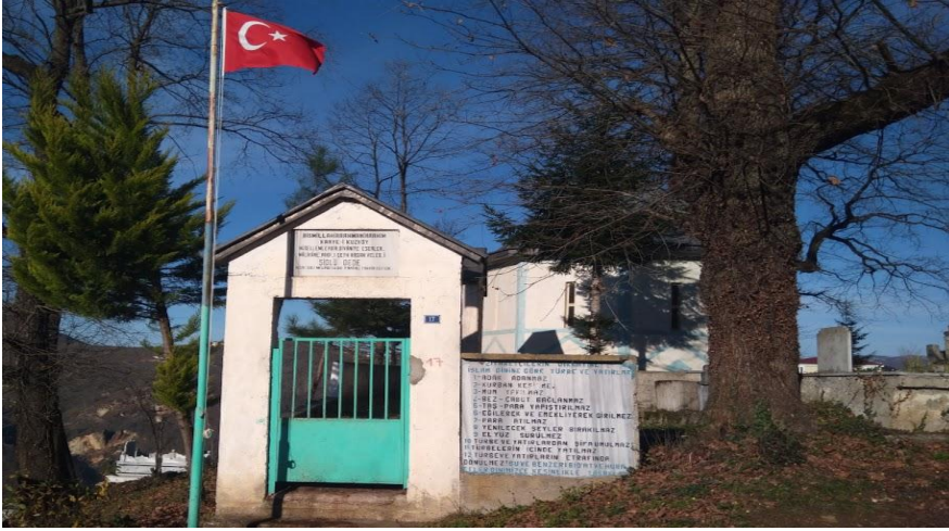
Resim- 17: Şid Abdal Türbesi (Şidlü Dede) - Kabataş