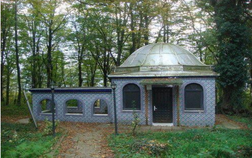
Resim- 18: Şeyh Abdullah Türbesi – Ulubey