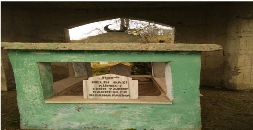
Resim- 14: Emîr Yakub Türbesi - Korgan