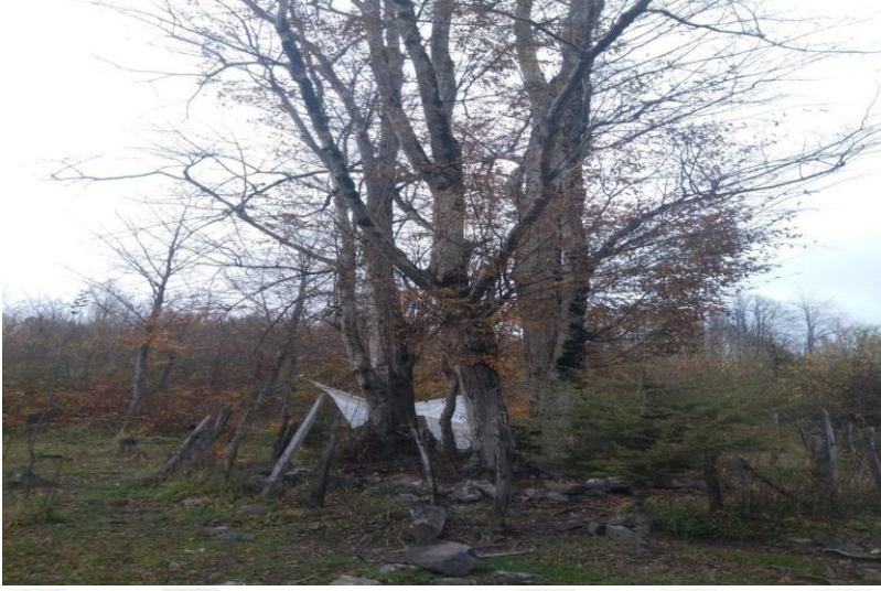
Resim- 9: Çiftlik Durak Evliyası – Korgan