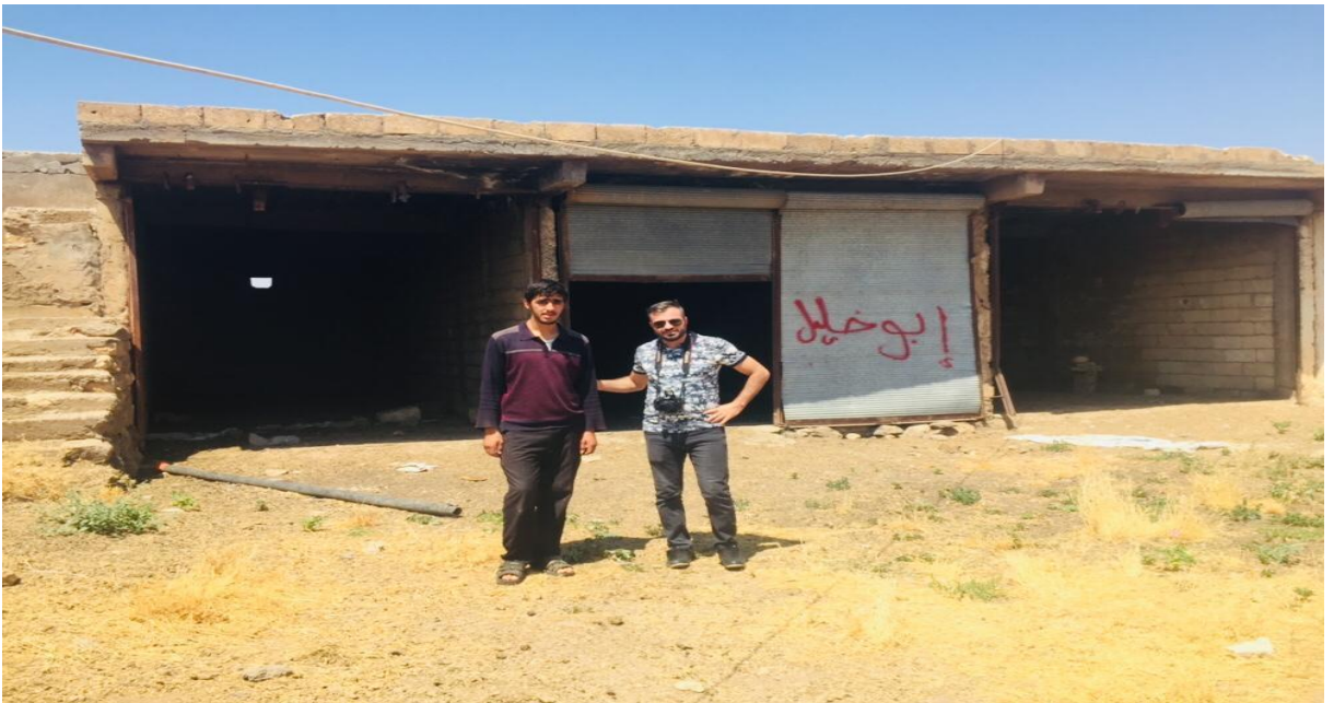
26. Fındık köyünden bir kare