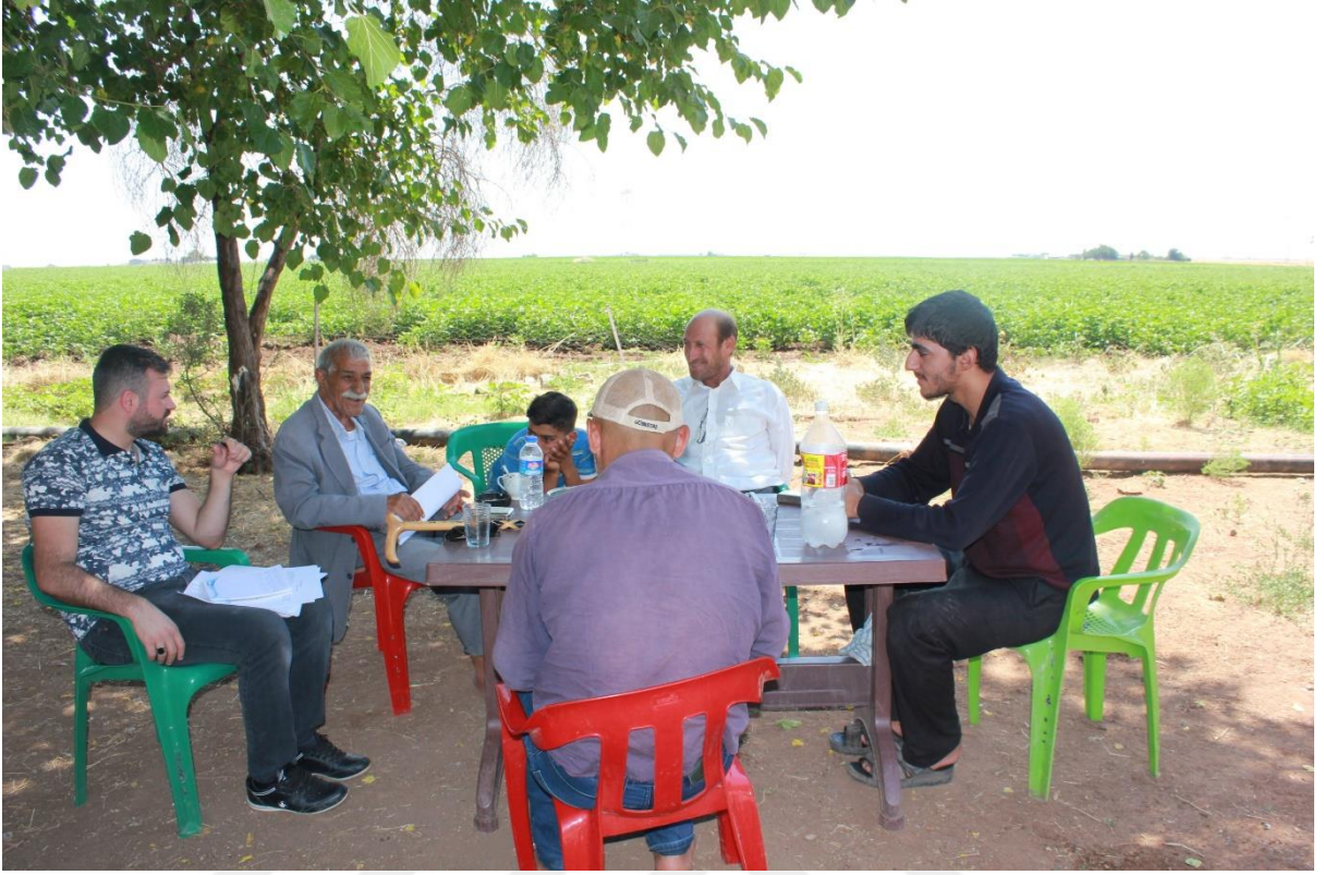
23. Fındık Köyünden bir kare (Mürit ve Müslüman Kirveleri)