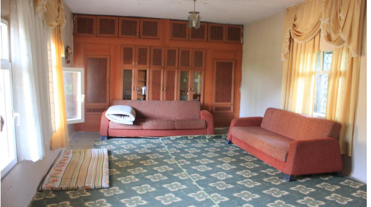
13. Bozca köyünde bulunan bir misafir odasında görüntü.