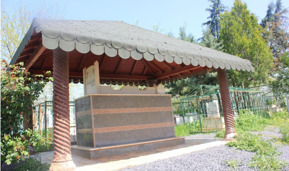
2.Burç köyü Hindistan'daki mezarlıklardan esinlenerek yapılan Yezidi mezarı.