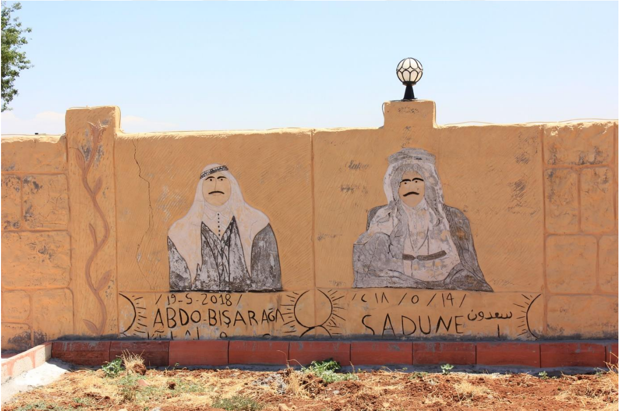
9. Ölen Yazidinin evin avlu duvarına resmedilişi.