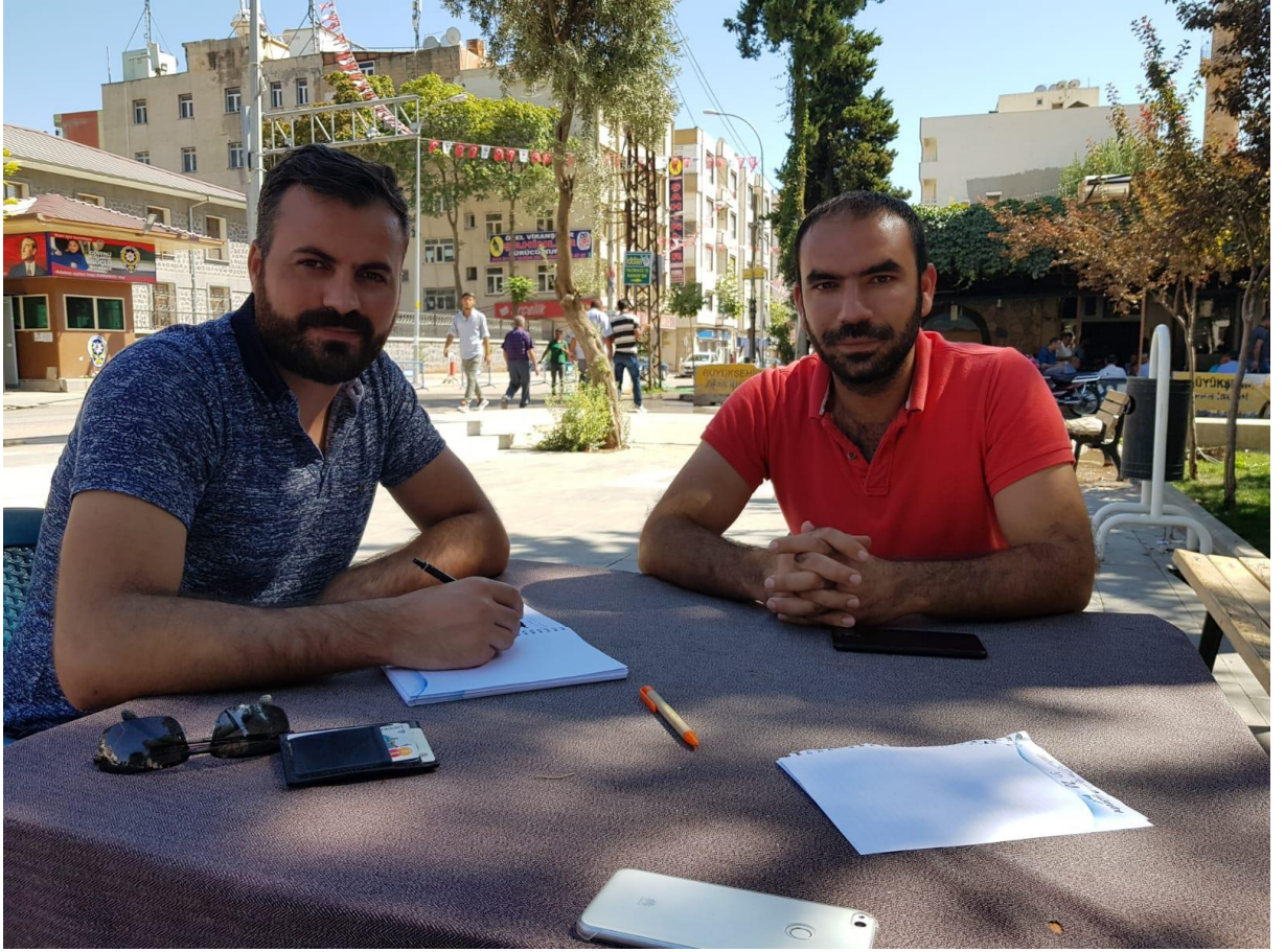
20. Viranşehir, şehir merkezinden bir görüntü (Mürüt)