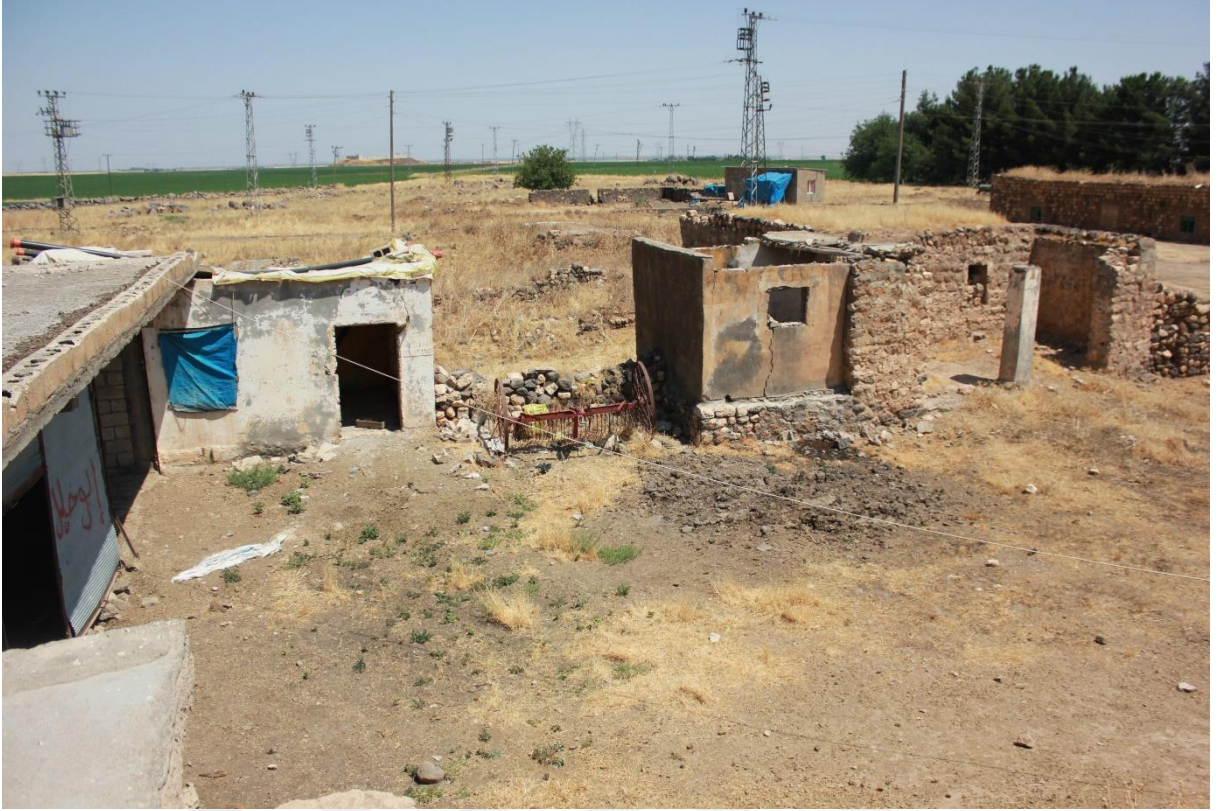
25. Fındık köyü Harabe olmuş evler