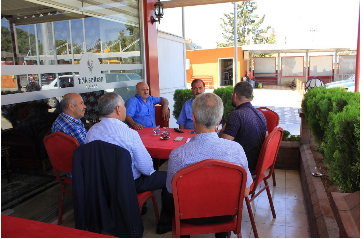
7. Viranşehir ilçesinde bir görüntü (Hepsi Mürit).