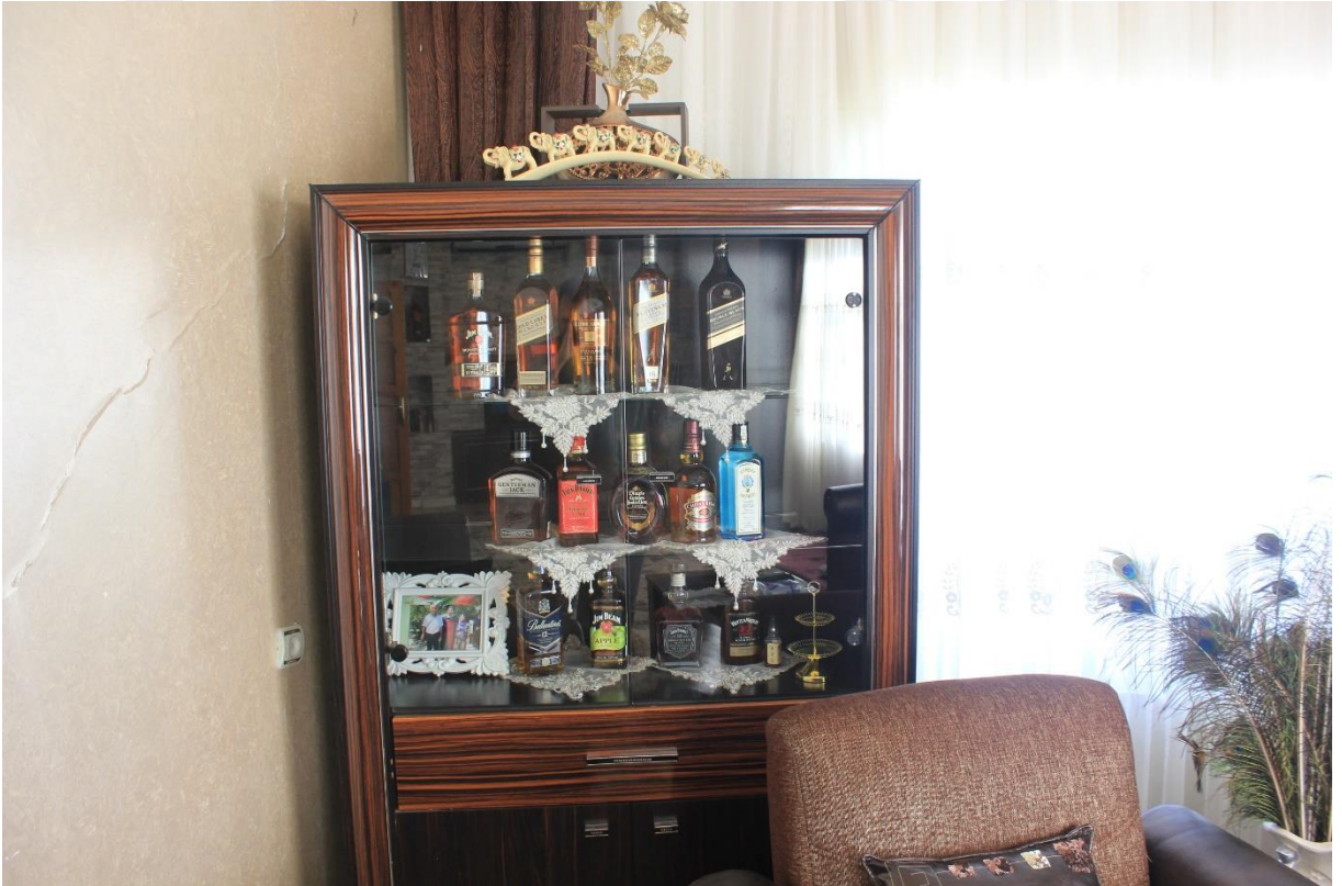
11. Yezidilerin evindeki Őarap kŐesi