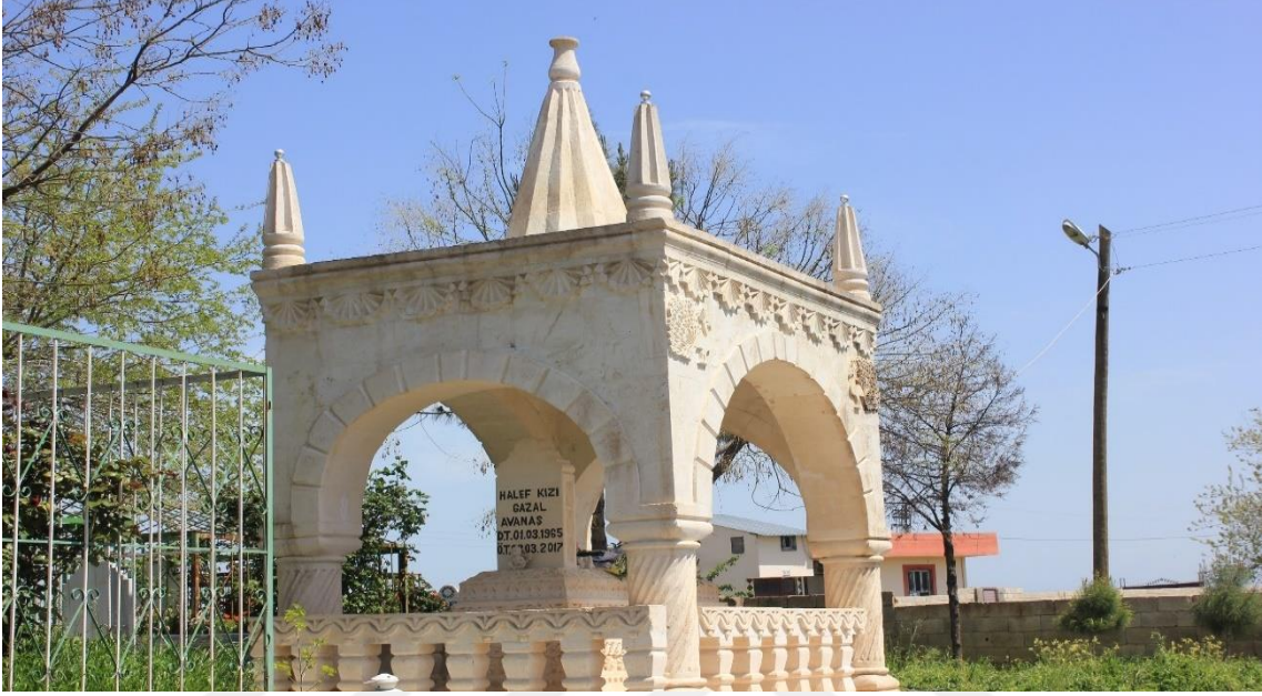
1.Burç köyü Irak laleş'teki 'Adi b. Müsafir' in mezar kubbesinden esinlenerek yapılan Yezidi mezarı