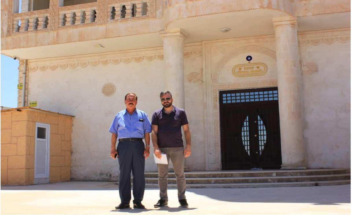
8. Kâtip Yüksel Konağından bir görüntü.