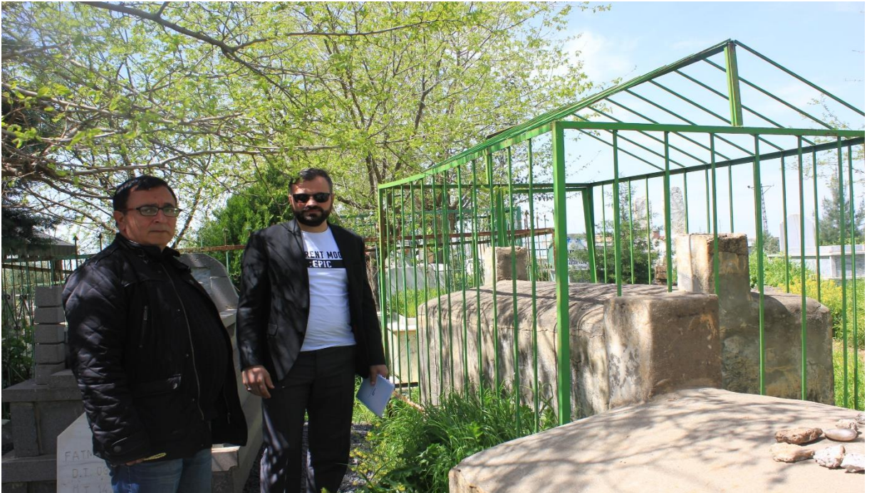
19. Burç köyü eski mezarlığından bir kare (Mürit)