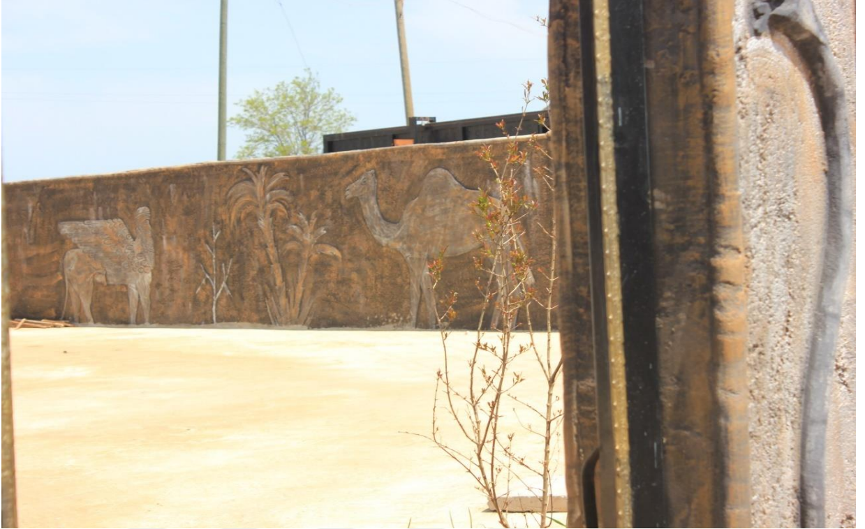
5. Burç köyünden bir evin bahçesi.