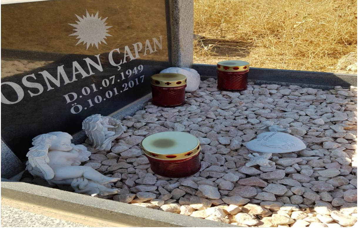
3. Avrupa'ya göç eden Yezidilerin Hristiyanlardan esinlenerek mezar üstünde mum yakması.