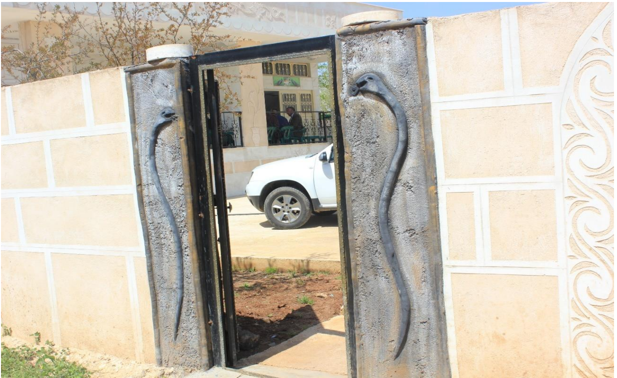
6. Burç köyü laleş kapısından esinlenerek yapılan Yezidi evinin kapısı.