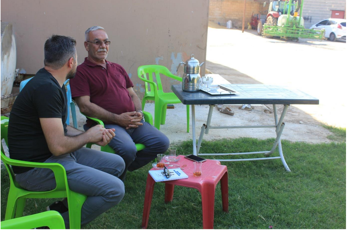
12. Bozca köyünden bir görüntü (Mürit)