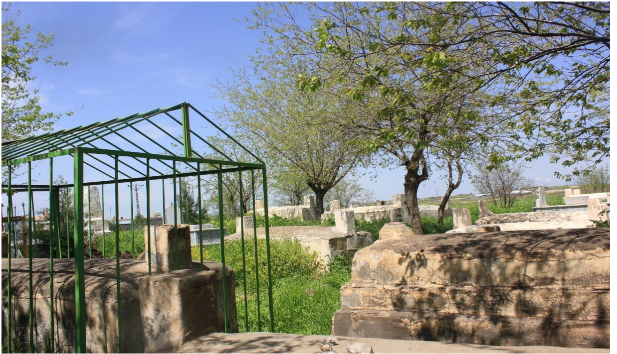
4. Yezidilerin eski yapı mezarlıkları.