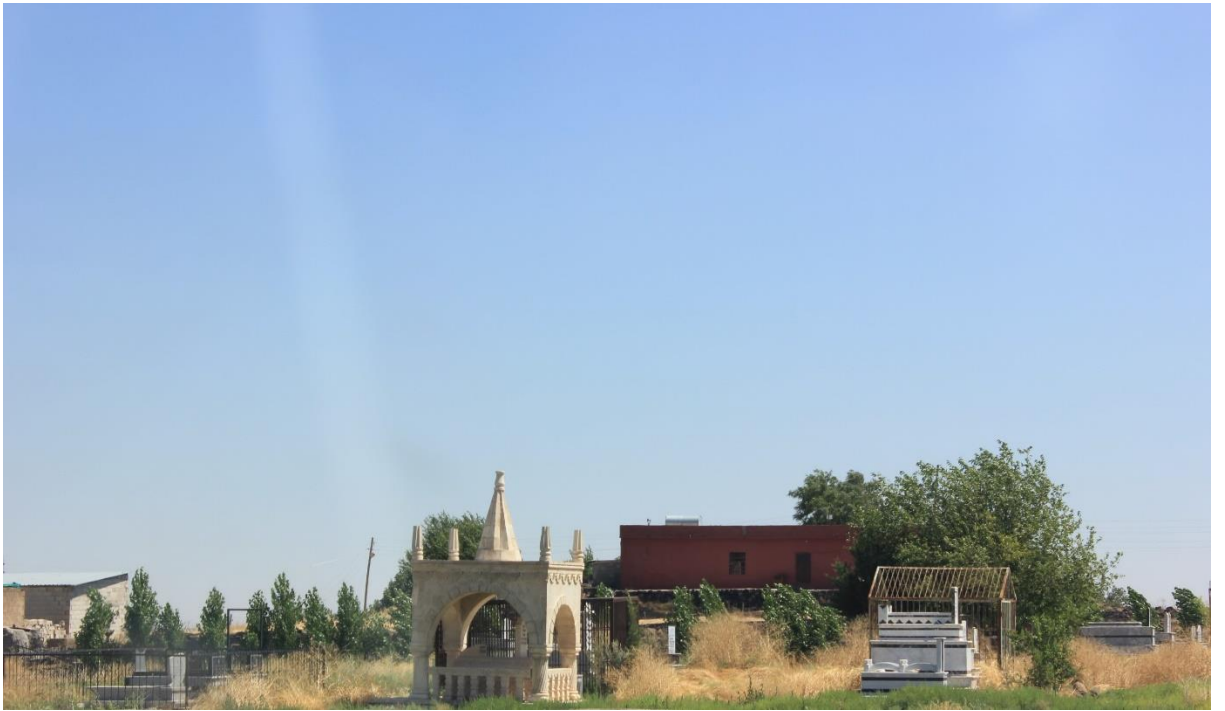
15. Aşağı Şölenli köyü ve mezarlığı