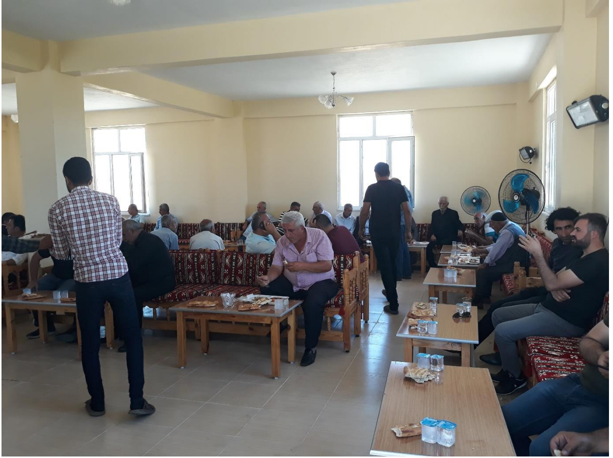
16. Yezidilerin Taziye evinden bir görüntü