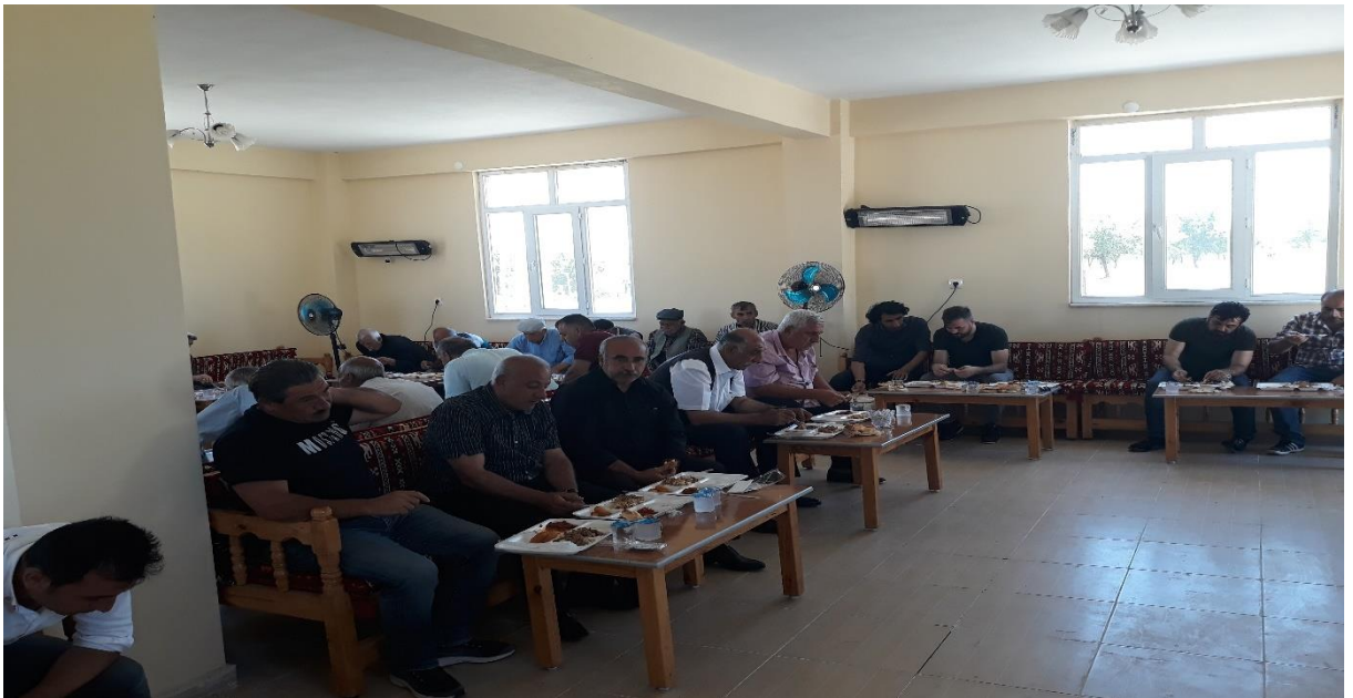
17. Yezidilerin taziye evinde ölü için verilen yemek