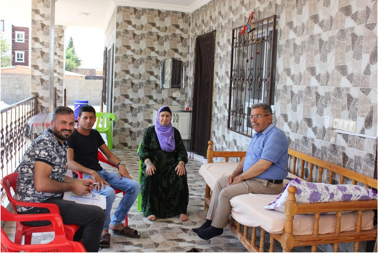
22. Burç Köyü muhtarı ve eşiyile bir kare (Mürit)