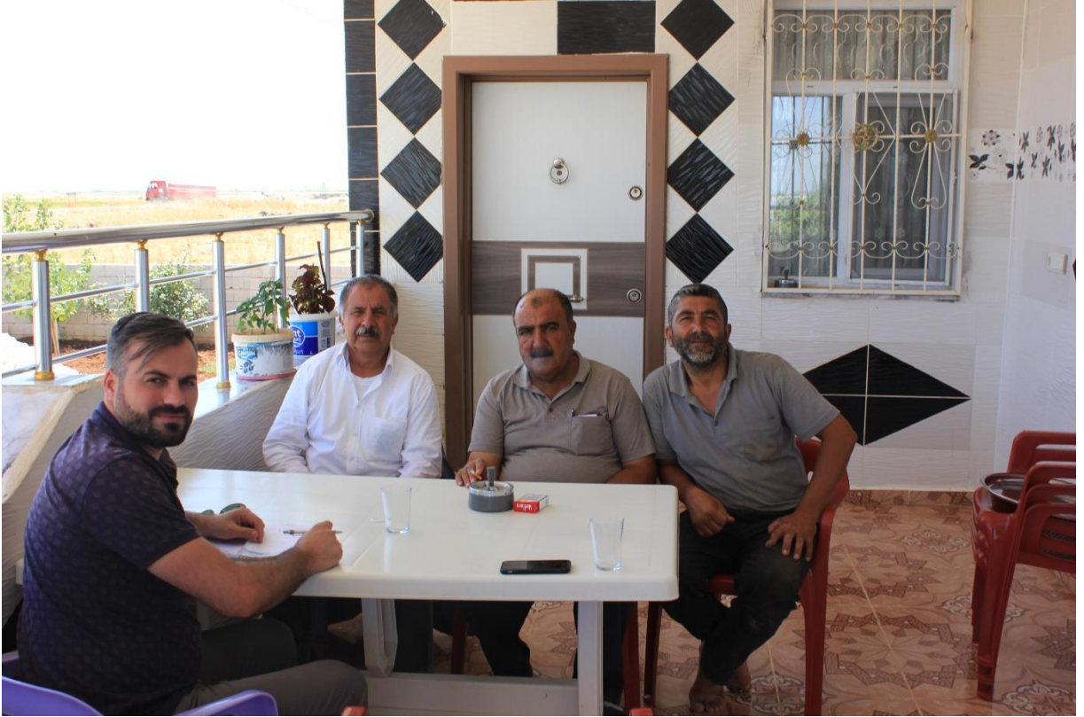
10. Bur kynden bir grnt,