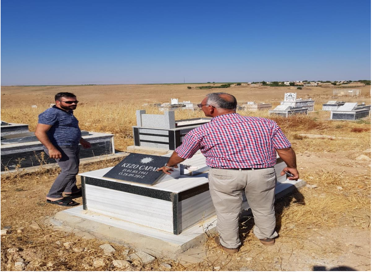
18. Bozca köyü mezarlığından bir kare (Mürit)