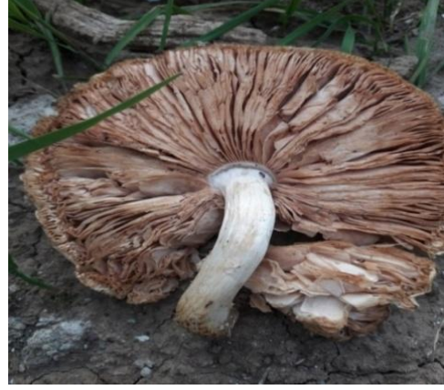
Şekil 4.32. Pluteus cervinus 'nın bazidiyokarları