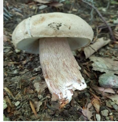
Şekil 4.8. Amanita rubescens 'in bazidiyokarları