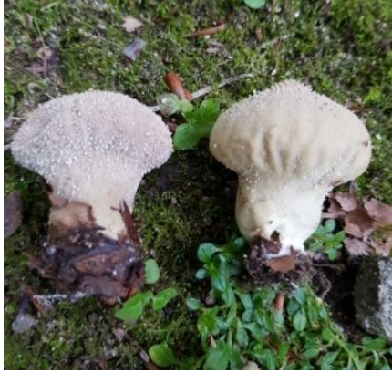
Şekil 4.3. Lycoperdon perlatum 'un bazidiyokarları