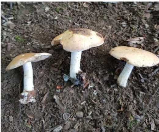
Şekil 4.17. Entoloma abbreviatipes 'un bazidiyokarları