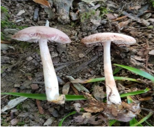
Şekil 4.19. Mycena rosa 'nın bazidiyokarları