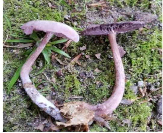
Şekil 4.26. Laccaria amethystina 'nın bazidiyokarları