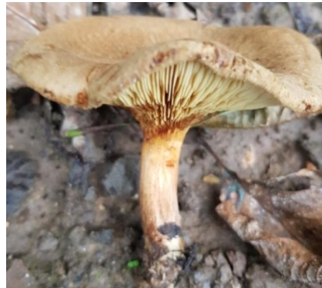
Şekil 4.30. Paxina involutus 'un bazidiyokarları