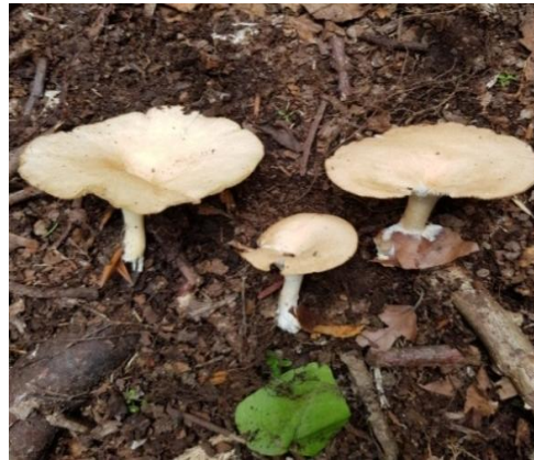
Şekil 4.48. Clitocybe phyllophila 'nın bazidiyokarları