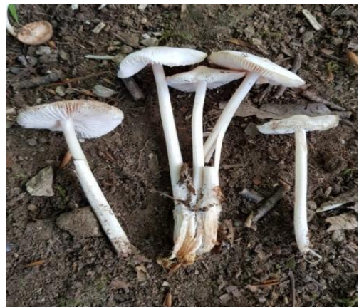
Şekil 4.18. Mycena pura 'nın bazidiyokarları