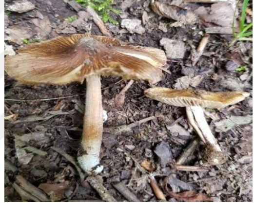
Şekil 4.28. Inocybe fastigiata 'nın bazidiyokarları