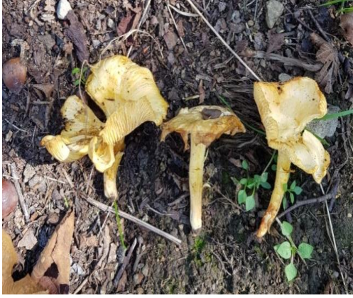
Şekil 4.21. Cantharellus cibarius 'un bazidiyokarları