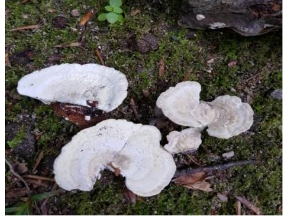
Şekil 4.20. Tyromyces caesius 'un bazidiyokarları