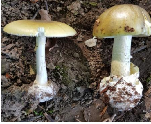
Şekil 4.5. Amanita daucipes 'in bazidiyokarları