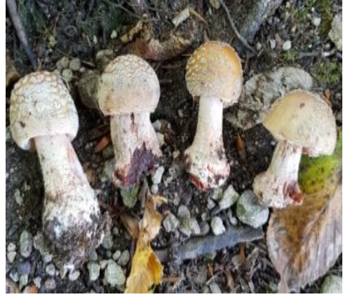
Şekil 4.6. Amanita pantherina 'nın bazidiyokarları