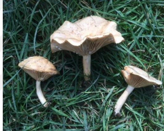
Şekil 4.34. Lactarius controversus 'in bazidiyokarları