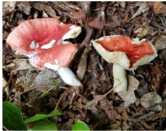
Şekil 4.42. Russula olivacea 'un bazidiyokarları