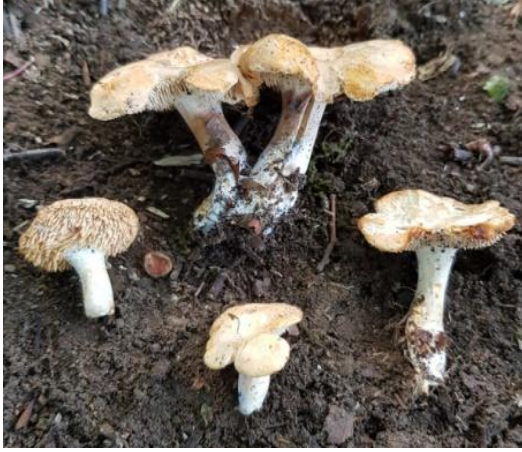
Şekil 4.25. Hydnum repandum 'un bazidiyokarları