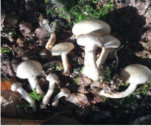
Şekil 4.45. Pholiota adiposa 'un bazidiyokarları