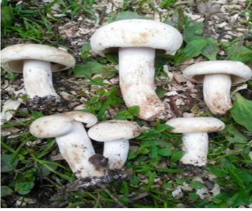
Şekil 4.39. Russula erythropus 'in bazidiyokarları