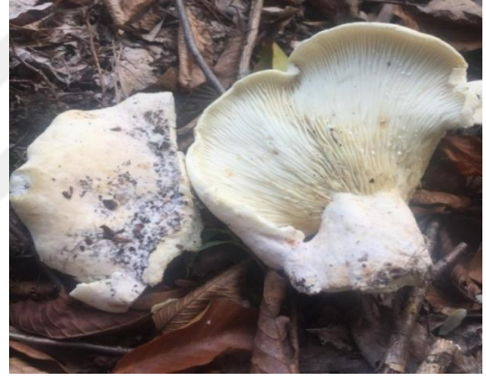
Şekil 4.22. Lactarius resimus 'un bazidiyokarları