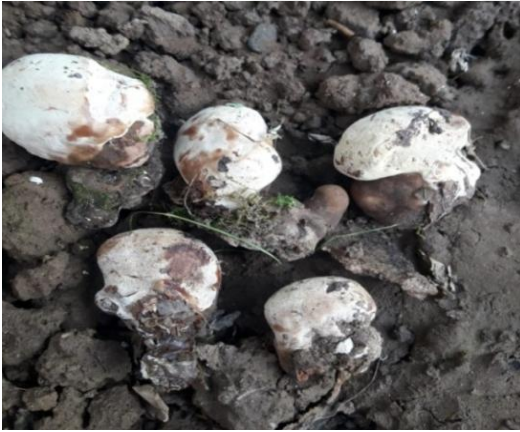
Şekil 4.15. Gonoderma lucidium 'nın bazidiyokarları