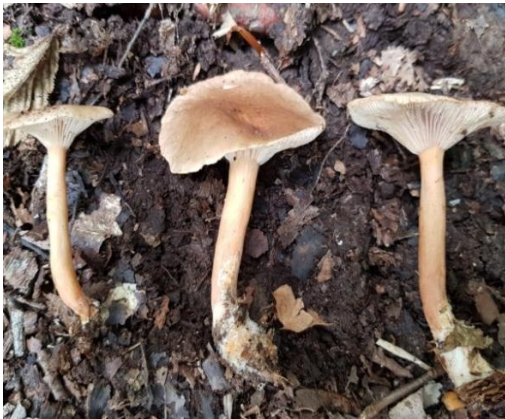
Şekil 4.47. Clitocybe infundibuliformis 'in bazidiyokarları