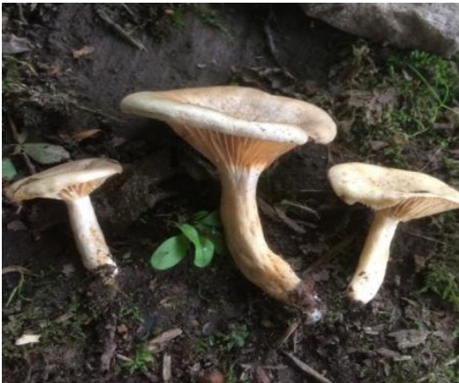
Şekil 4.35. Lactarius fulvissimus 'nın bazidiyokarları