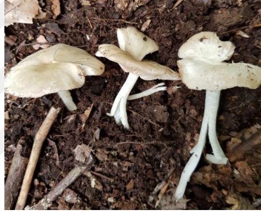
Şekil 4.46. Psathyrella candolleana 'un bazidiyokarları