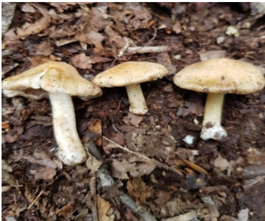
Şekil 4.29. Inocybe lacera 'nın bazidiyokarları