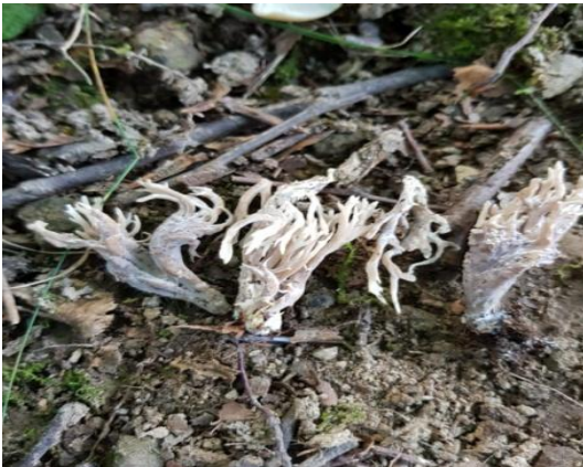
Şekil 4.23. Clavulina sinerea 'nin bazidiyokarları