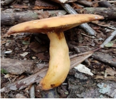
Şekil 4.37. Lactarius volemus ' un bazidiyokarları