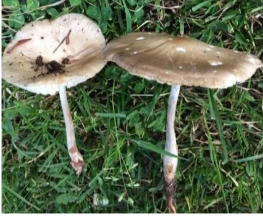
Şekil 4.31. Xerula radicata 'in bazidiyokarları