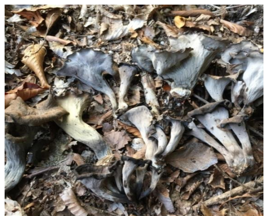
Şekil 4.24. Cantharellus cornicopioides 'in bazidiyokarları