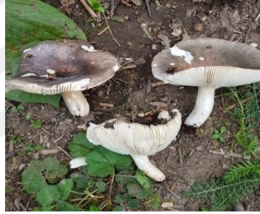
Şekil 4.40. Russula firmula 'nın bazidiyokarları