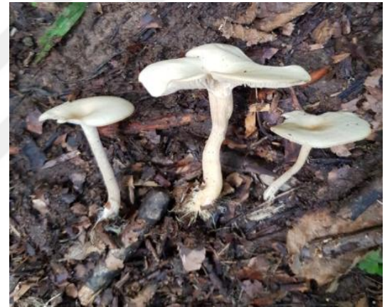
Şekil 4.16. Gymnopus dryophilus 'nın bazidiyokarları