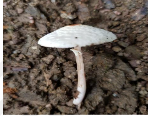
Şekil 4.2. Lepiota cristata 'nın bazidiyokarları