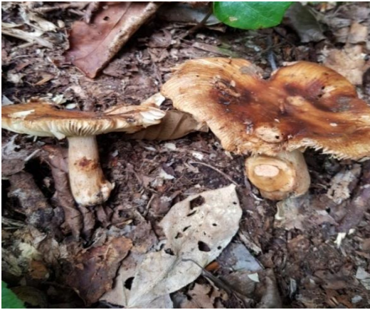
Şekil 4.41. Russula foetens 'in bazidiyokarları