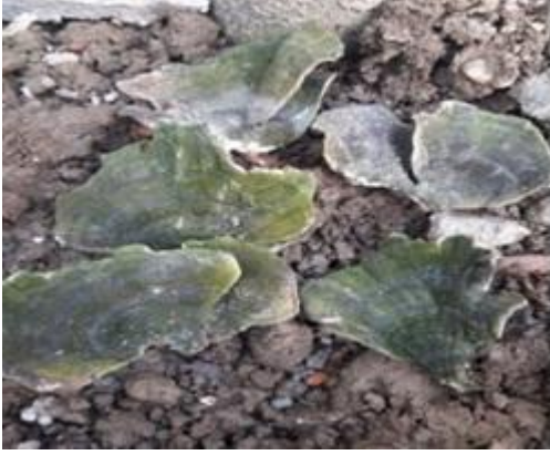
Şekil 4.43. Stereum hirsutum 'un bazidiyokarları