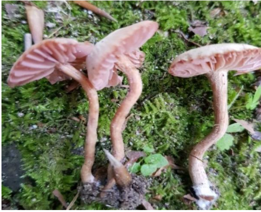
Şekil 4.27. Laccaria laccata 'nın bazidiyokarları