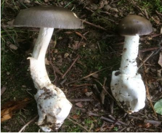
Şekil 4.7. Amanita phalloides 'in bazidiyokarları