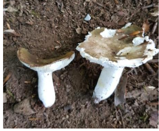
Şekil 4.38. Russula alnetorum ' un bazidiyokarları