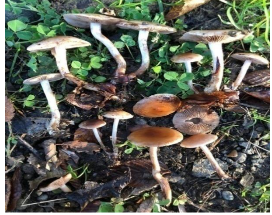
Şekil 4.14. Cortinarius arellanus 'ın bazidiyokarları