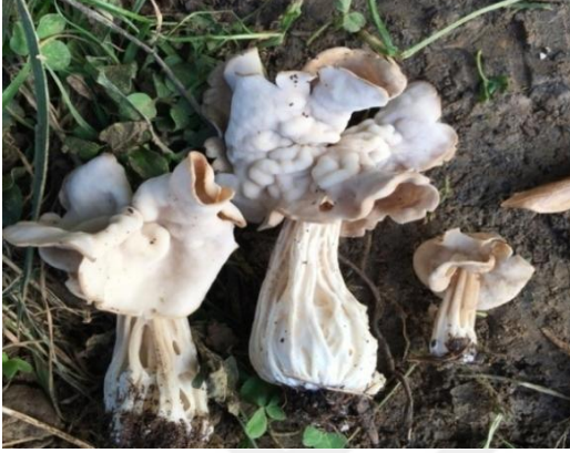
Şekil 4.1. Helvella lacunosa 'nın askokarları

Samsun-Çarşamba-Salıpazarı, ormanlık alan, 41° 06'36"N, 36°46'30"E 75 m. 20.05.2019. MRT-126; Samsun-Çarşamba-Salıpazarı, ormanlık alan, 41° 06'22"N, 36°46'30"E 69 m. 20.05.2019. MRT-207. (Şekil 4.2.48.).