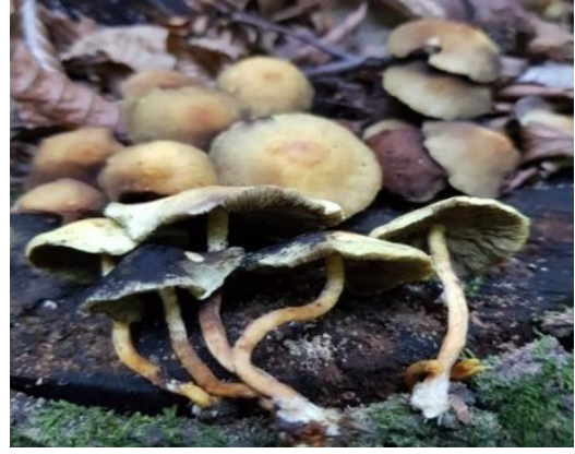
Şekil 4.44. Hpholoma fasciculare 'ın bazidiyokarları