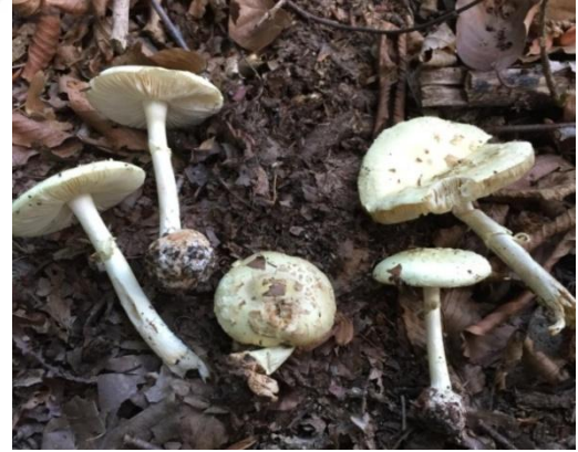
Şekil 4.4. Amanita citrina 'nin bazidiyokarları