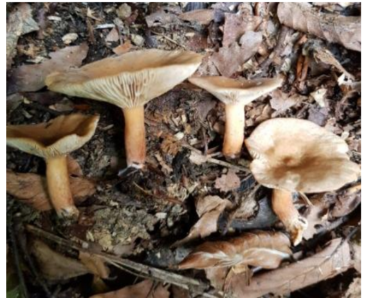
Şekil 4.36. Lactarius pyrogallus 'un bazidiyokarları