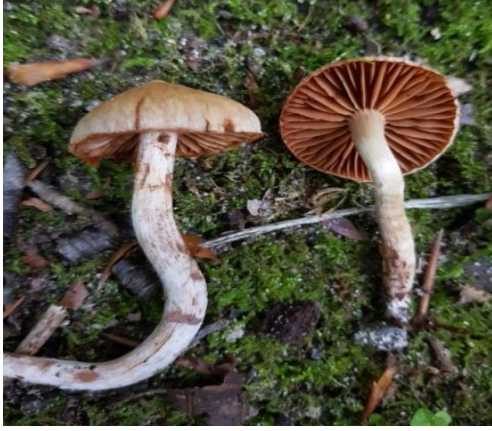
Şekil 4.13. . Cortinarius aavea 'nın bazidiyokarları