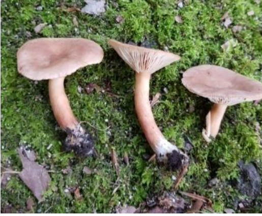
Şekil 4.33. Lactarius aurantiacus 'nın bazidiyokarları