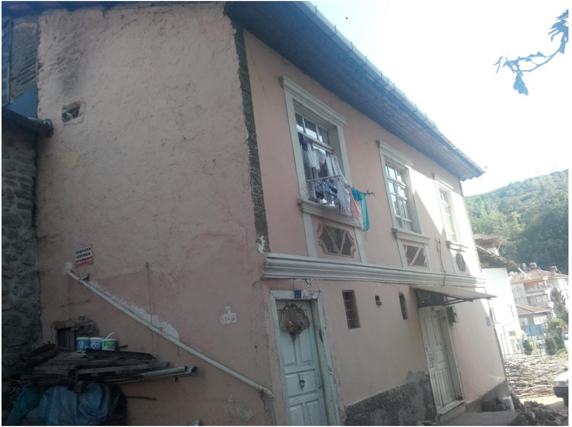
Şekil 5.2. Tokat evinin dıştan görünümü

Tokat'taki geleneksel konut örneklerinin neredeyse tamamının inşa tarihi belli değildir. Konaklarda inşa tarihini gösteren bilgi ya da belge olmadığında kesin bir tarih vermek oldukça zordur (İbrahimzade ve Atak, 2010). Tokat Evleri genellikle iki katlıdır. Her iki kat arasında bir ara kat yer alır. Zemin katta bir taşlık, iş evi, kiler, odunluk gibi mekânlar bulunmaktadır. Bir veya iki odalı ara kat daha basıktır ve kışın oturmak için kullanılmaktadır. İnşa malzemesi olarak ahşap çatkı arası kerpiç dolgu kullanılmaktadır (Çal, 1988).