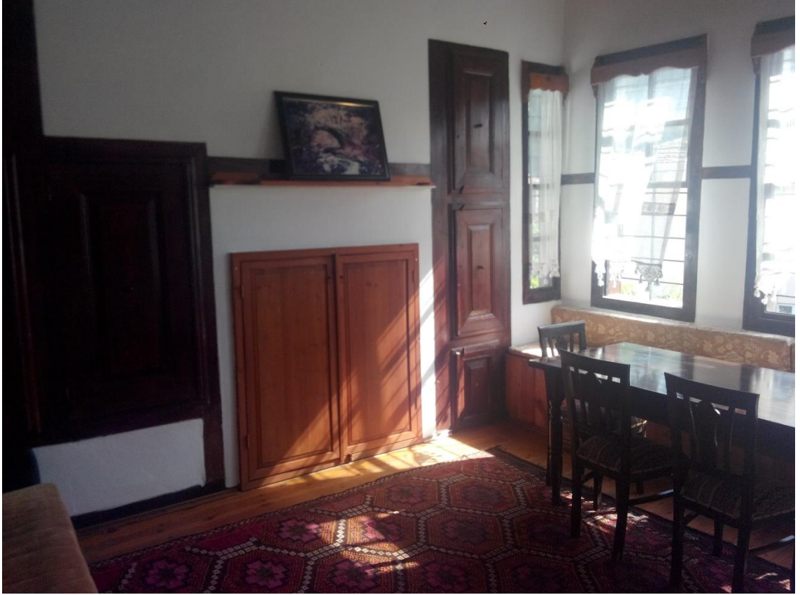
Şekil 5.1. Tokat evinin iç görüntüsü

Tokat kent merkezinde başta Soğukpınar, Devegörmez, Hoca Ahmet, Ali Paşa ve Kabe-i Mescit mahallelerinde olmak üzere tescilli ve tescili yapılmamış birçok özgün geleneksel konut bulunmaktadır (Akın ve Hanoğlu, 2013).