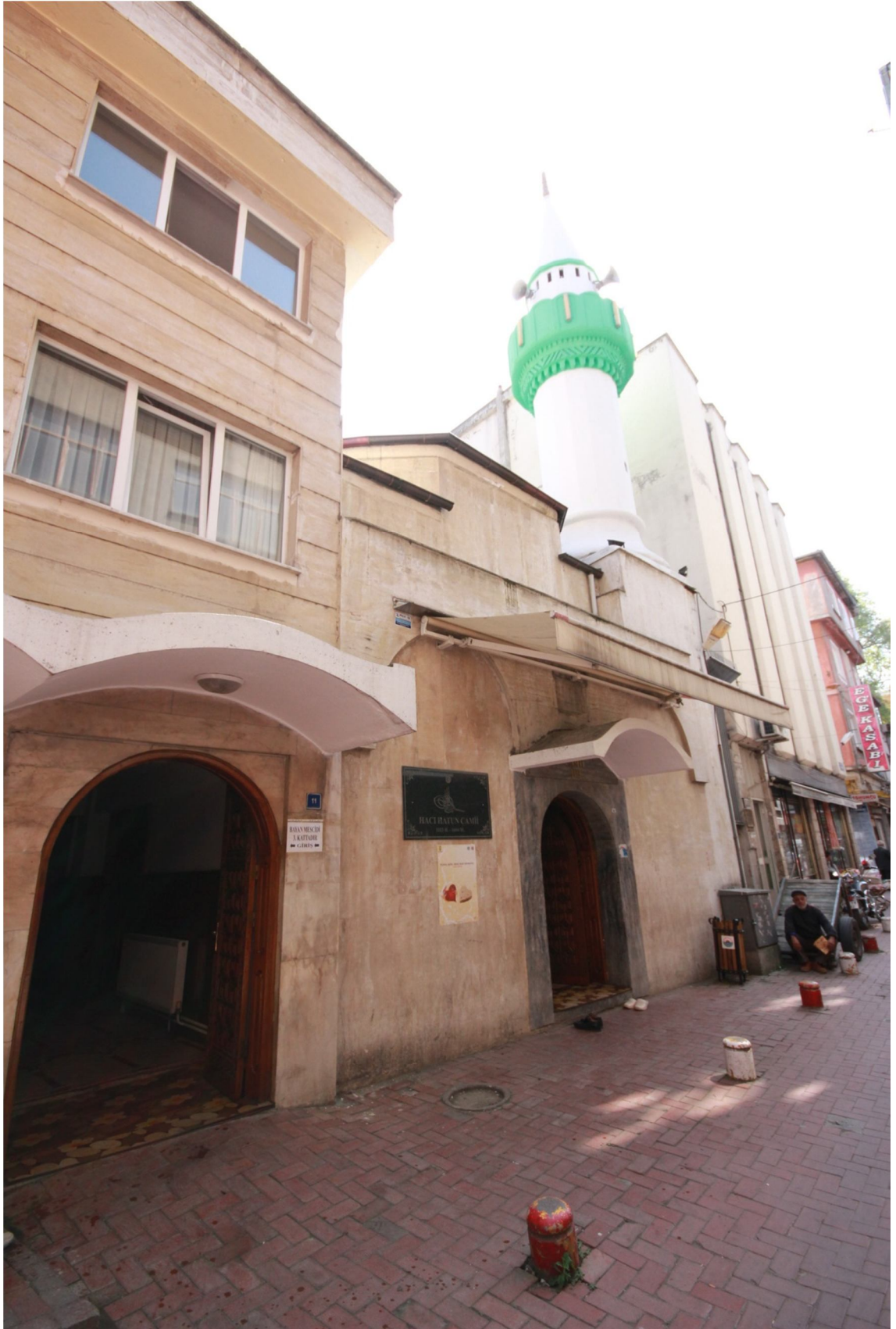
Şekil 11: Hacı Hatun Camii Dıştan Görünüm