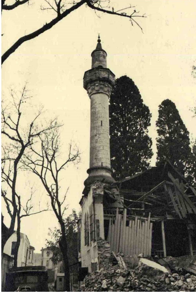
Fotoğraf 7: Hançerli Camii 1943 Samsun Depreminden Sonra