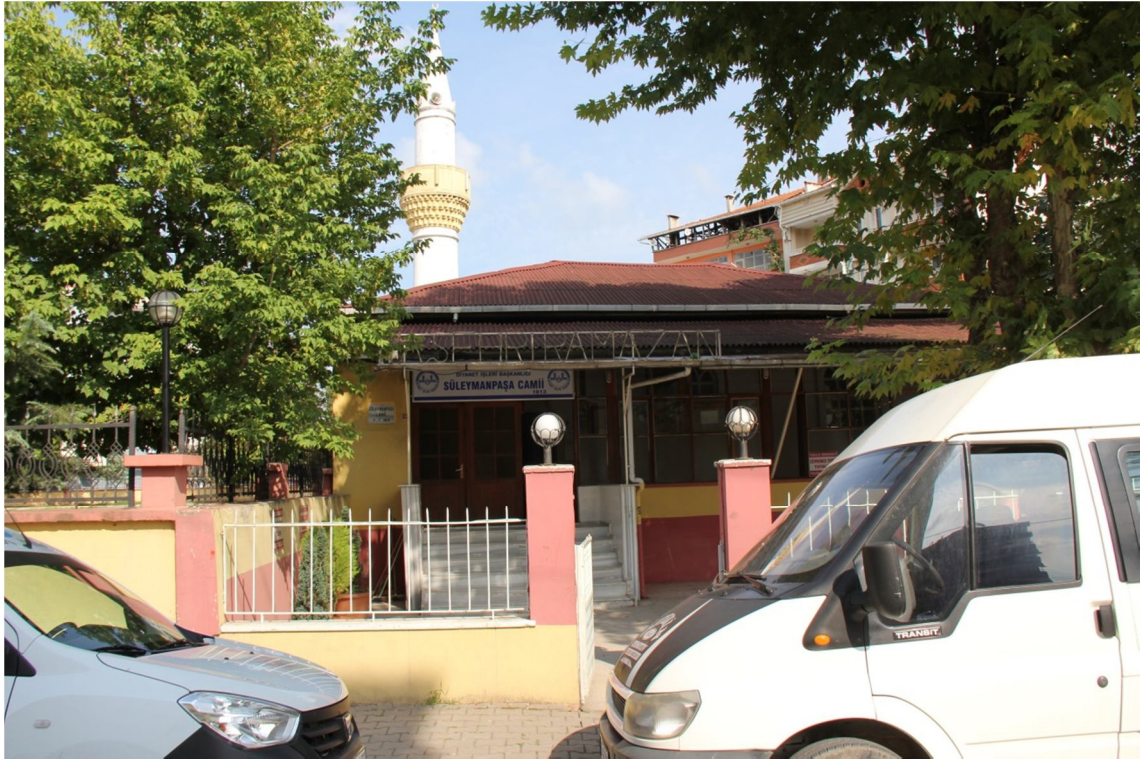
Fotoğraf 26: Çarşamba Hazinedârzâde Süleyman Paşa Camii Önden Görünüm

Bu camii günümüzde hizmet vermeye devam etmektedir. Medrese ve kütüphane ise mevcut değildir. Caminin bitişiğinde bir okul olması, medresenin yıkıldıktan sonra Cumhuriyet döneminde okul yapıldığını düşündürmektedir.