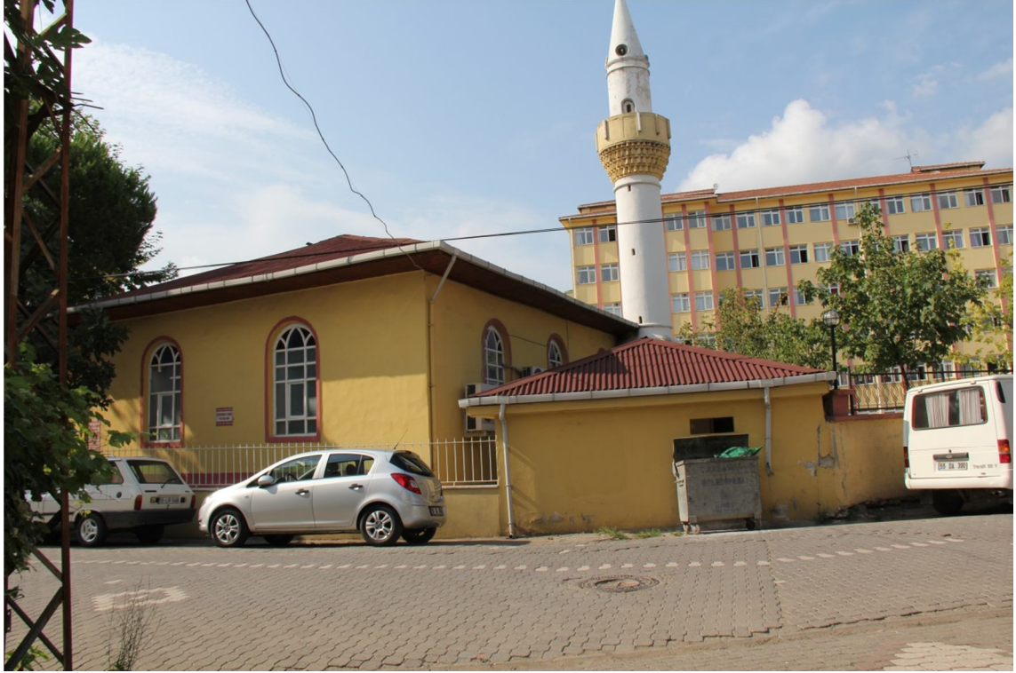
Fotoğraf 27: Çarşamba Hazinedârzâde Süleyman Paşa Camii Yandan Görünüm