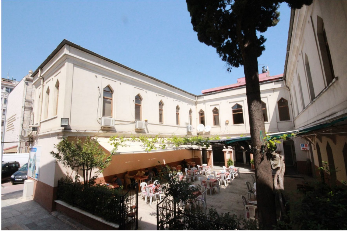
Fotoğraf 24: Hazinedârzâde Süleyman Paşa Medresesi Dıştan Görünüm