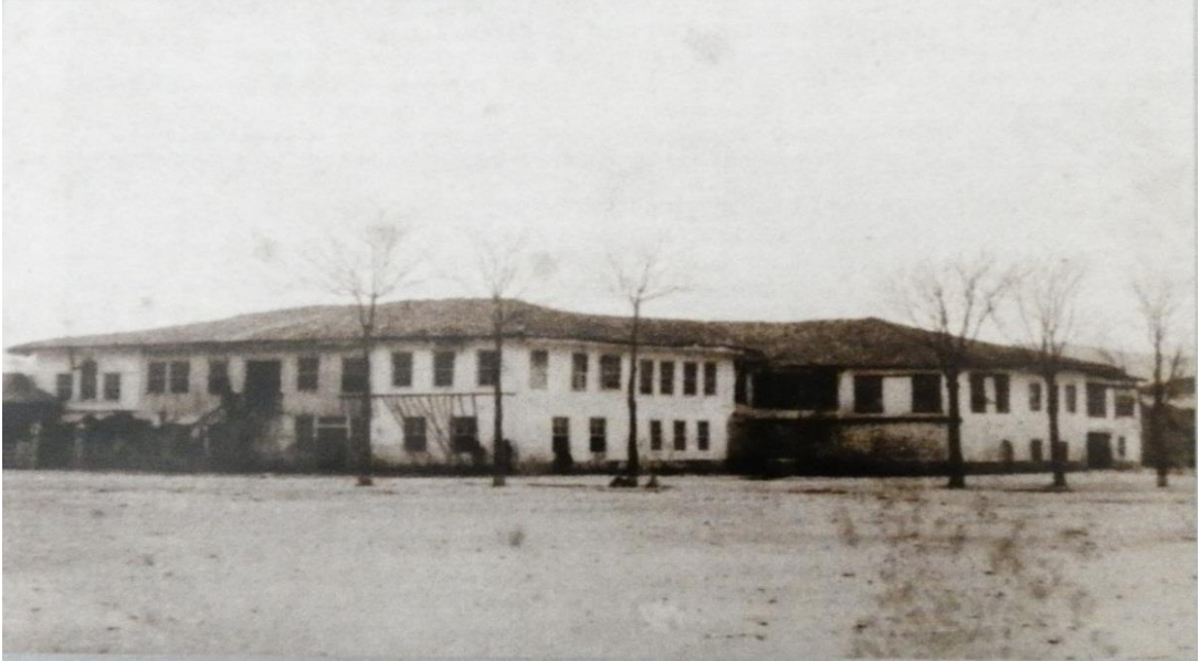
Şekil 1: İşkodra Hükümet Konağı 495 .

buluntulara rastlanması da şehrin tarihi geçmişi bakımından dikkate değerdir 491 . İllirya ile Romalılar arasındaki mücadeleler ardından M.Ö. 229 yılında Romalılar İşkodra'yı işgal ederler. Roma İmparatorluğunun ikiye ayrılması ile İşkodra Bizans'ın payına düşer 492 . Bizans İmparatorluğu, İllirya devrinde önemli bir konuma sahip olan İşkodra'yı, Arnavutluk topraklarını idare etmek üzere Yeni Epir, Eski Epir, Prevalitan ve Dardania olarak ayırmış olduğu dört eyaletten 493 Prevalitan'ın merkezi yapmıştır. İşkodra bu konumunu IX. asra kadar korumuş, bu tarihten sonra Draç şehri lehine gerçekleşen siyasi ve ekonomik gelişmeler ile eski önemini yitirmiştir 494 .