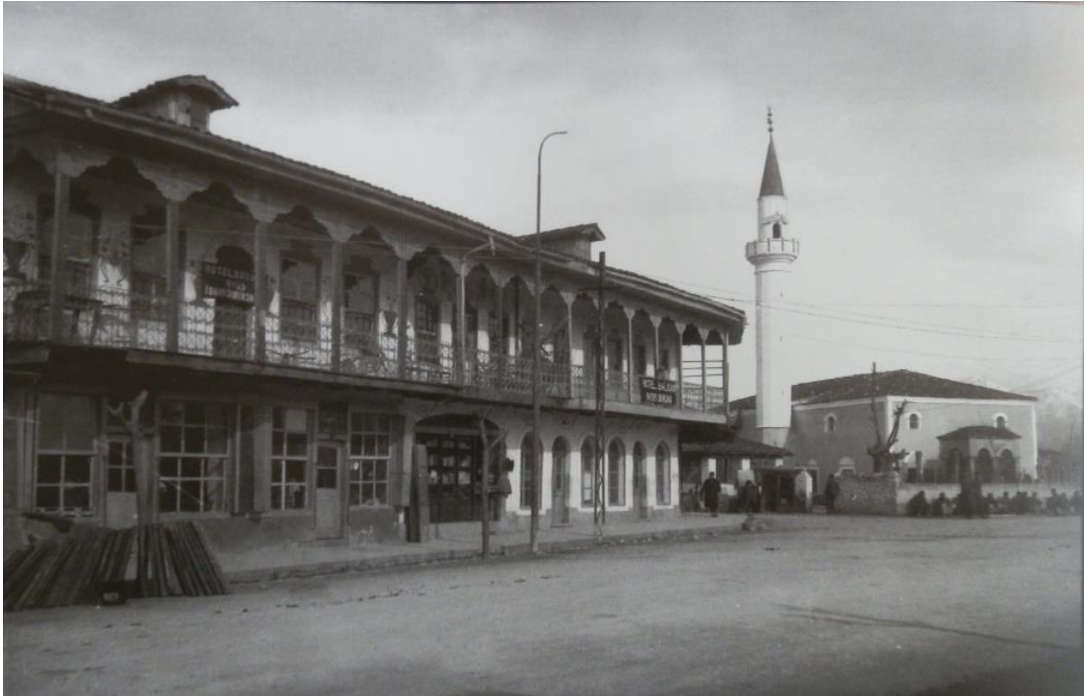
Şekil 6: İşkodra Paruse Meydanı, Otel Kosova ve Otel Balkan 1923 552 .

Memleket bahçesi ile hükümet binasının bulunduğu yerin köşesinde konsoloshanelerin olduğu cadde yer almaktaydı. Burası aynı zamanda Müslüman ve Hristiyanlara ait mahallelerin de birleştiği yerd. Bu noktadan başlayarak Kir ovasına kadar uzayan “Fuschta Chocta” caddesi şehrin en işlek caddelerinden birisiydi. Bu caddede gün boyu turlar atan şehirli ve dağlı Arnavutları izlemek mümkündü. Müslümanlar tarafından işletilmekte olan birçok lokantanın bulunduğu caddede hanlar da vardı 551 .