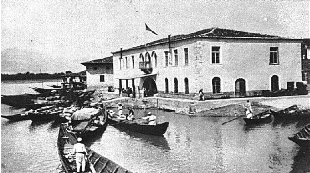
Şekil 2: Buyana Nehri Kenarındaki İşkodra Gümrüğü ve Londoralar 515 .

Şehrin hava sıcaklığı yazın nadiren 37 dereceye ulaşırken kış mevsimi aralıksız yağan yağmurlarla kasvetli bir hal almaktaydı 513 . İşkodra vilayetinin geneli engebeli arazilerden oluşmaktadır. En büyük dağı şehrin kuzey kısmında yer alan ve ahalinin "Maranay" dediği, Arnavutluk Alpleri veya İşkodra Dağlarıdır. Adı geçen dağ silsilesi İşkodra Gölünün kuzey batısından başlayarak Drin Nehrini izler ve Karadağ içlerine ve diğer kolları ile Yeni Pazar'a kadar gider 514 .