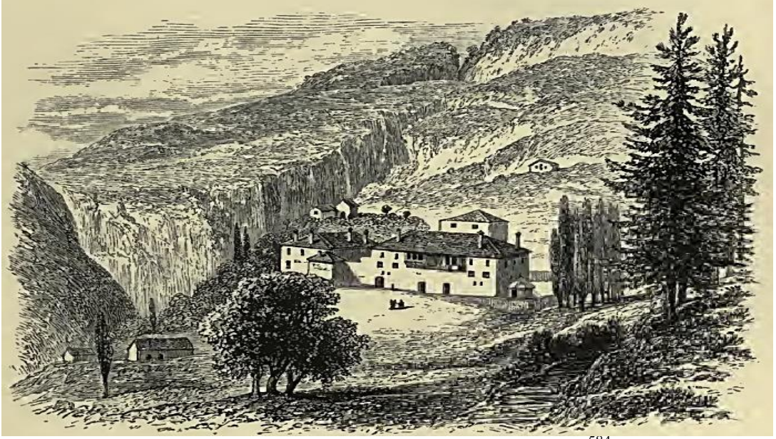
Şekil 7: Oroş'ta Bulunan Mirdita Prensine Ait Konak 584 .

Mirdita kazasında hükümet konağı ya da diğer bir idari yapı görünmemektedir. Ancak Mirdita prensinin Mirdita kazası merkezi konumunda olan Oroş koyünde bir konağı vardır 583 . Bu evin resmî haberleşmeler için kullanılmış olması muhtemeldir.