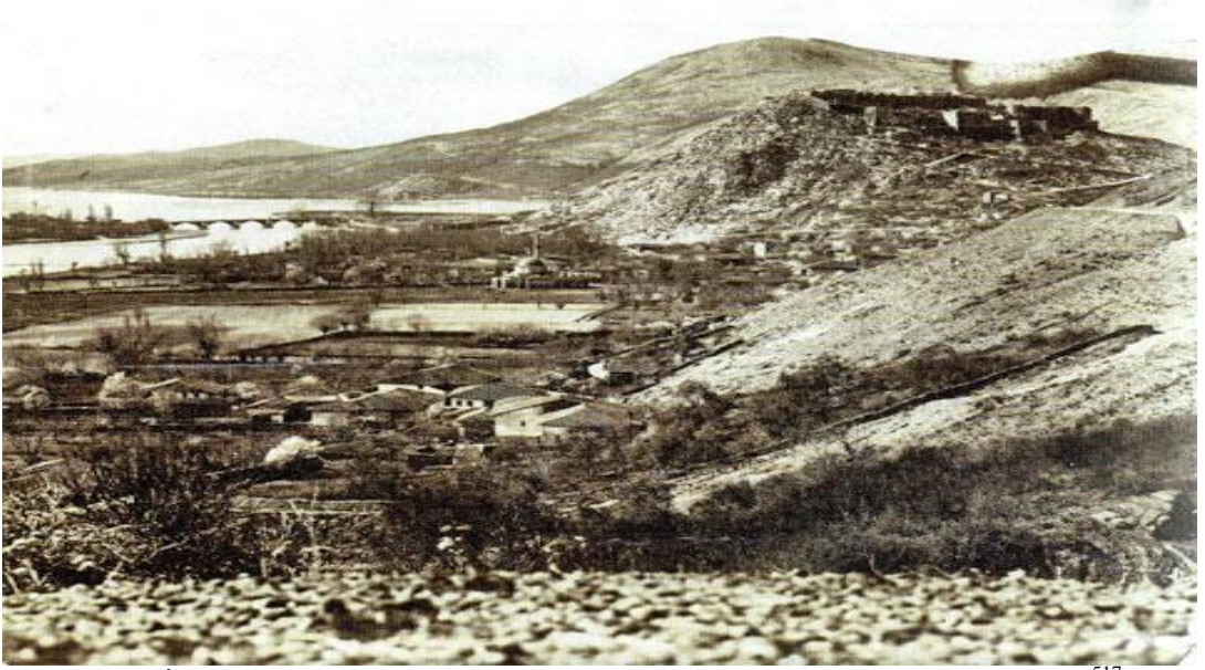
Şekil 3: İşkodra Kalesi, Tabak Mahallesi, Kurşunlu Camii ve Bahçalık Köprüsü 517 .

İşkodra şehri feth edildiğinde, kalenin güneyinde yer alan Hacı Resul (Kafe), Ali Bey, Bahçalık, Öteyaka, Ayazma, Tepe olmak üzere 6 mahalleden oluşuyordu. Fetih sonrası ormanlık ve çalılık alana doğru genişleyerek Tophane, Ruskebir, Praşzir, Nevçay, Paruçe, Russağir, Praşbala, Dodas mahalleleri kurulmuştur 516 .