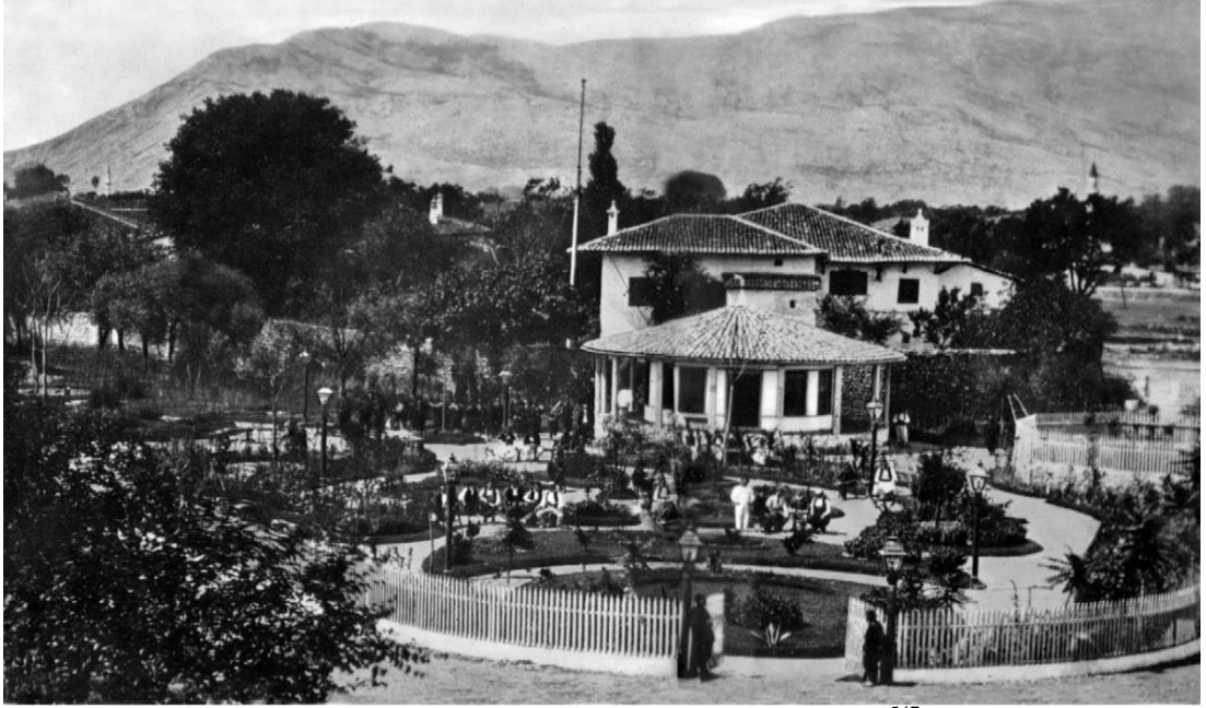
Şekil 5: İşkodra Belediye-Memleket Bahçesi 547 .

İşkodra'nın eski şehir alanı, İşkodra kalesinin eteğinde olup bir kısmı İşkodra gölü ve pazarına bakmaktaydı. Bu kısımdaki evlerin bazıları yarı harap vaziyetteydi. Şehre İşkodra ismi bu tepeye yerleşimin ardından verilmiştir 544 . Osmanlı fethinden sonra kurulan yeni şehirdeki çatıları alçak ve yayvan evlerin çevresi, mahremiyetine düşkün ahali tarafından yüksek duvarlar ile örülmüştü 545 . Evlerin çevresindeki duvarlar sebebiyle labirent halini almış sokakların bulunduğu yeni şehir, Türk şehir yapısı çerçevesinde oluşturulmuş bir şehir olarak, geceleri hiçbir sesin duyulmadığı, caddelerin bomboş ve sakin olduğu bir hal almıştı 546 .