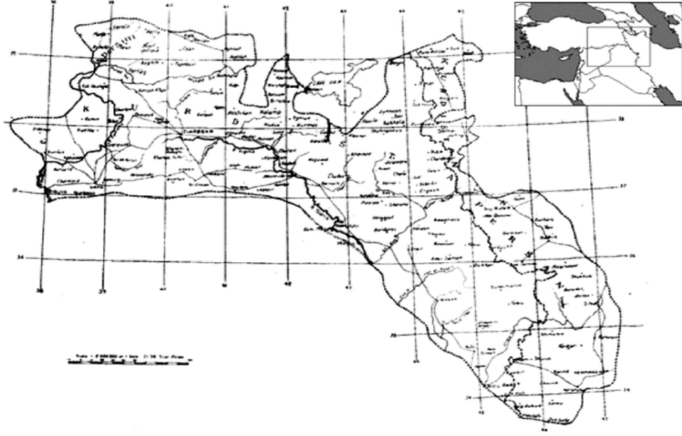
Harita 2: Şerif Paşa tarafından 1919'da düzenlenen Paris Barış Konferansı'na sunulan Kürdistan haritası. 494

Emin Ali Bedirhan, Kürdistan'ın kuzey sınırlarını kapsamadığından dolayı bu haritaya itiraz etmiş 495 ve 1920 yılında İngiltere Yüksek Komiserliği'ne vermiş olduğu haritada Kürdistan'ın sınırlarını Van'ı da içine alacak şekilde genişleterek batı sınırını Akdeniz'e bağlamıştır.