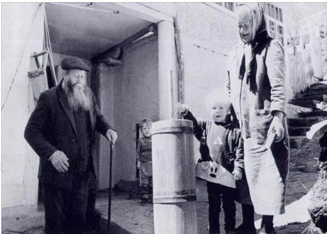
Масло для себя готовят сами