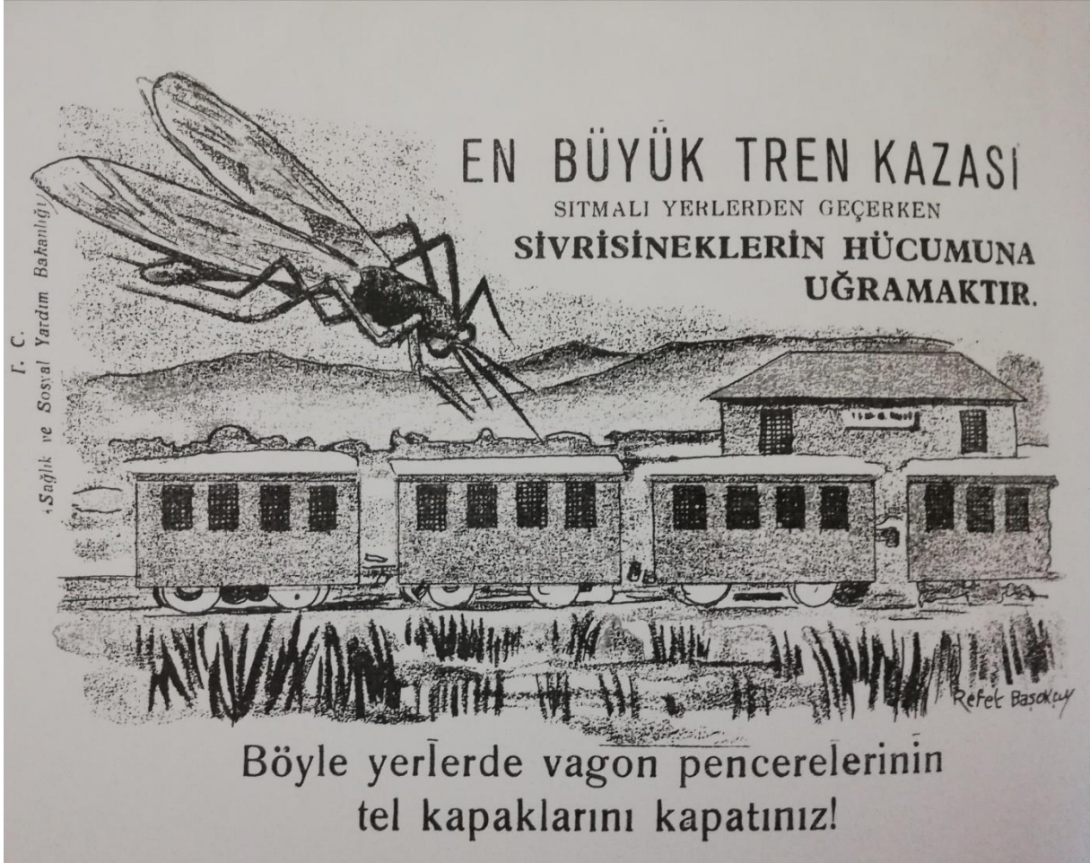
EK 5. Duvar Afişlerine ilaveten köy muhaberatında kullanılmak üzere tertiplenen Sıtma öğütleri kartları. 302