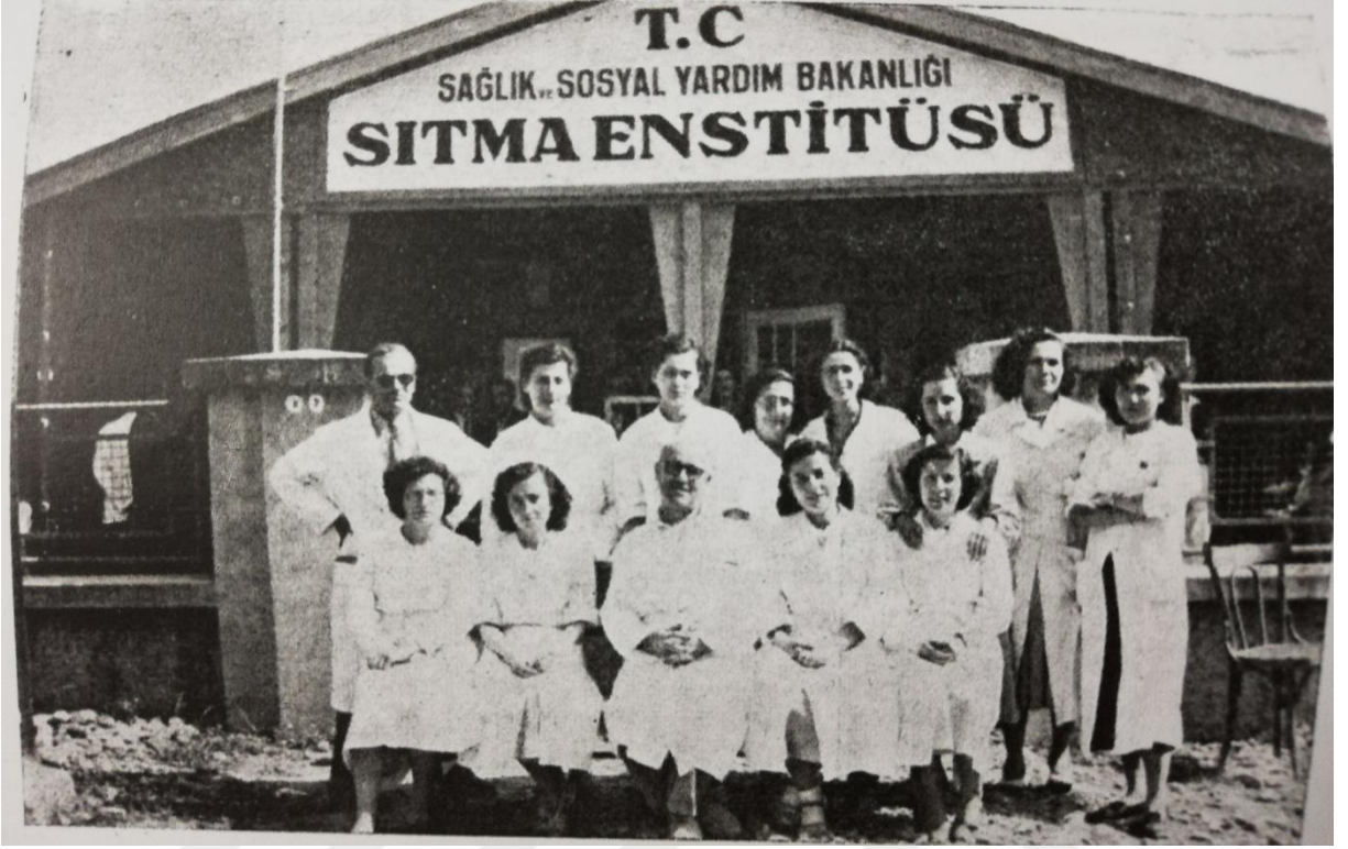
EK 7. Sıtma Enstitümüzün talim heyeti ve 1926 senesi kurs mezunları 304