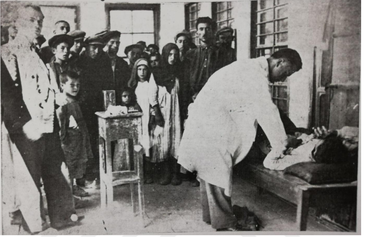
EK 11. Savaş altında bulunan köylerde senede bir defa halk bilaistisna umumi muayeneye tabi tutulur. 307