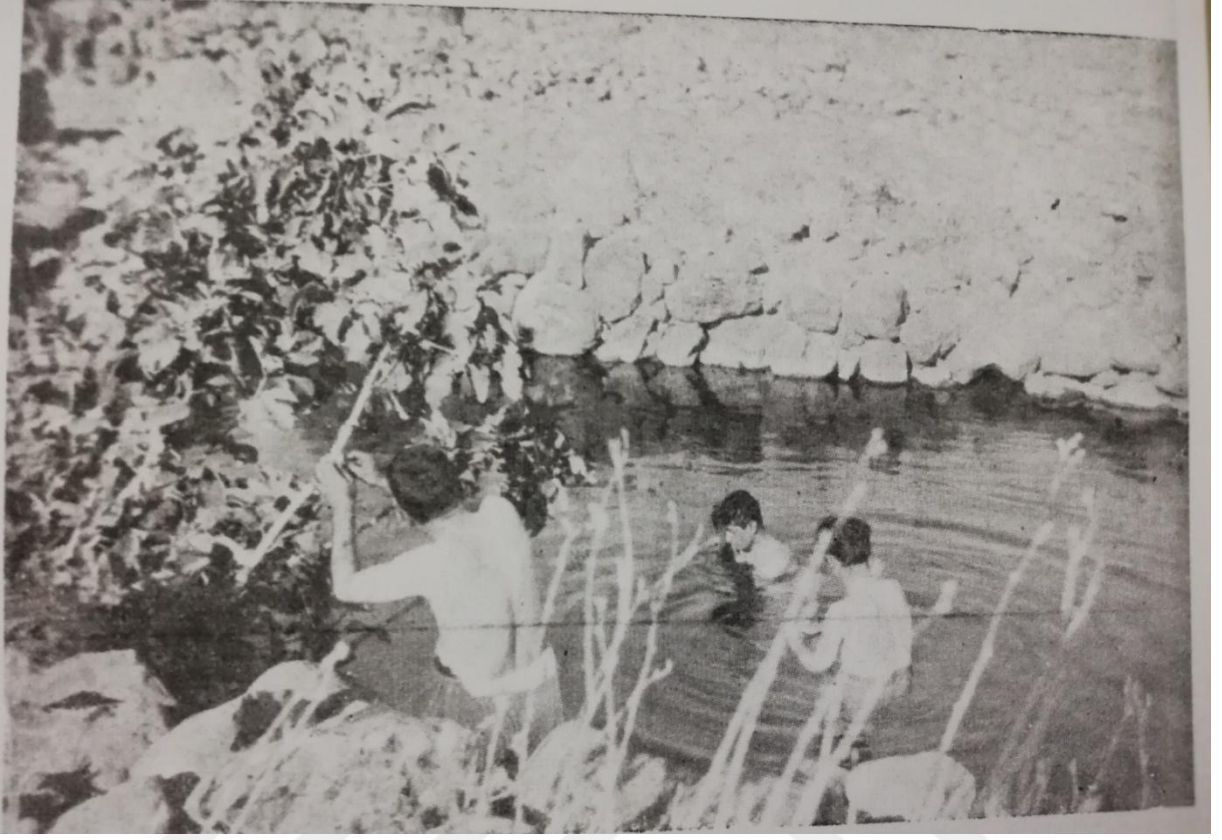
EK 14. Nöbet Tedavisi: Etrafta ki dallara elbiseden yırtılan bir parça bağlanır, kaynağa girilir, giyindikten sonra suya bir avuç tuz serpilerek tuzun suda eridiği gibi Sıtma'nın da eriyip gitmesi temenni edilirdi. 310