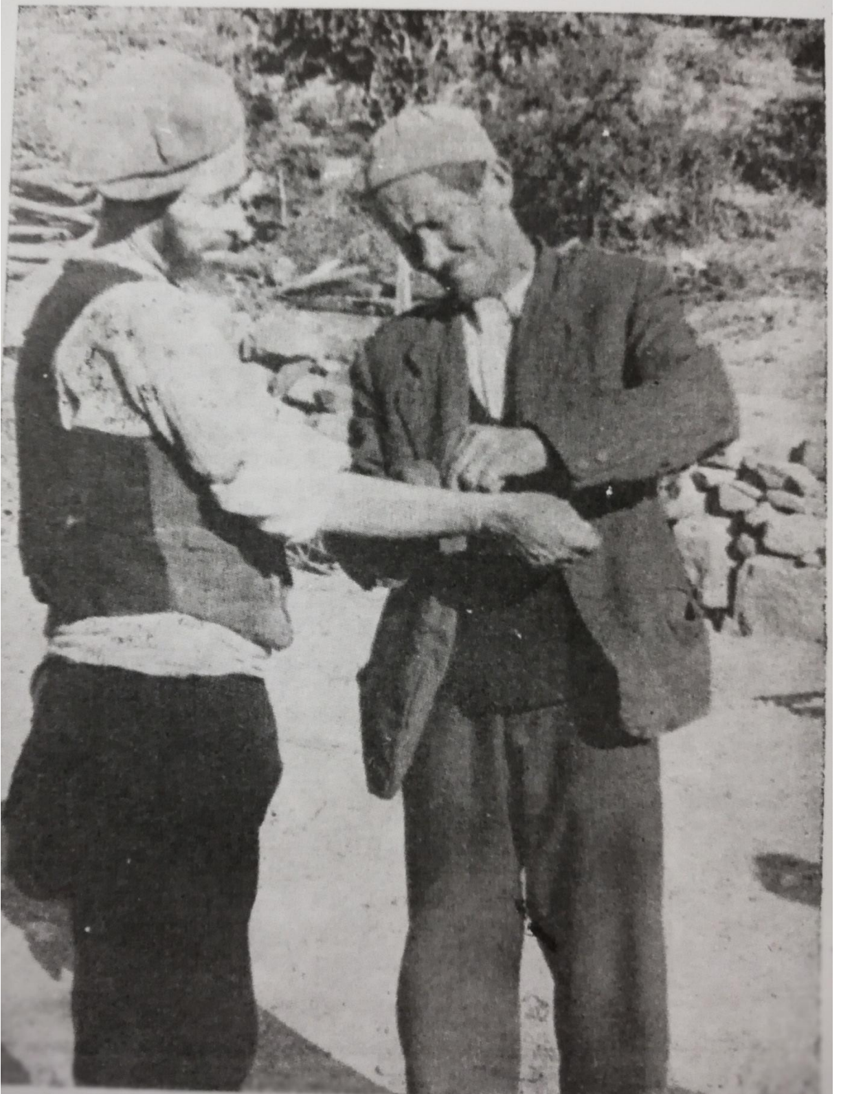
EK 13. Sıtmanın bağlattırılması. 309