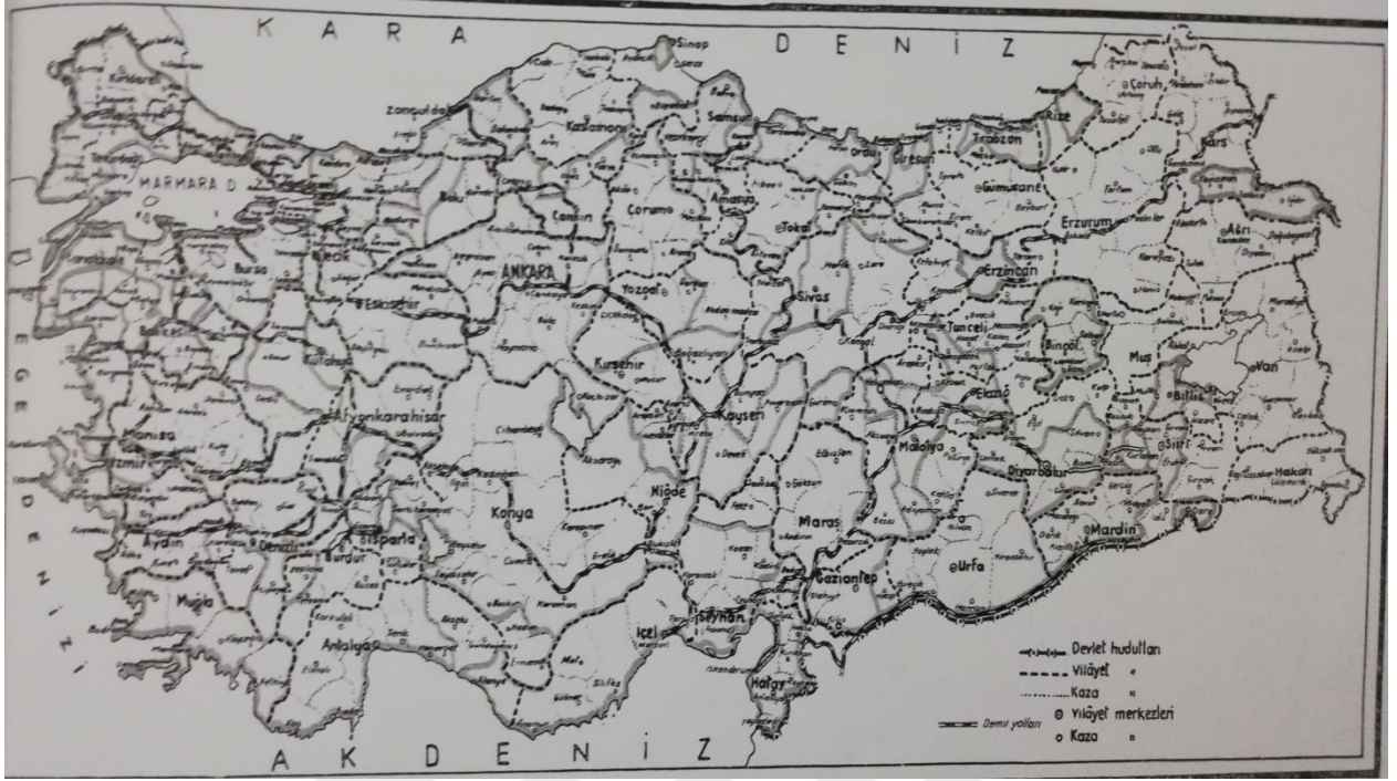
EK 4. 1951 Sıtma Savaş Bölgeleri ve Faaliyet Sahaları 301