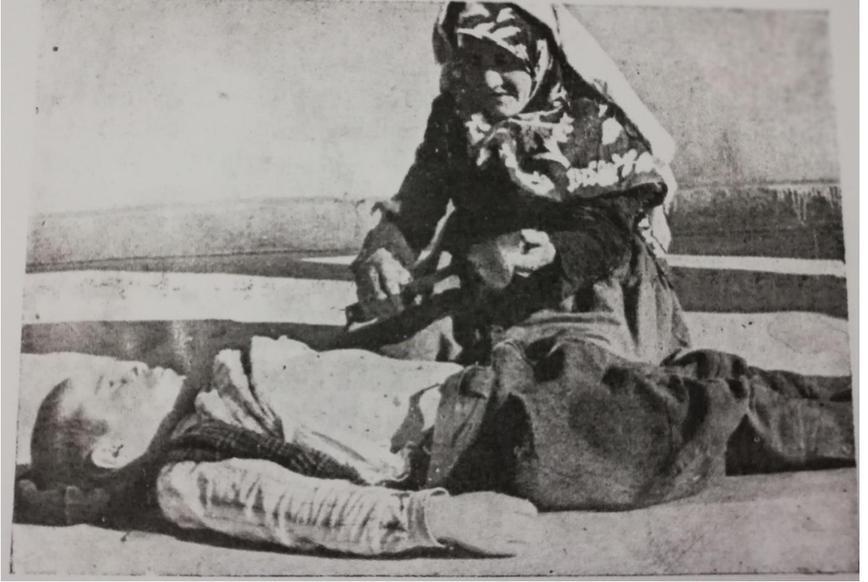
EK 12. Ocak'a mensup bir nine dalak keserken 308