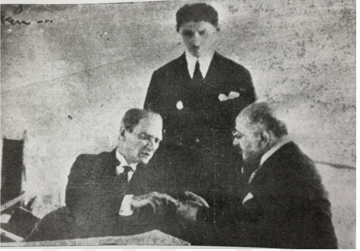
EK 10.839 sayılı Sıtma Savaş Kanununun ilk tatbiki sırasında Ankaralılar meyânında umumi muayeneye tabi tutulan Atatürk'ten kan alınırken. 306