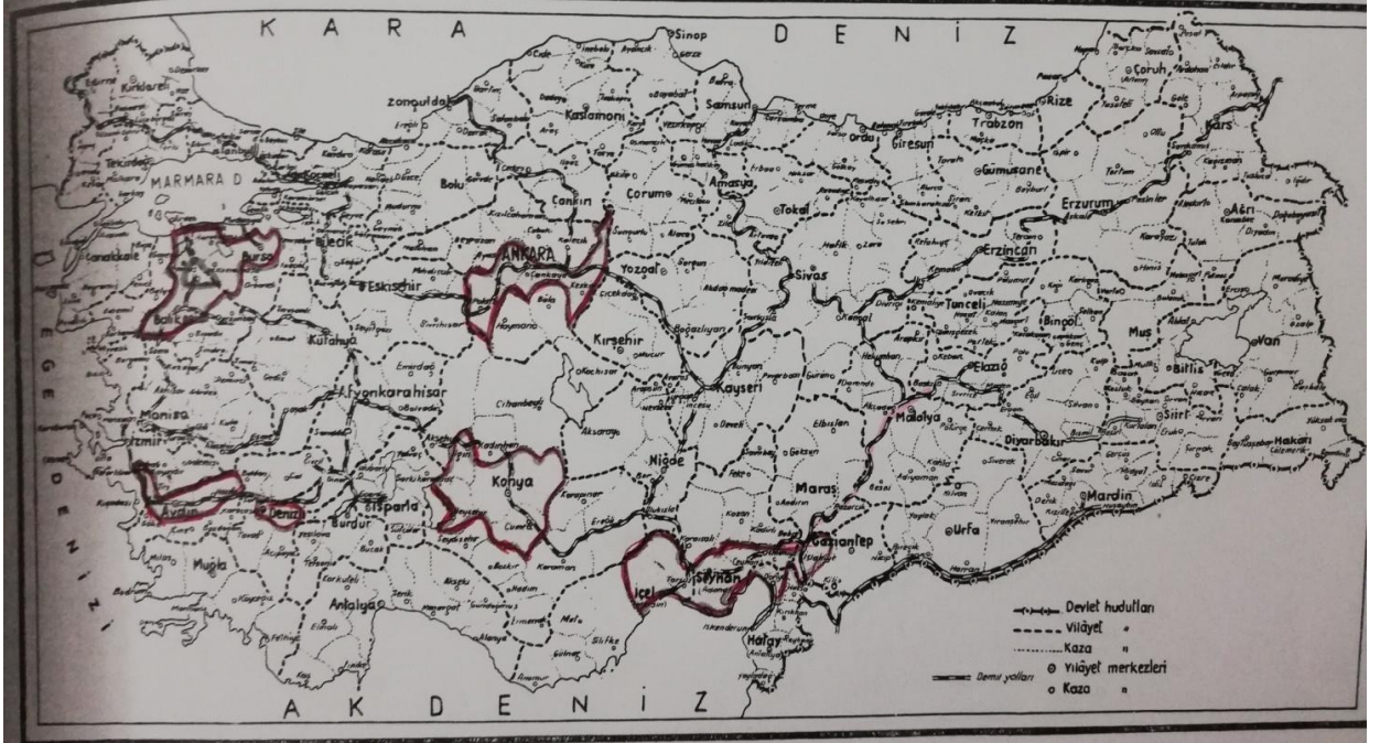
1926 Sıtma Savaş Bölgeleri ve faaliyet sahaları 299