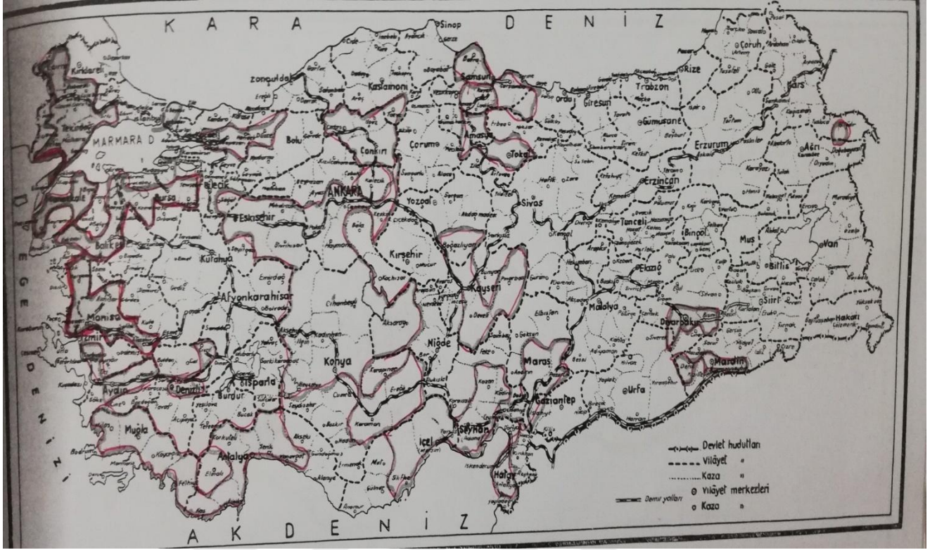
EK 3. 1944 Sıvma Savaş Bölgeleri ve Faaliyetleri 300