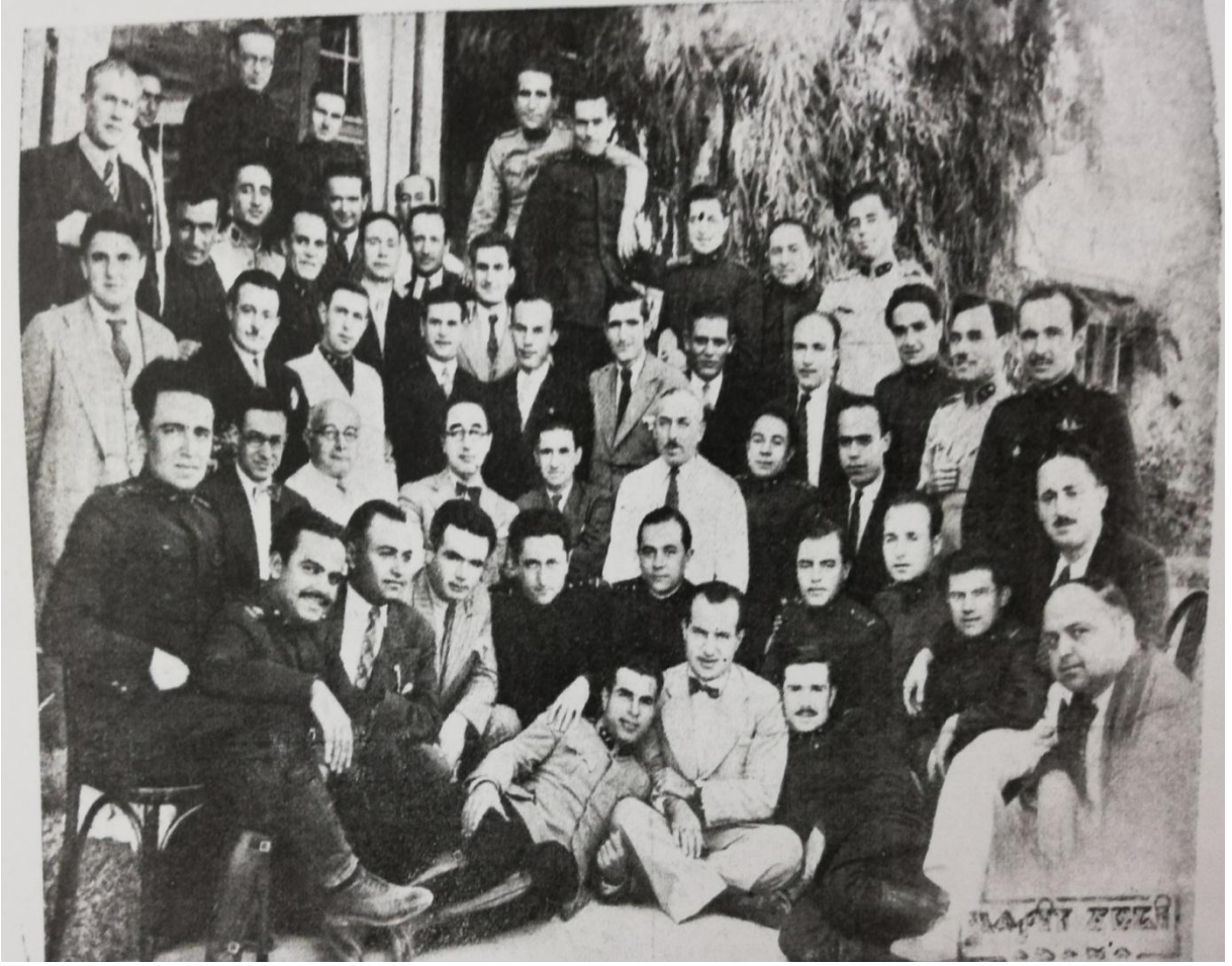
EK 6. Sıtma Enstitümüzün talim heyeti ve 1926 senesi kurs mezunları 303