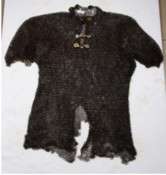
738 Envanter Numaralı Zırh Fotoğrafi