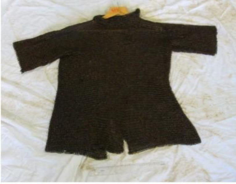
444 Envanter Numaralı Zırh Fotoğrafi