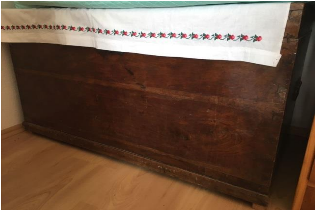
Eski zamanlardan çeyiz sandığı.