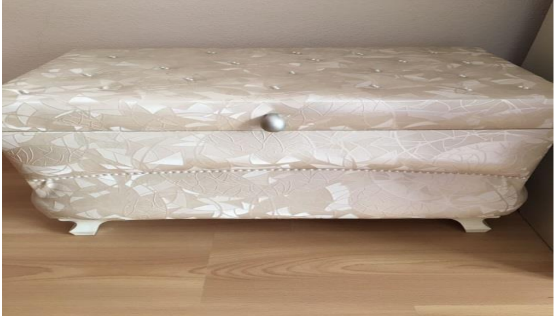
Günümüzde çeyiz sandığı.