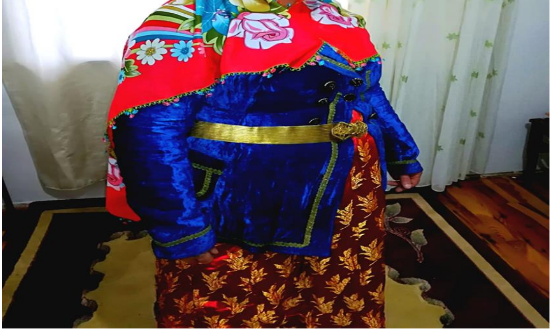
Eski zamanlarda altın kemer ve bindallı.