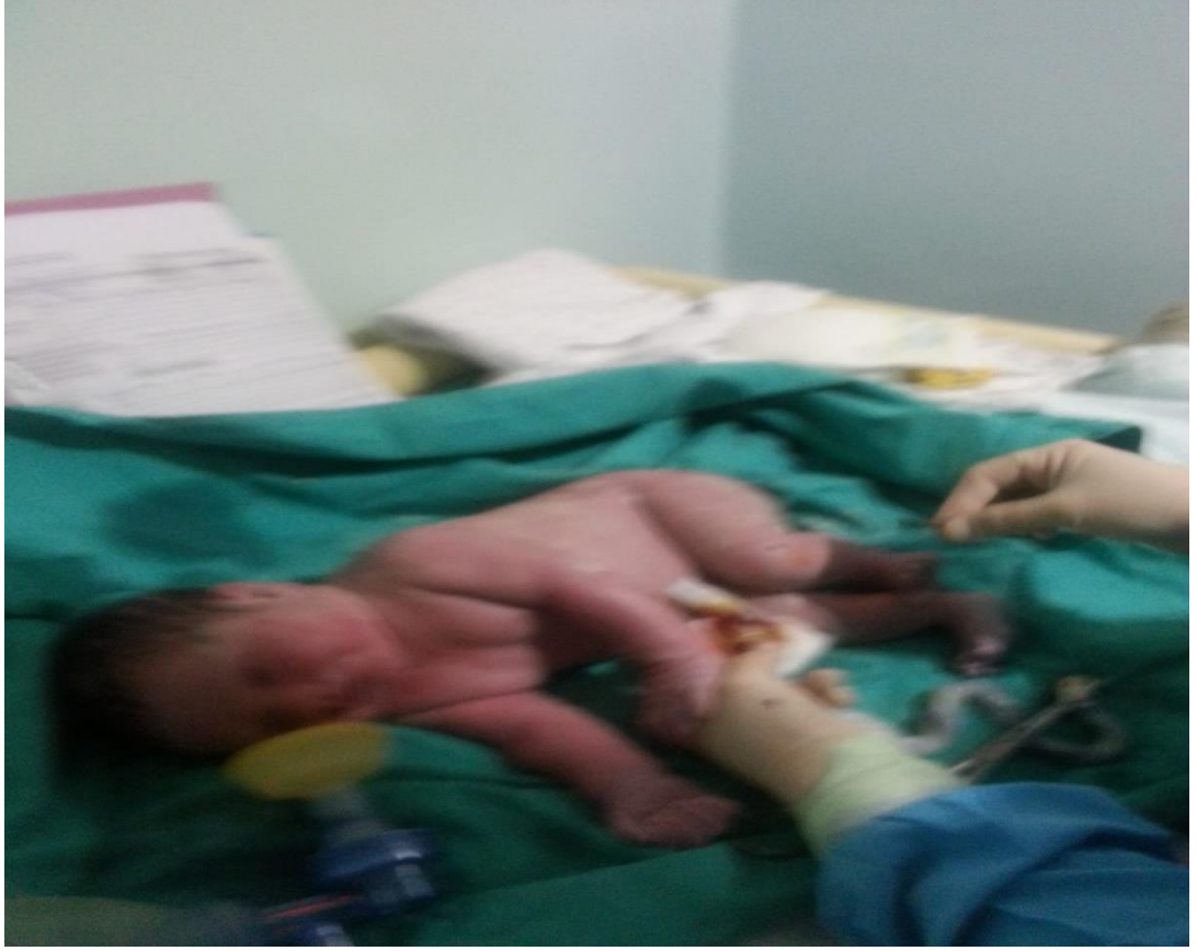
Bebeğin göbek kordonu kesilirken.