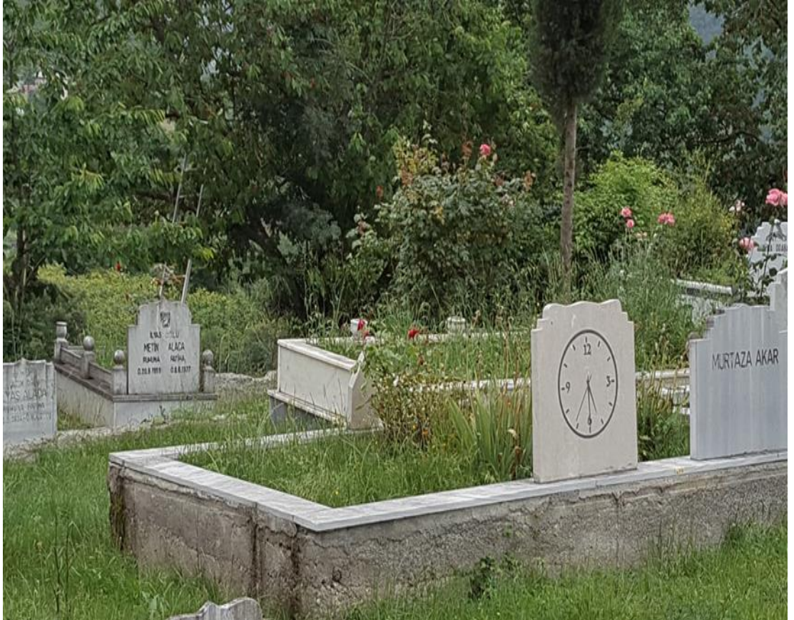
Mezar taşı.