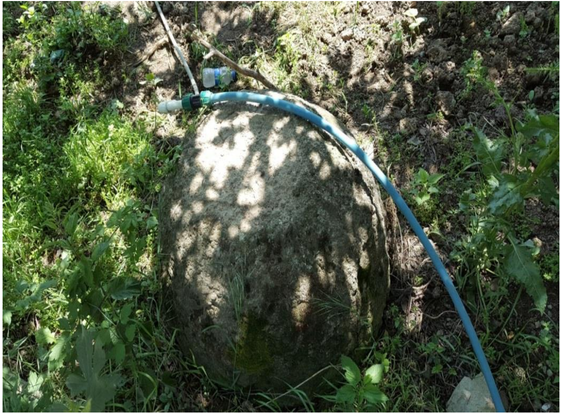
Göllalan mahallesinde düğün yemeği için, buğdayın dövüldüğü dibek taşı.