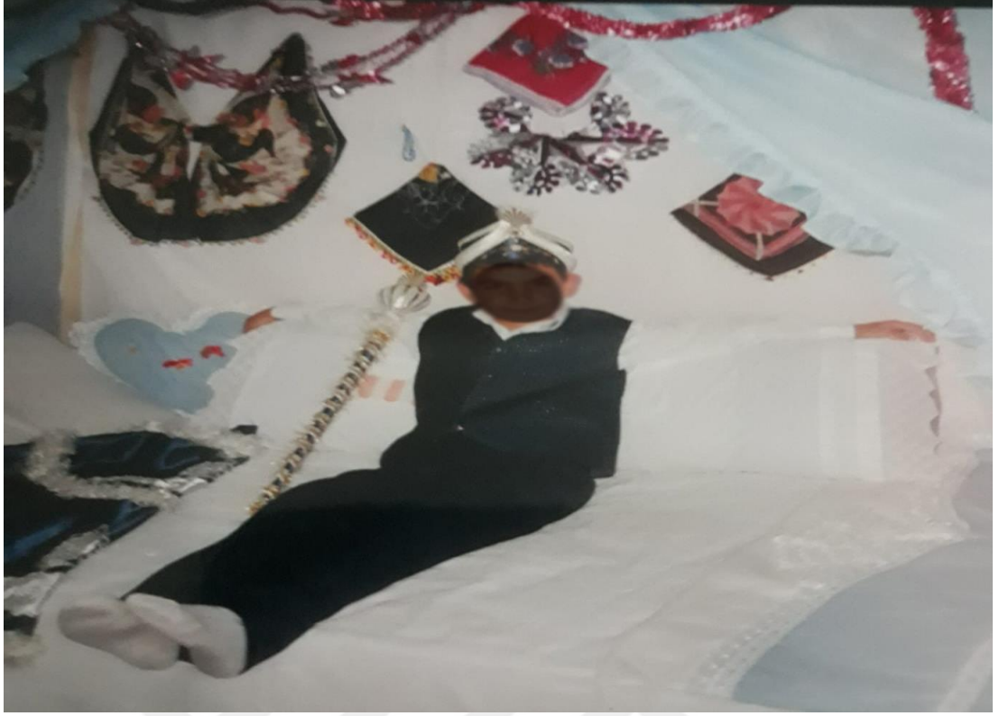
Eski zamanlardan sünnet karyolası.