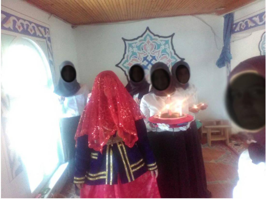
Kına tepsisi ve gelini mumlar eşliğinde kına yakmaya götürme