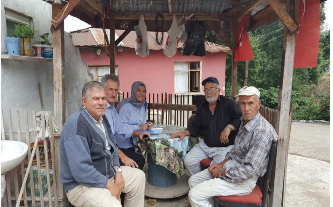
Kozlu mahalle sakinleri ile görüşme sonrası