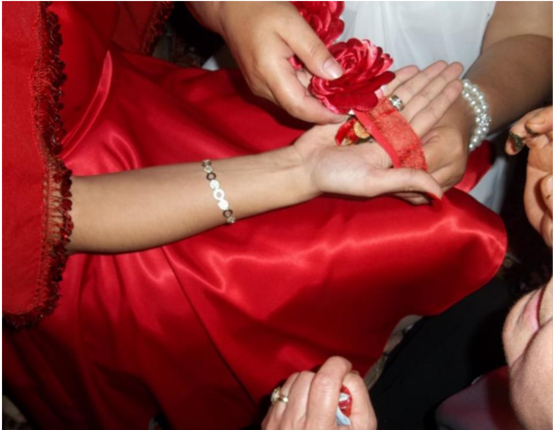
Kına yakma sırasında elini açmayan geline altın verilirken.