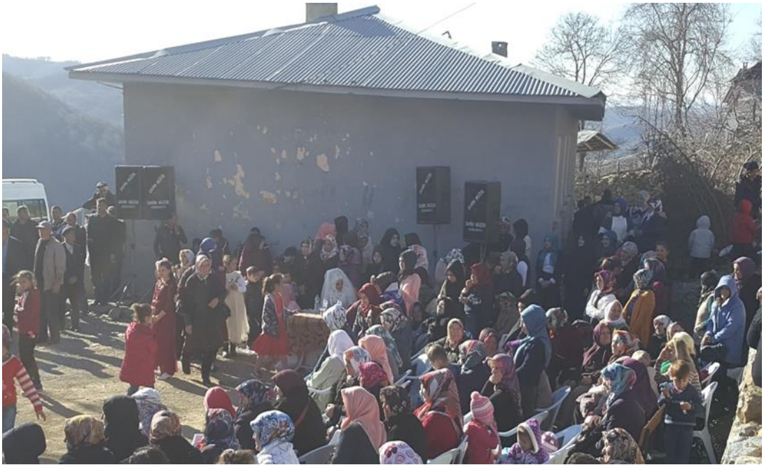
Yayla mahallesinde köy düğünü. (Kişisel arşiv)