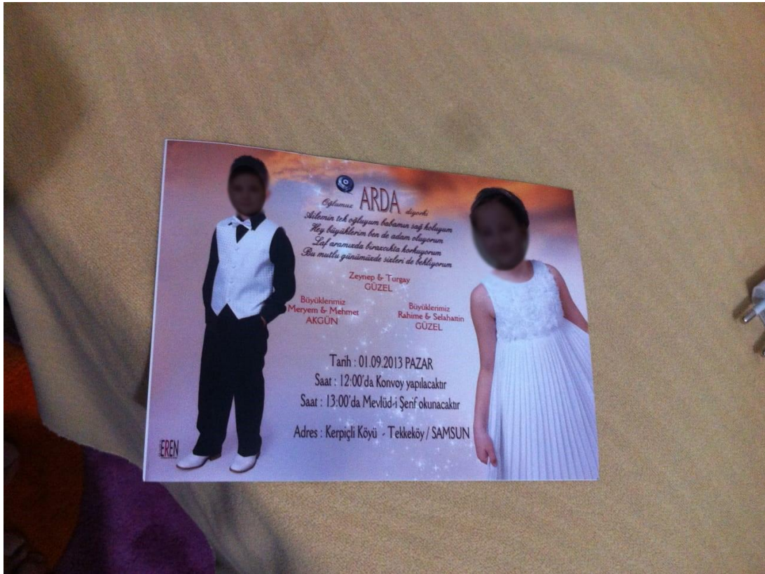
Günümüz sünet davetiyesi.