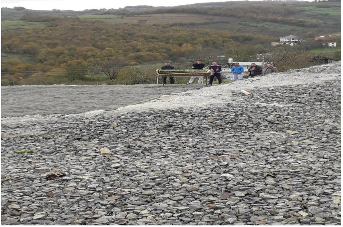
Cenaze namazı sırasında cenaze başında beklenilirken.