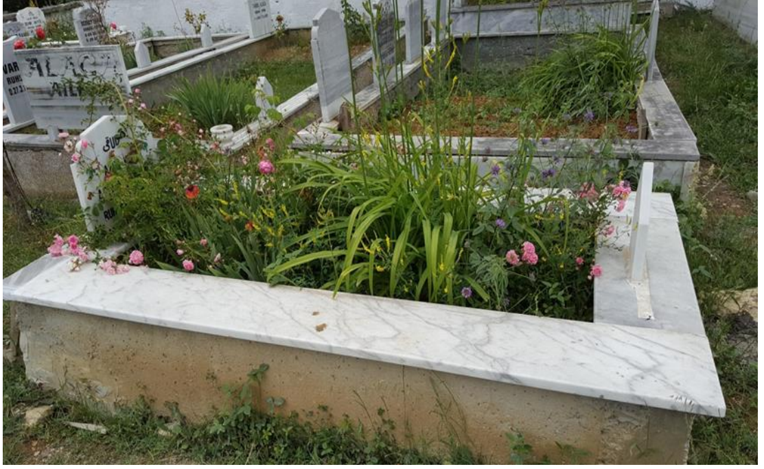
Mezar taşı. (Kişisel arşiv)