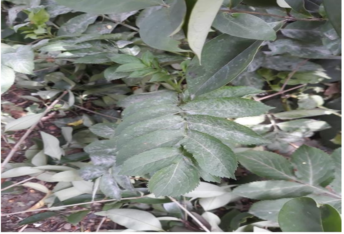
Kozlu mahallesinde gebelikten korunmak için kullanılan sultan otu.