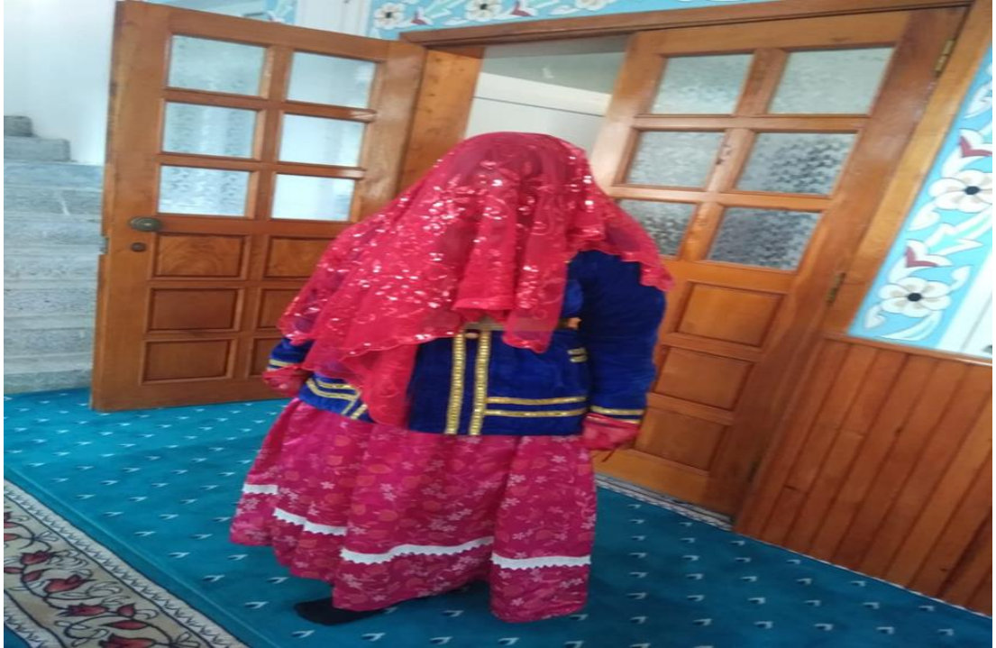
Eski zamanlardan bindallı