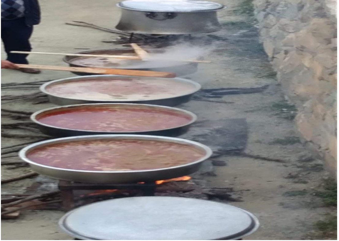
Yayla mahallesinde düğün yemekleri pişerken.