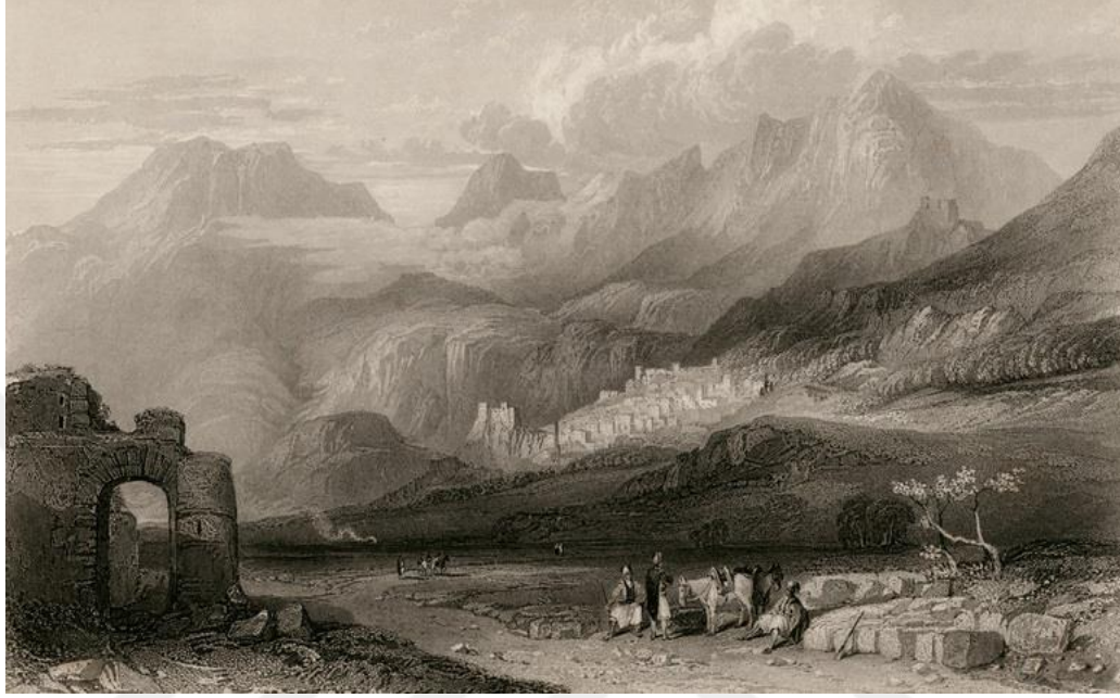
Şekil 3: Aydonat Kasabası ve Kalesi 1499 .

kasabalardan birisi yaptığı fikrine neden olmaktadır 1497 . Sıradan bir Arnavut kasabası olan Aydonat'ın ardında yükselen Curila Dağı kuzey-kuzeybatı doğrultusunda uzanmaktadır 1498 .