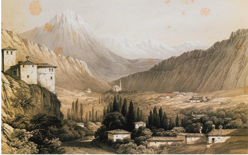
Şekil 4: Filat Kasabası 1635 .

ahalsinin dörtte üçünün Müslüman olmasına rağmen tamamı Yunanistan etkisindeydi 1631 . Tepedelenli Ali Paşa'nın Filat'ı eline geçirmesi 1812'ye tesadüf etmektedir. Bu tarihe kadar ticaretle meşgul olan Müslüman beylerin elindeki topraklar Ali Paşa'nın idaresine geçmiştir 1632 . Bu dönemde Ali Paşa'ya karşı Margılıç, Aydonat, Parga ve Filat ahalisi Solyotların yanında yer almıştır. Ancak bu tarihe kadar gayet gelişmiş bir kasaba olarak tasvir edilen Filat harabe hale gelmiştir. Ali Paşa'ya karşı sürdürülen mücadelede ticari bir merkez olan kasaba adeta köye dönüşmüştür 1633 . Bu durum kasabanın nüfusuna dair verilen bilgilerden de takip edilebilir. Kasabada 400-500 hane ve 2000 kadar kişinin yaşadığına dair ifadelerin üzerinden geçen yarım asırlık sürede nüfus toplamı sabit dahi kalmaz. Böylece 1889 yılında kasabada 434'ü Hristiyan olmak üzere 1576 kişinin yaşadığı anlaşılır 1634 .