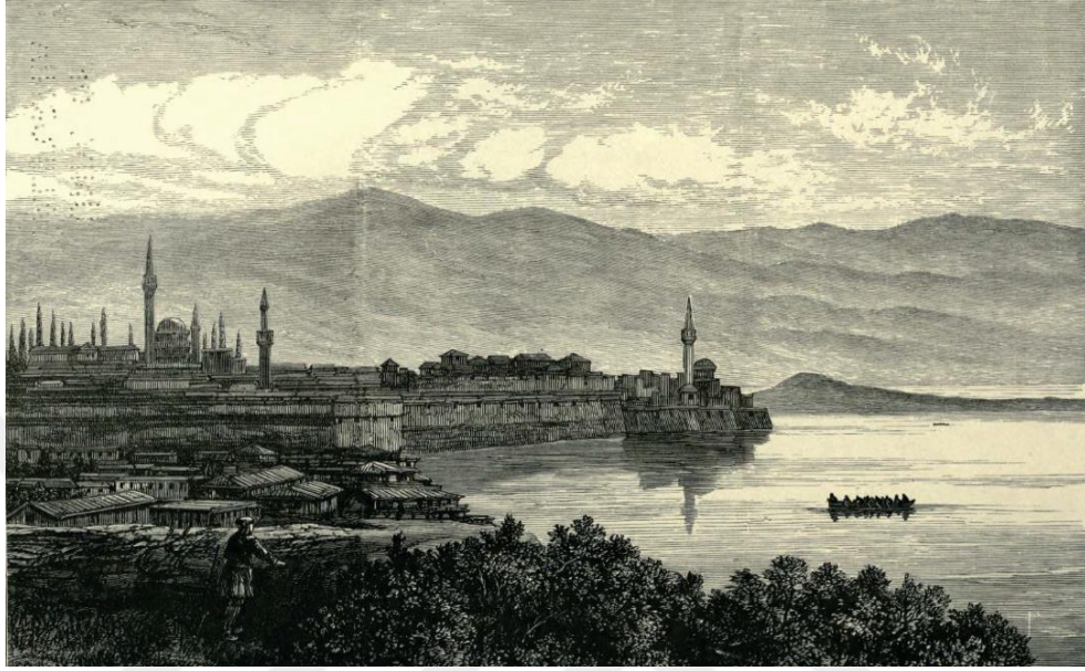
Şekil 1: Narda Girişinden Yanya'nın Görünümü 982 .

kurulduğuna işaret edilmesiydi 980 . Ancak Yanya'nın doğu şehirlerinin karakteristiğinden ayrılığına yapılan bu vurguya rağmen aynı zamanda Türk Kasabası özelliklerini de muhafaza ettiği bilhassa ifade edilmiştir 981 .