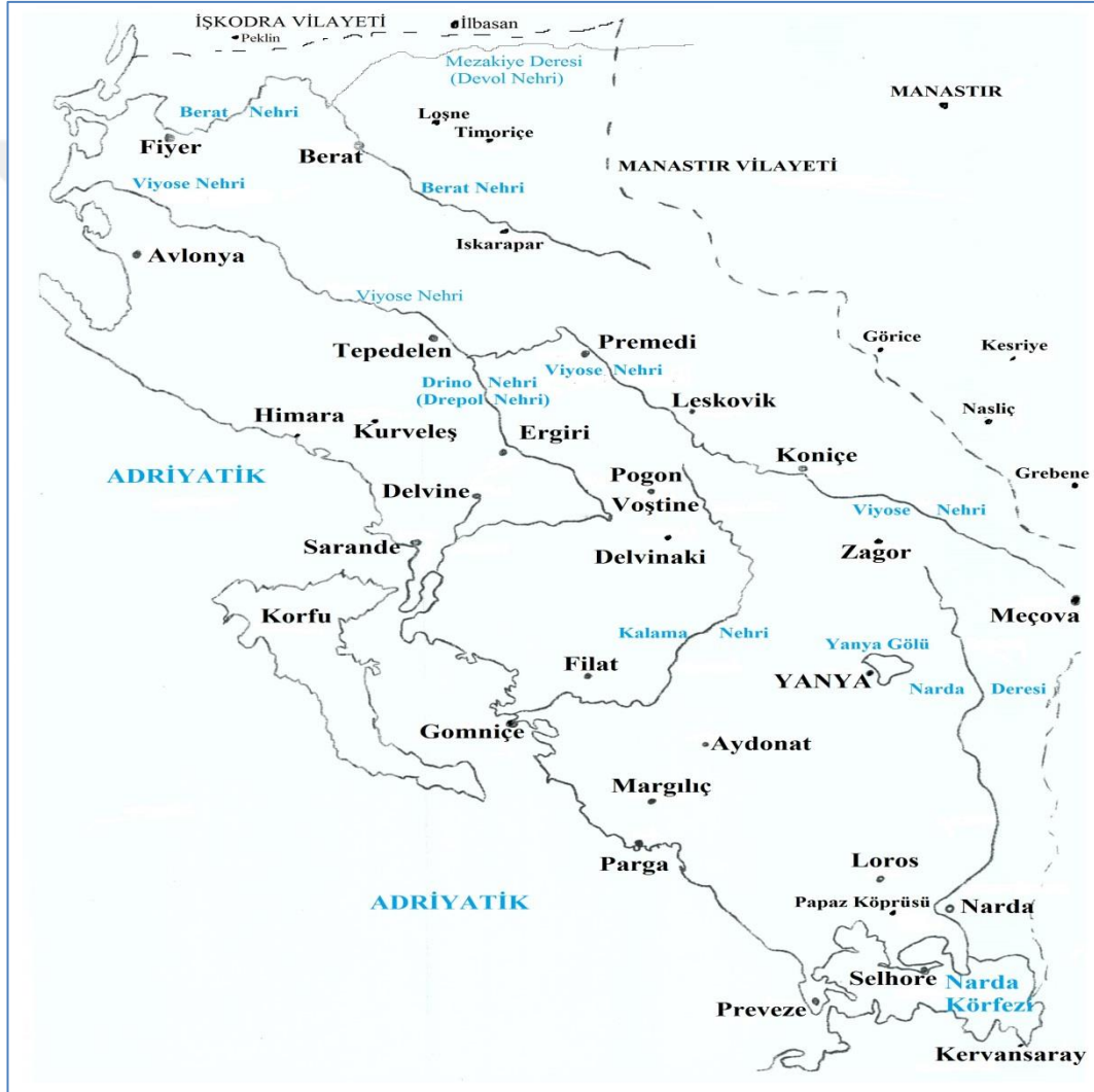
Harita 1: Toskalık, Epir, Laplık ve Çamlık Bölgelerini Gösterir Harita 134 .

kaynaklarda bir diğeri içerisinde gösterildiği ve bu sınırların birbirleri ile örtüşmediği görülmektedir. Bu sebeple birer alt bölge olarak Çamlık, Laplık, Toskalık ve Epir'in kesin sınırlarını çizmek güçtür. Ancak İşkumbi Nehri'nin güneyinden Narda Körfezi'ne kadar olan bölgeye Güney Arnavutluk'un sınırları ile uyumlu olarak Epir ve daha yaygın biçimde Toskalık denilebilir. Bu açıdan bakıldığında bir bütün olarak Güney Arnavutluk'un tarifinde kullanılan Epir , Aşağı Epir , Eski Epir , Toskalık ifadelerinin yanında bölgenin alt coğrafi birimlerinin olduğu anlaşılmaktadır.