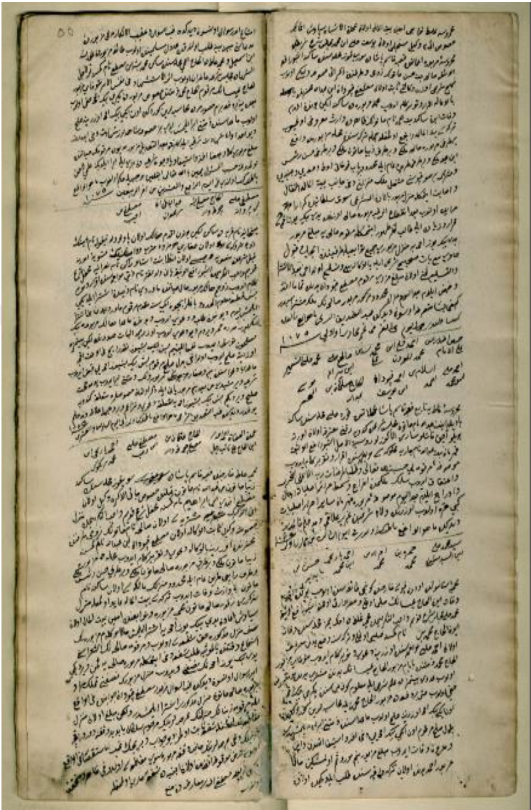
EK. 2. Galata Mahkemesine Ait 94 Numaralı Şer'iyeye Sicili'nin 55. Sayfası