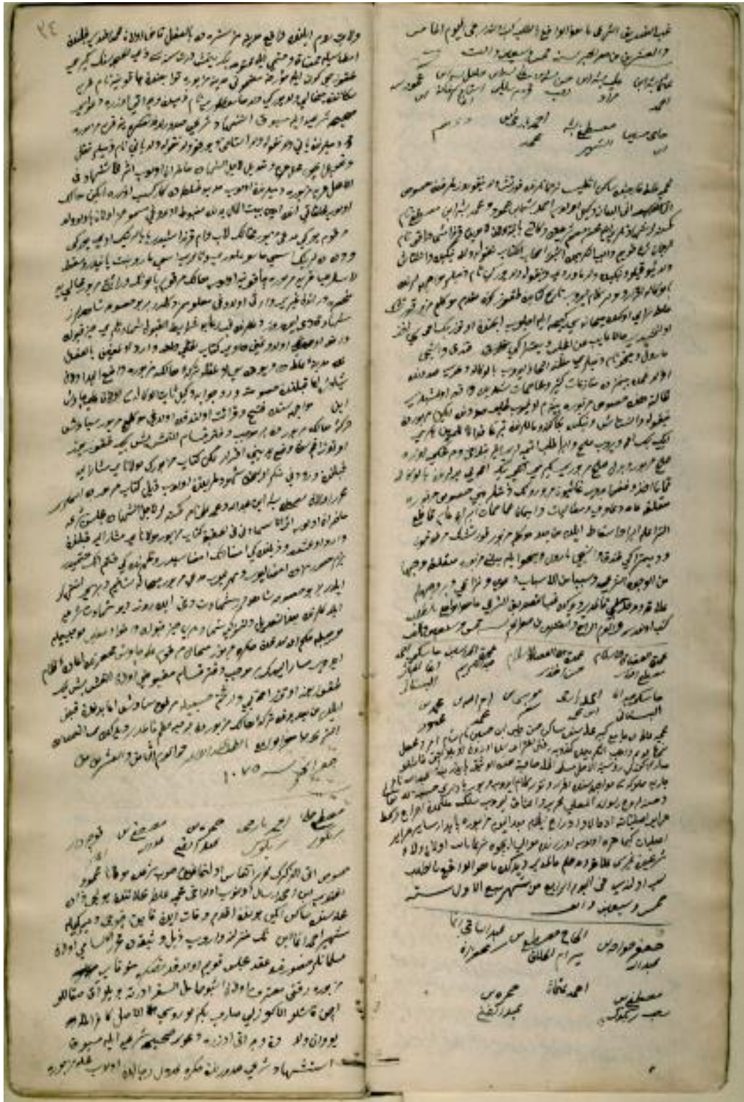
EK. 1. Galata Mahkemesine Ait 94 Numaralı Şer'iyye Sicili'nin 34. Sayfası