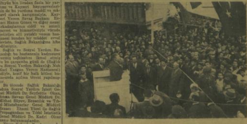
Dönüşü açılış töreninde hazır bakanlar

Kayserililerin Bakanlığa hibe ettikleri hastanenin kadrosu ve teçhizatı Sağlık ve Sosyal Yardım Bakanlığınca ikmal edilmiştir