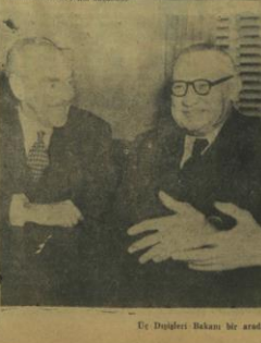
Dr. Dülgerin Başkanı bir arada

Konferansın sonra Ankara ve İstanbul hakkında iki film gösterildi