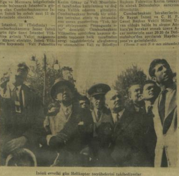
İnanç erveği gün Halkoğlu'nu tezahüratıyla karşılayanlar

Cumhurbaşkanı Haydarpaşa'da kalabalık bir halk kütləsi tarafından büyük sevgi tezahürleriyle uğurlandı