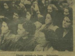
Dükkân İstanbul'da basın toplantısı Ankara kadınlar toplantısı

Cumhurbaşkanı İsmet İnönü Ankara seçmenlerine yazdığı mesajı gündemlendirdi. Ankara'daki, Sevgili Hemsöhrlerim, Seçim bölgelerim olan Ankara'nın ilkerlerinde ve Malatya'dan başlayarak, yurdum bir çok yerlerinde söyledim seçen mutlaklarımla Ankara Hemsöhrlerime yazdığım mesajlarımla konuşmak hepimizin için müstesna bir zevktir. Bölgelerin ekli olan ve birbirini tamamlayan bir seçim mutlaklarındaki esaslar, bir Ankara aday seçtiğiyle, Cumhuriyet Halk Partisinin Seçim Beyannamesine katarak takdirinize arz ediyorum. Hizmetimiz yeni bir seçim devresi için emrinizdedir. Membelerimiz geleceği beklemekten birinci derece de ehemmiyetli vazifemize, yerleşmiş ve gelecekte için hep senelerden bütün dikkatimizi üzerinde topladığımız demokratik hayatın yeni bir büyük misyonunu veriyoruz. Vatandaşlarımızın seçim mücadeleleri sırasında milletvekili seçmelerine katkıları için büyük teşekkürler. Ankara seçmenlerine büyük hımetler dilerim. İSMET İNÖNÜ