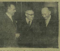
Üç Dış Bakanı, Ankara, Berlin ve Stokholm Londra toplantısı sırasında bir araya