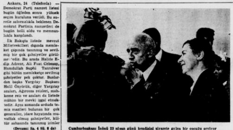
Cumhurbaşkanı İsmet İnönü'nün yanında Celâl Bayar ve diğer D.P. liderleri

Celâl Bayar ve umumi idare heyeti âzaları yurtta büyük seçim propagandası seyahatine çıkıyor