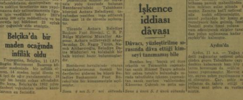
Belediye Başkanı ve Şehir İşleri Müdürü

Belediye Başkanımız o semtte ve şehrin işlerine hızla devam edildiğini söyledi