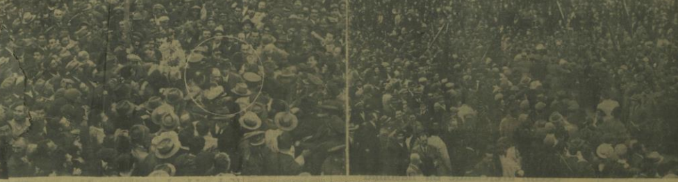
Cumhurbaşkanımız İnönü'nün evvelki gün İstanbul'da karıştığından iki intiba

Cumhurbaşkanı, esaslarını tahakkuk ettirmeğe muvaffak olduğumuz demokratik rejimin muhafazası da büyük gayrete bağlıdır, dedi