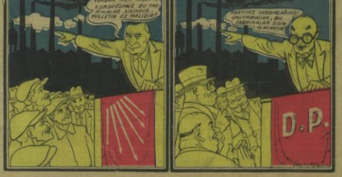
Millet için "Derletçilik"