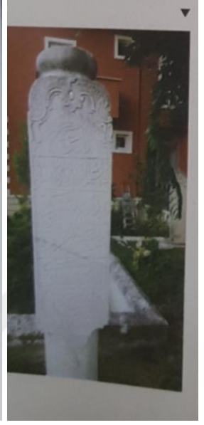
Hacı Ali (Şeyh Ali Oluklubayır) Tekkesi bahçesi