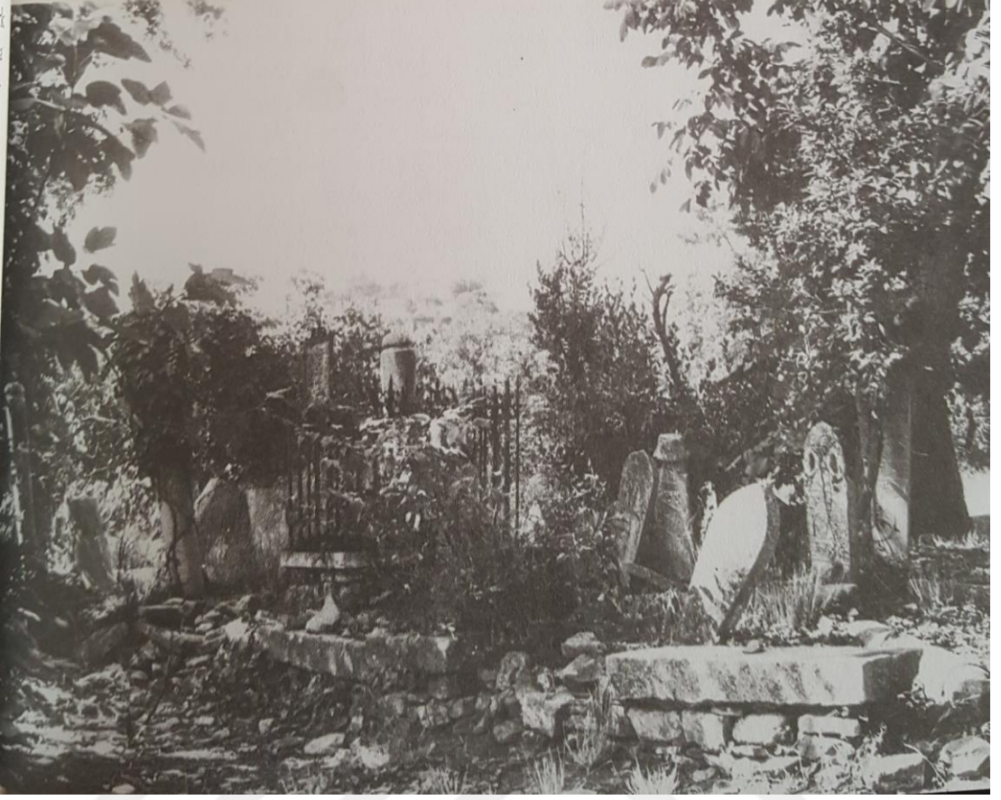
Hacı Ali (Şeyh Ali Oluklubayır) Tekkesi