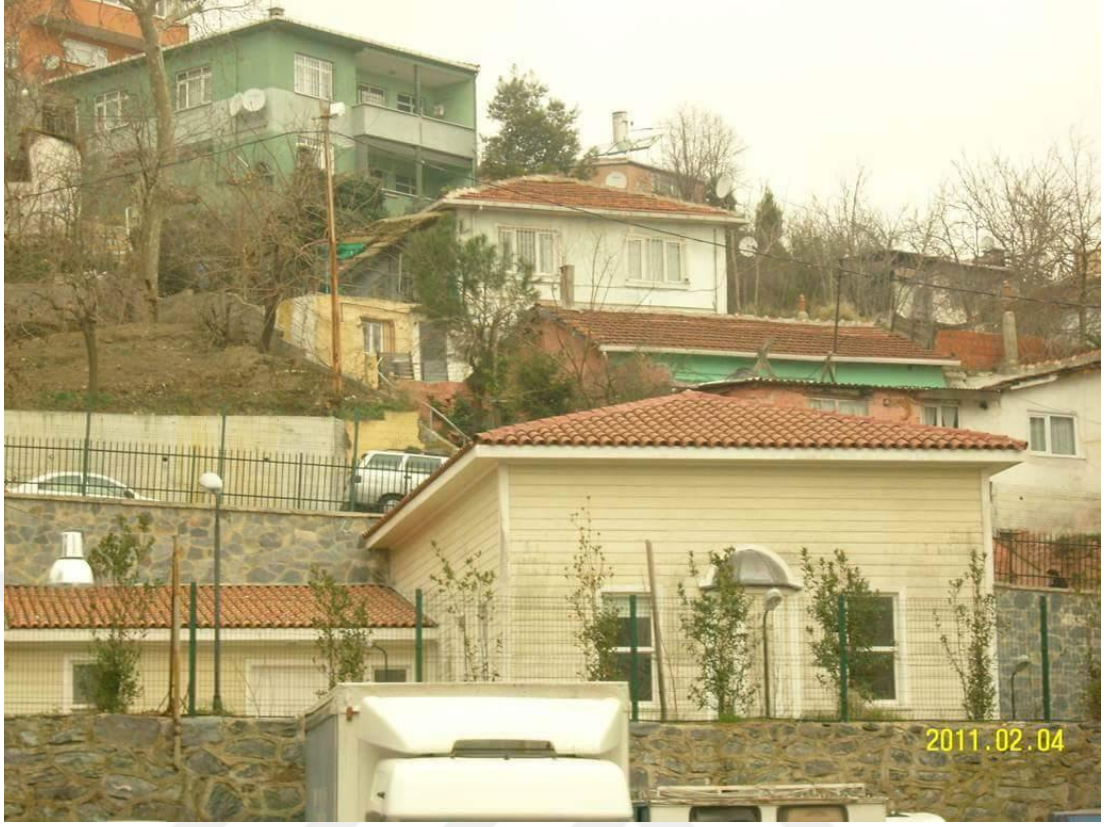
Hacı Ali (Şeyh Ali Oluklubayır) Tekkesi