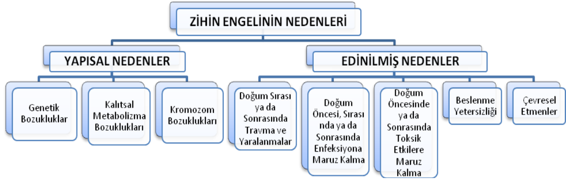
Tablo 1. Zihin Engelinin Nedenleri

Böyleyken mevcut bilgiler ışığında genel sınıflandırmalar teorik ve uygulamada rahatlık sağlaması açısından önemlidir. Zihin engelinin nedenlerini çeşitli şekillerde sınıflandırmak mümkündür. Tekin-İftar'ın (2009), yapmış olduğu sınıflandırma genel kabul gören, kapsamlı bir sınıflandırma olmasından dolayı aşağıda tablo halinde sunulmuştur.