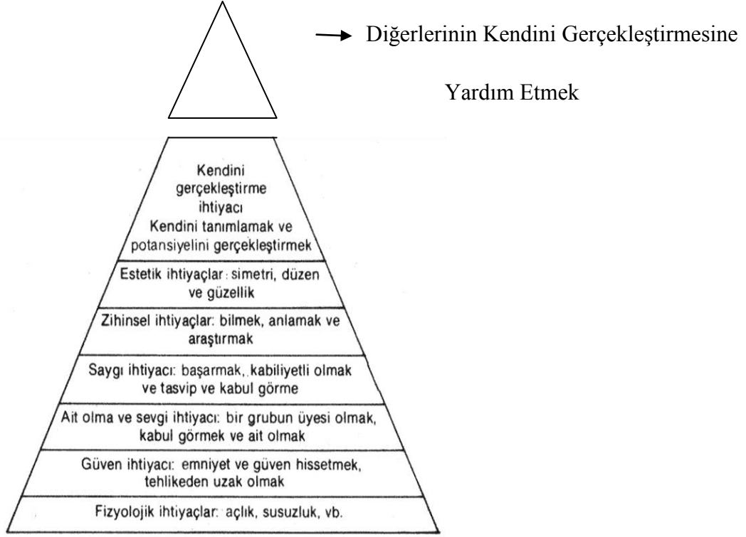
Şekil 1. İhtiyaçlar Hiyerarşisi

Beş temel gereksinimden biri olarak ait olma ihtiyacı, fizyolojik ihtiyaçlar ve güvenlik ihtiyacı bir ölçüde doyurulduğunda ortaya çıkmaktadır. Birey diğerleriyle ilişki kurma arzusuna odaklanmaya başlayınca ait olma ihtiyacını hissetmektedir. Bu ihtiyaç, romantik partneri, yakın arkadaşlara sahip olmayı, evlenmeyi ve çocuk sahibi olmayı içermektedir (Poston, 2009, s. 350). Ait olma duygusu, bir grup olma, grubun hedefleri ve zaferleri ile tanımlanma, kabul edilme ve bir yere sahip olmayı ifade etmektedir (Maslow, 1948).