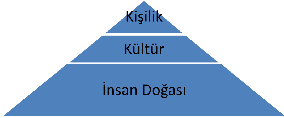
Şekil 1 : Hofstede'nin Zihin Programlama Aşamaları

Bireyin yaşaması olası olan belirsizliklerin içeriklerinin oluşmasında kültürün etkisini gözardı edemeyiz. Kültür de diğer psikolojik ve sosyal kavramlar gibi değişik şekilde ifade edilegelmiştir. Kültür’ü Hofstede; “kültürü aynı sosyal çevre içinde yaşanılmış ya da yaşanan olayların paylaşılmasıyla öğrenilen kolektif bir olgu olarak tanımlarlarken, “sosyal yaşamı” ise yazılmamış kurallarından oluşan ve bir grup insanı diğerinden ayırt eden insan aklının kolektif zihin programlaması olarak tanımlamaktadır. Bu programlama insan doğası, kültür ve kişilik olmak üzere üç boyutlu bir süreçten oluşmaktadır.